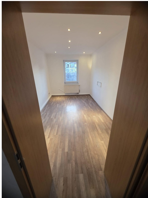
Blick ins Wohnzimmer