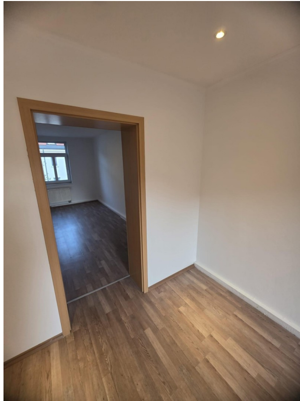
Blick zum Schlafzimmer