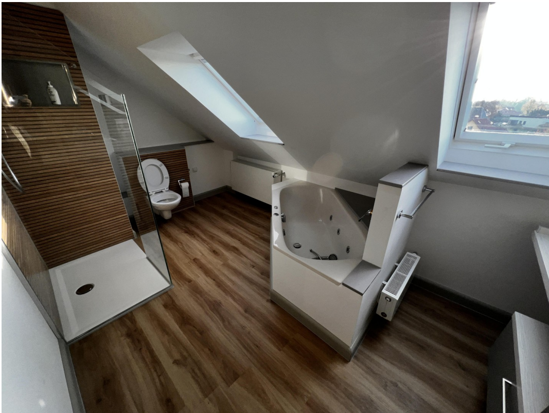
Badezimmer m. Wanne und Dusche