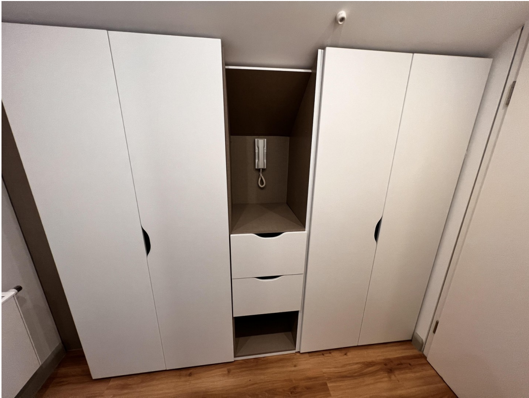
Eingangsbereich mit Garderobe