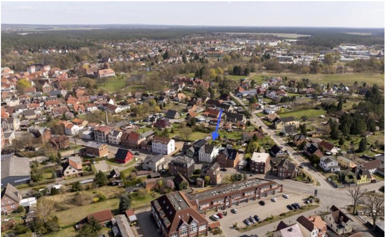
Lage innerhalb der Stadt