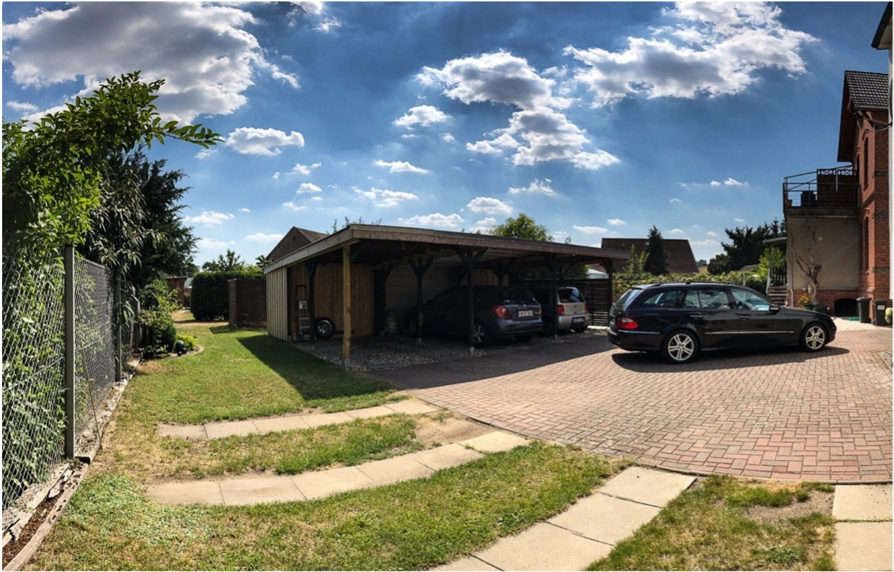
Hof mit Carport