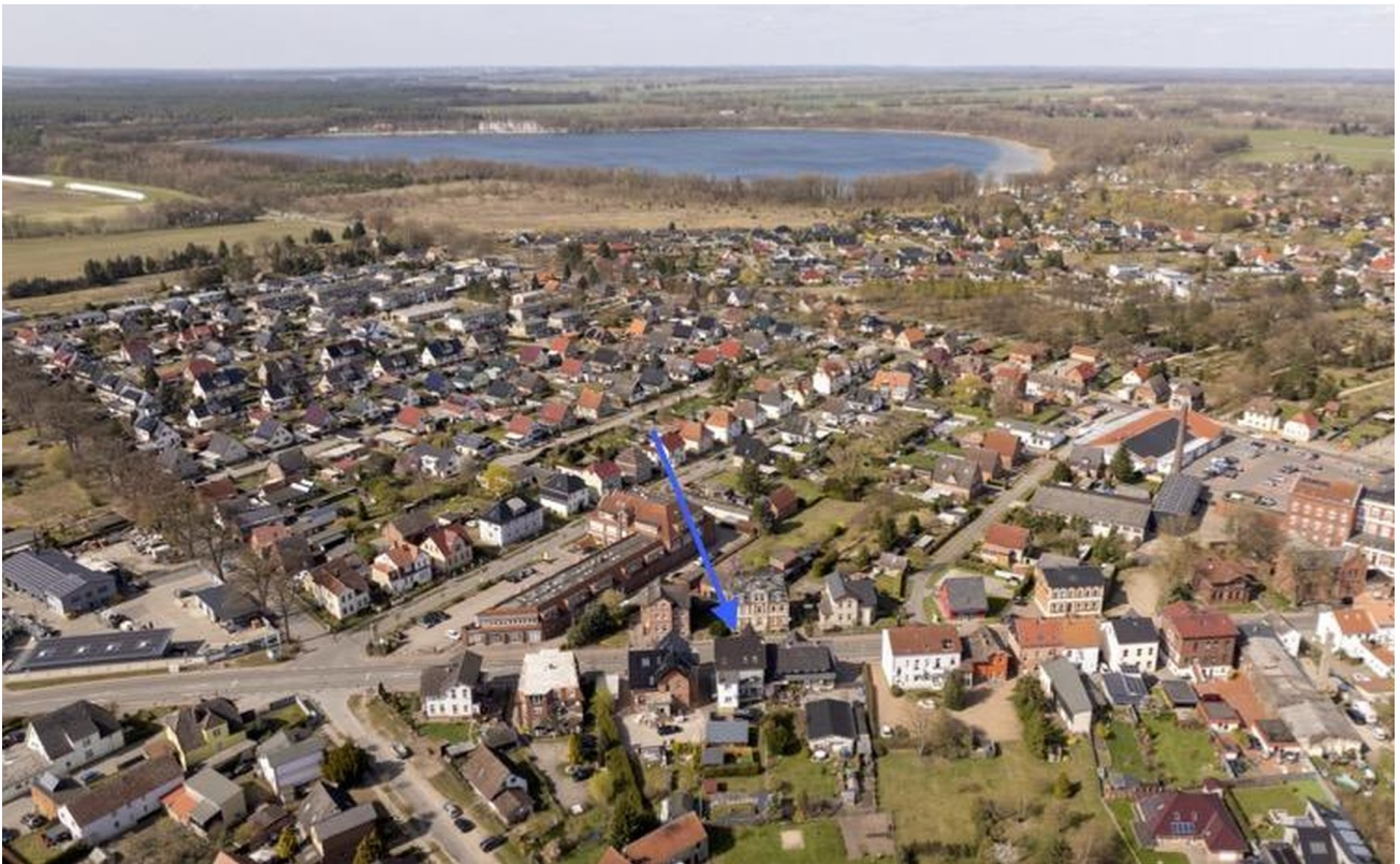
Lage innerhalb der Stadt