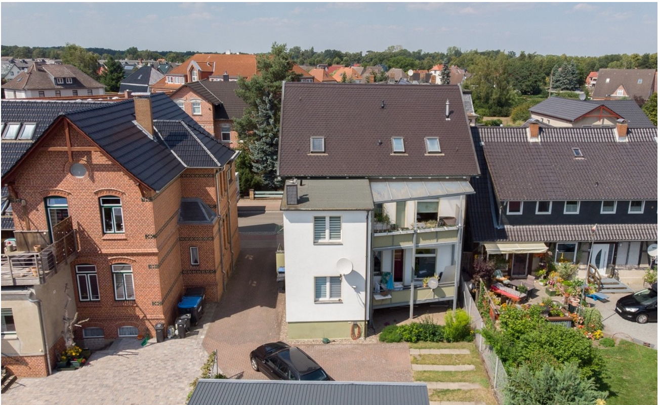
Rückseite des Gebäudes