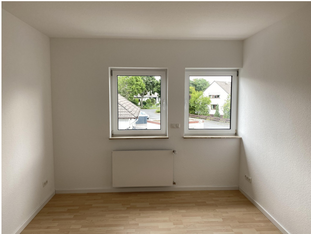
1OG Zimmer 1