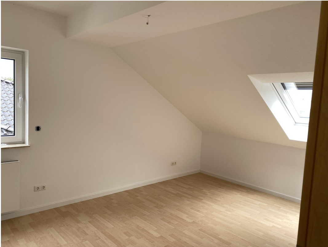
DG Zimmer 3