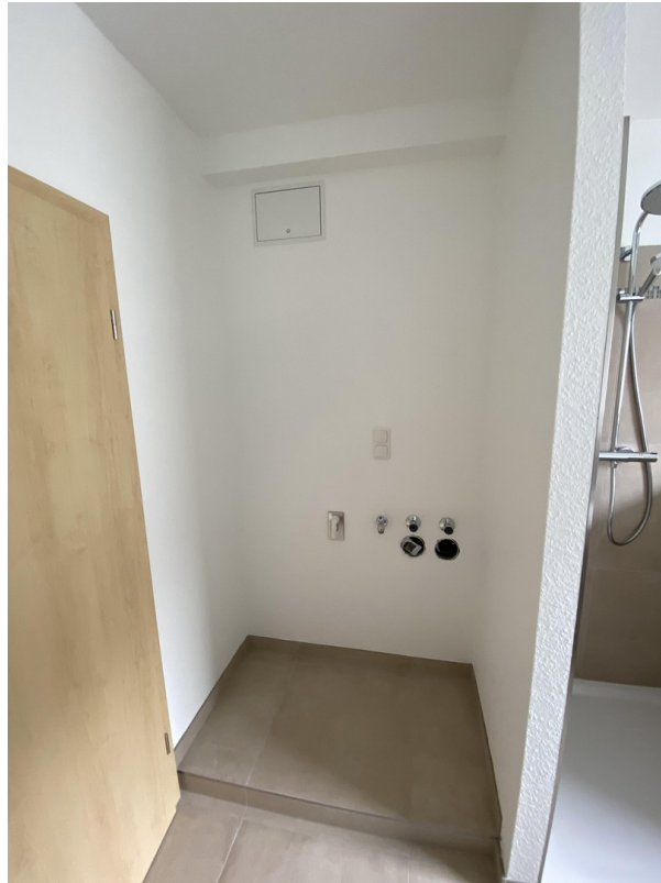
1OG Bad Waschm.+Trockner