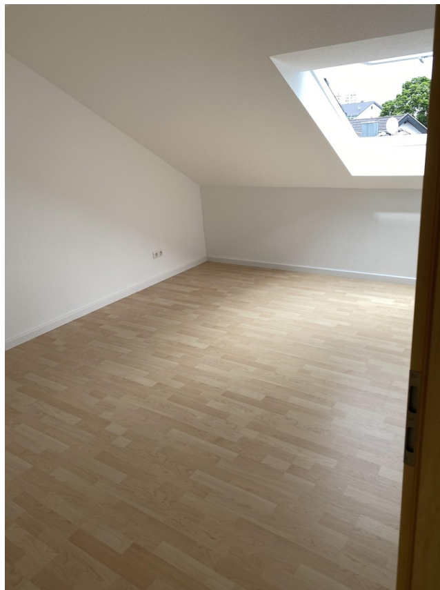
DG Zimmer 3