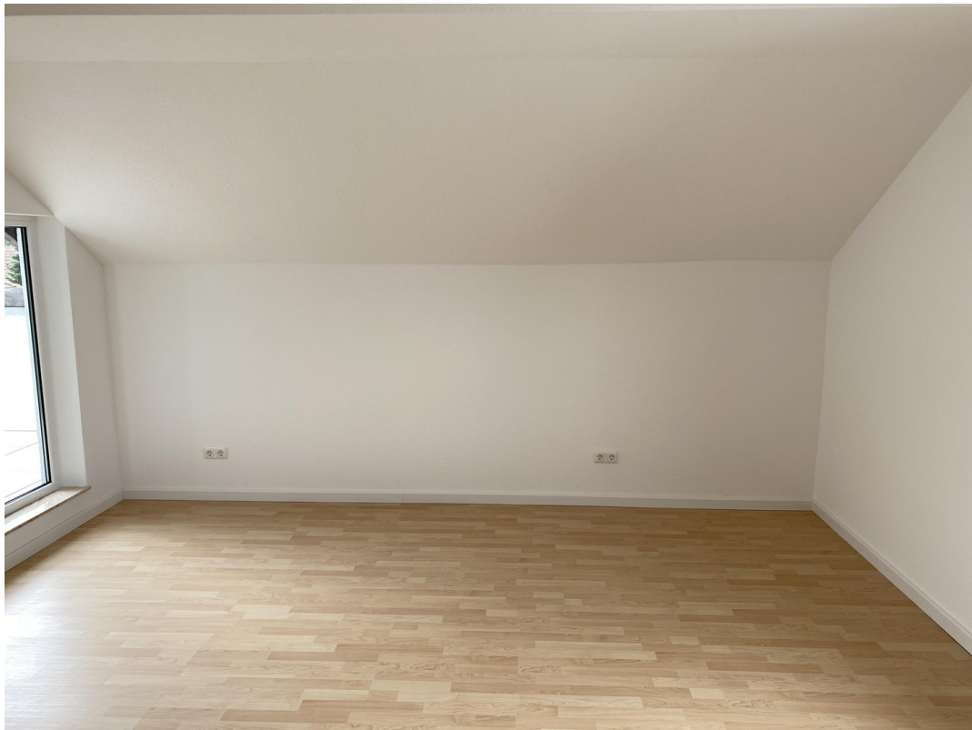
DG Zimmer 2