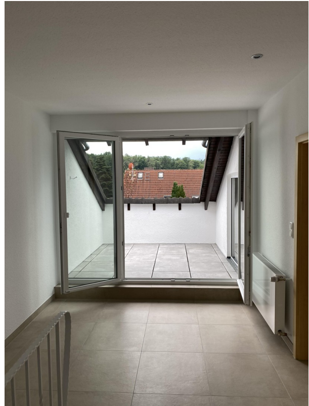
DG Flur - Loggia