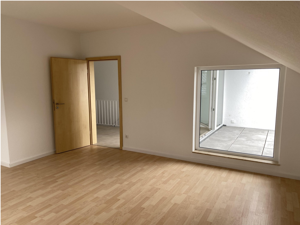
DG Zimmer 2