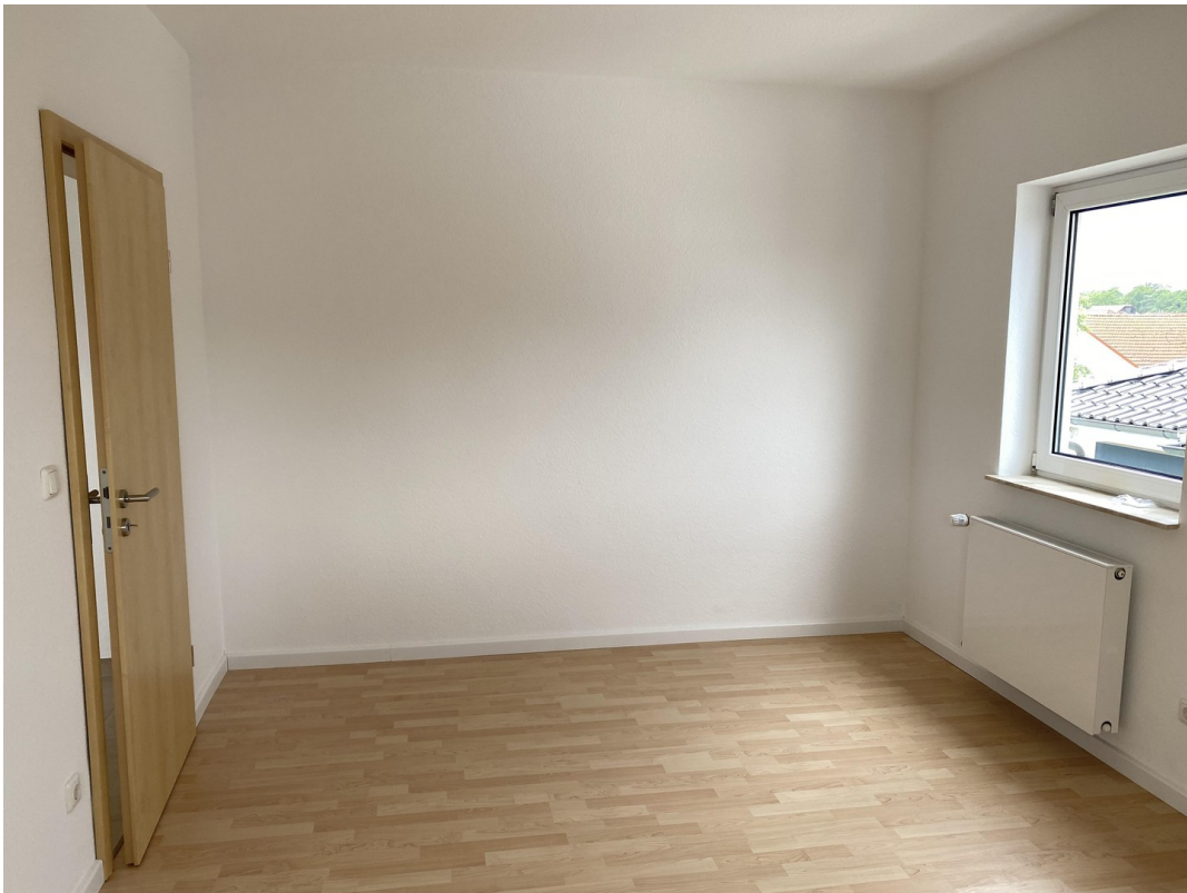
DG Zimmer 3