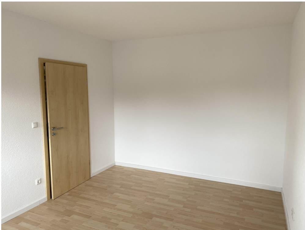
1OG Zimmer 1