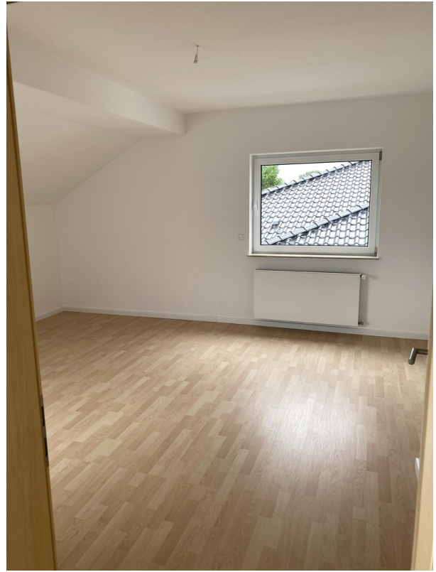
DG Zimmer 2