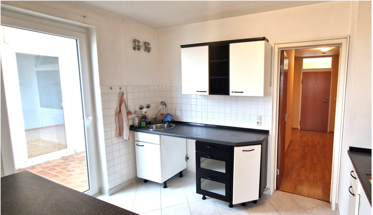
Küche mit Balkon