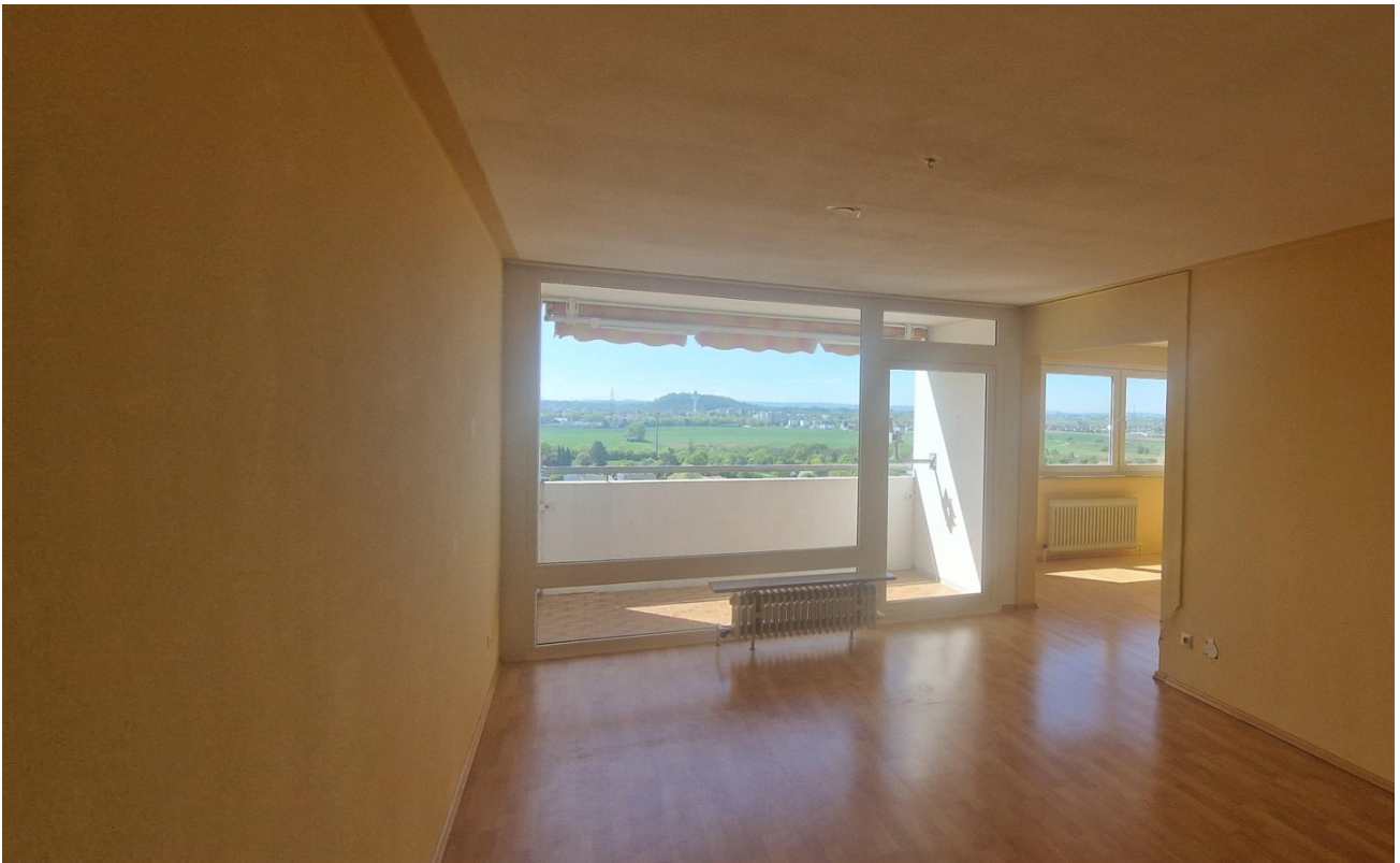
Wohn- Esszimmer Aussicht