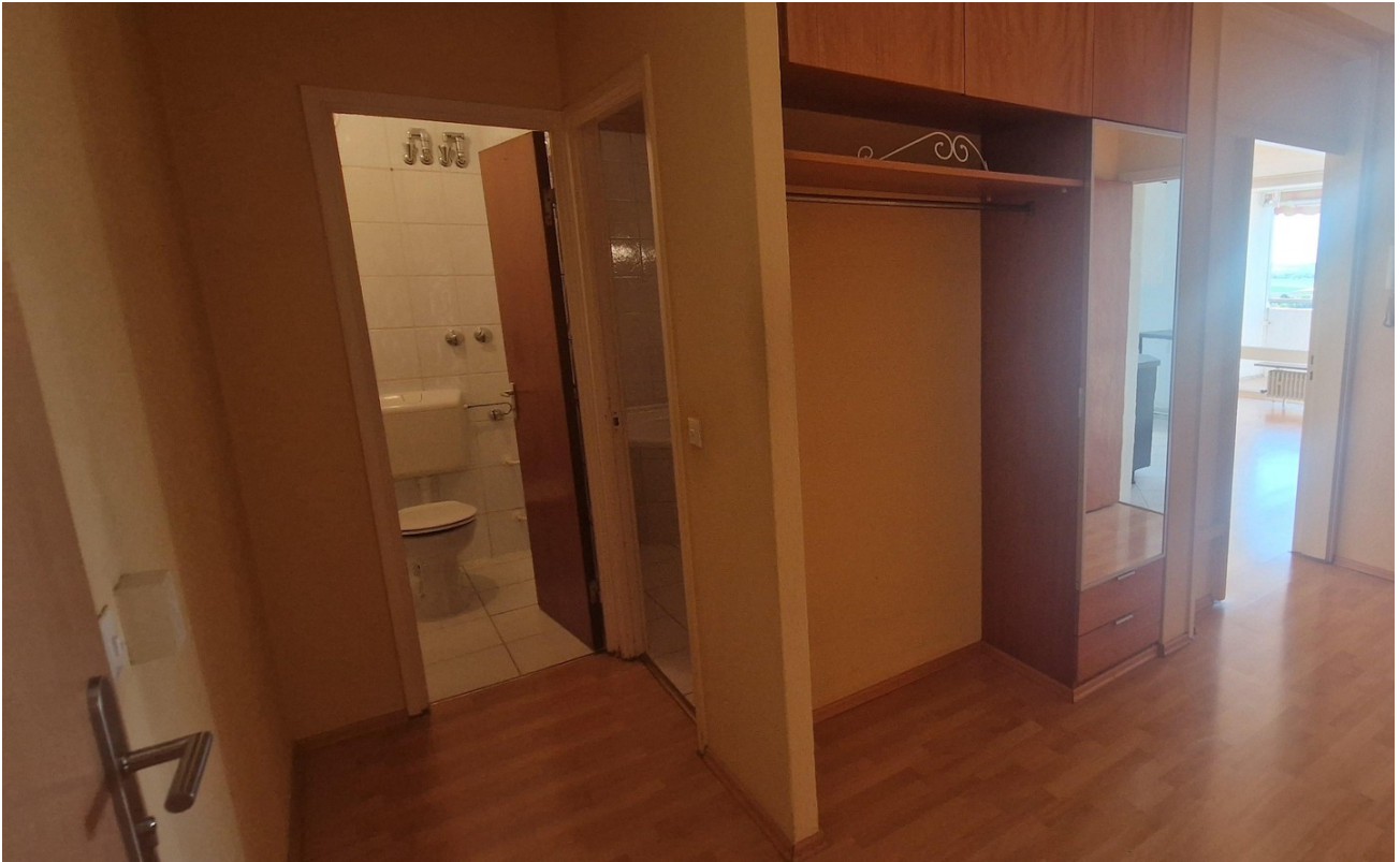
Garderobe / Eingang