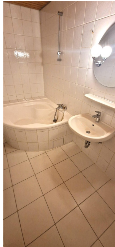
Bad mit Eckwanne