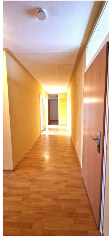
Flur zu Schlafräumen