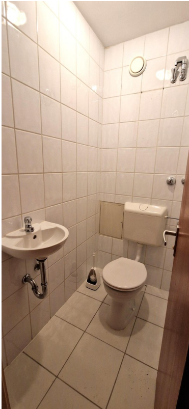
WC mit Waschbecken