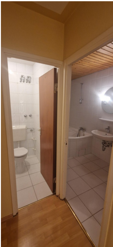
WC / Bad