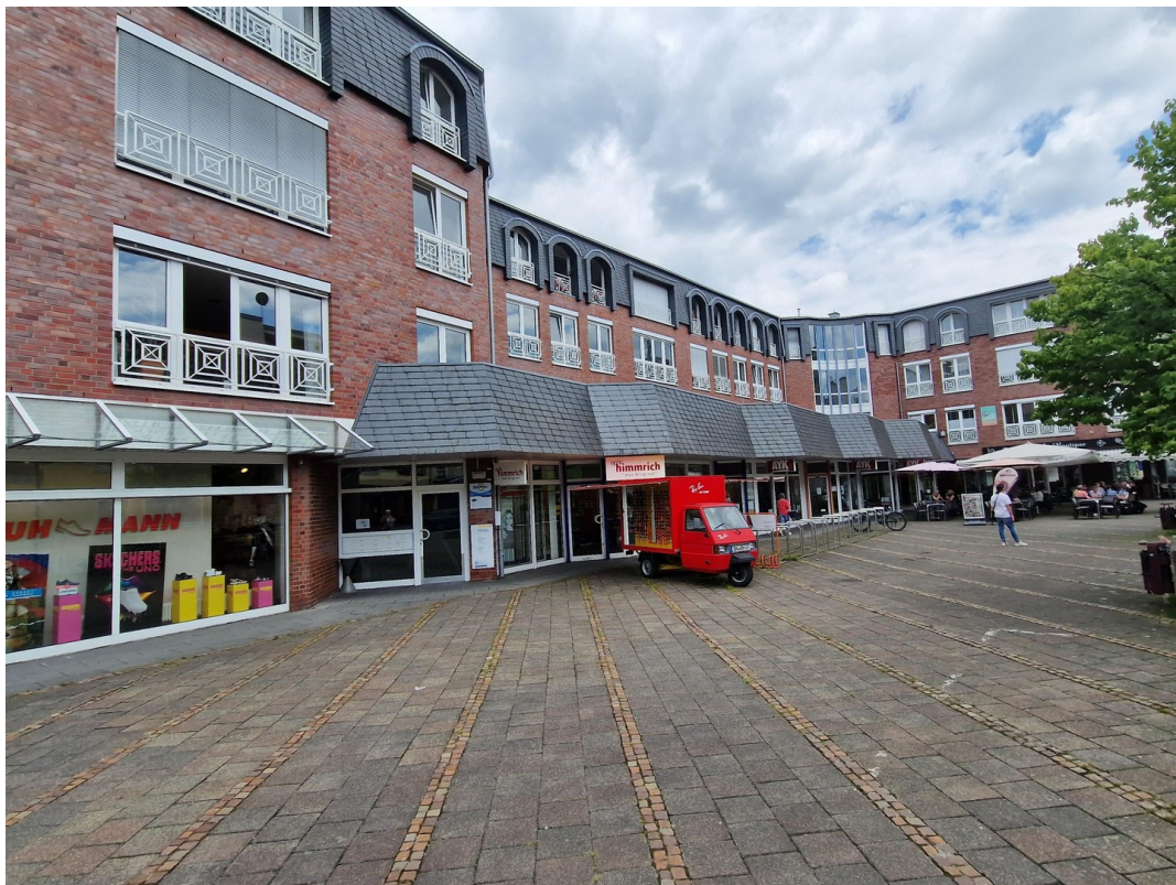
Ansicht mit Vorplatz