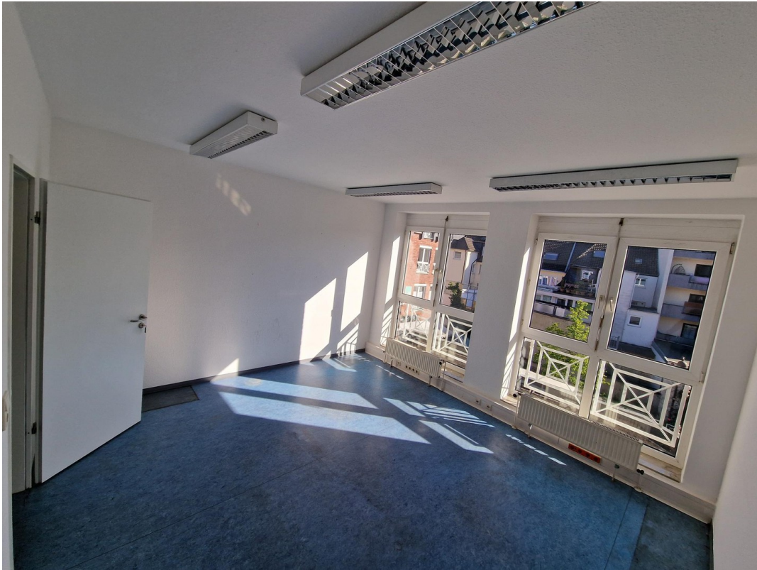
Büro / Praxisraum