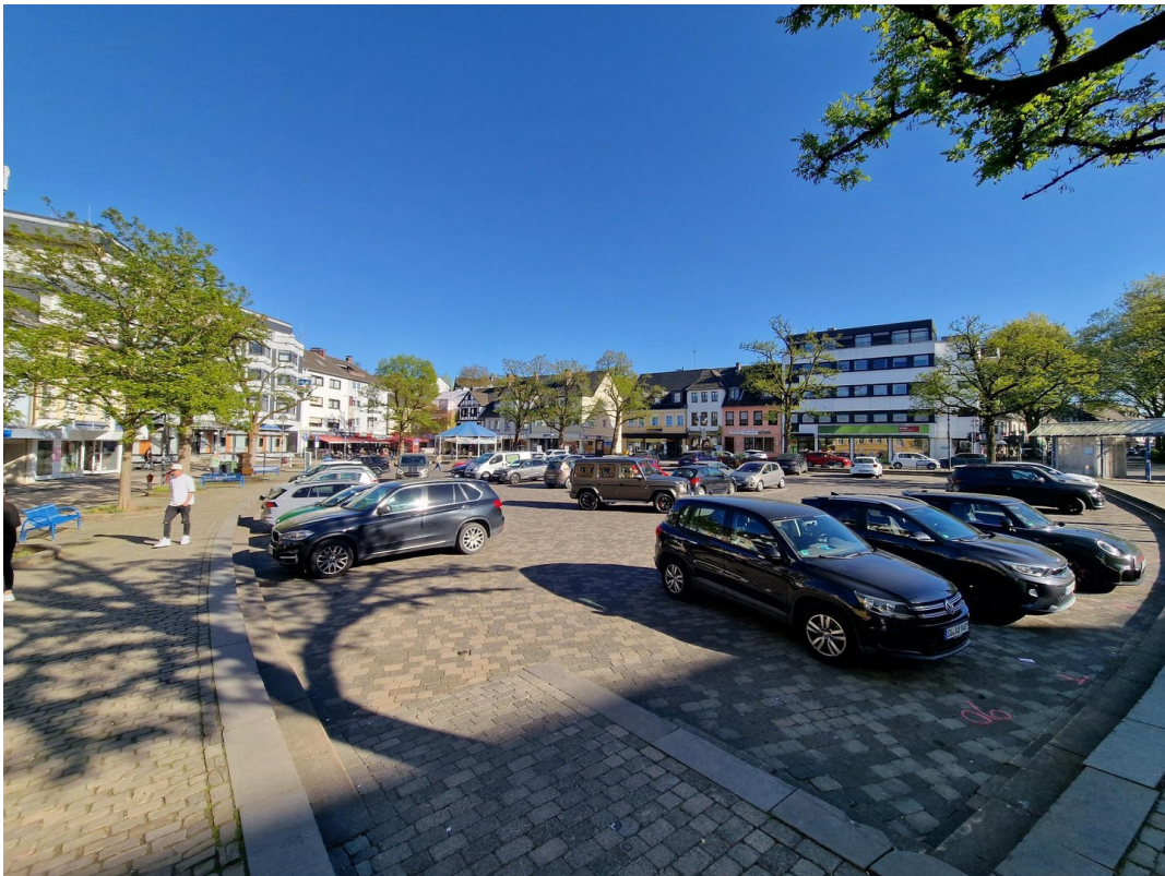
Parkplätze auf dem Markt