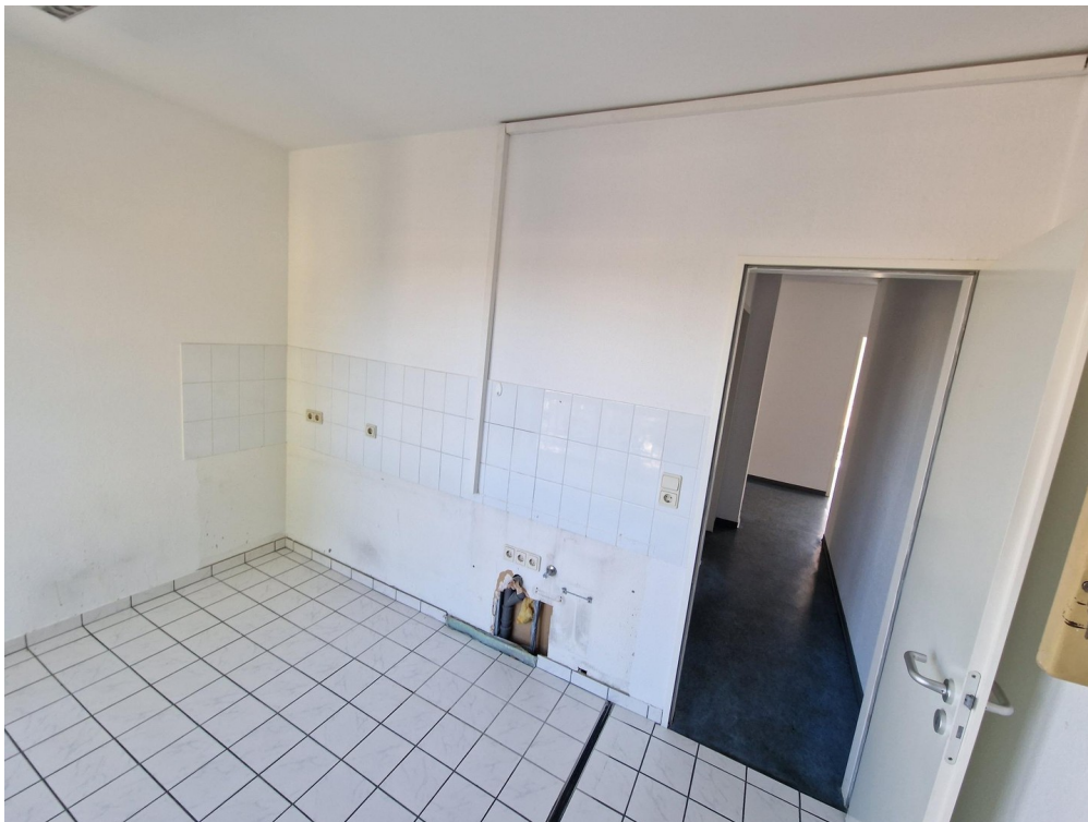
Küche / Teeküche