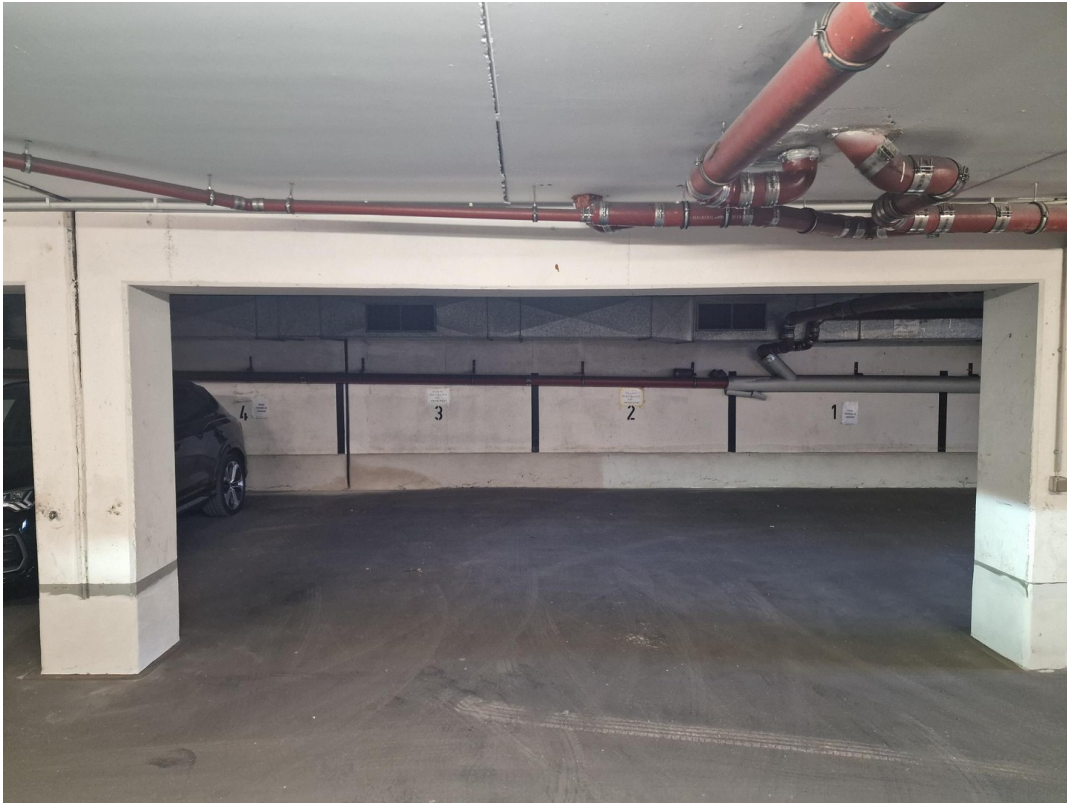
2 Stück Tiefgaragenstellplätze