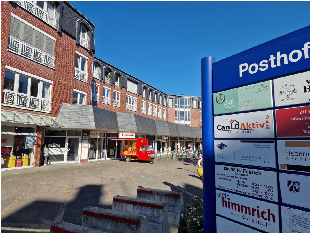
Ansicht von der Straße