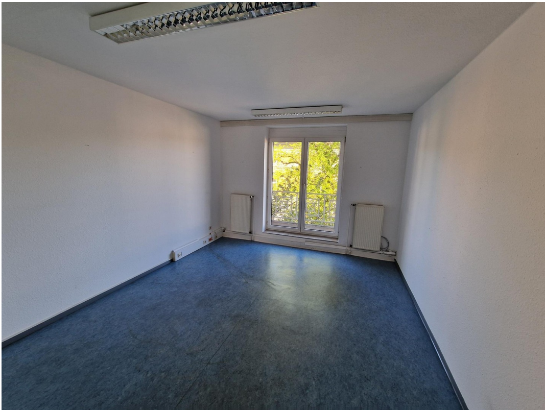
Büro / Praxisraum