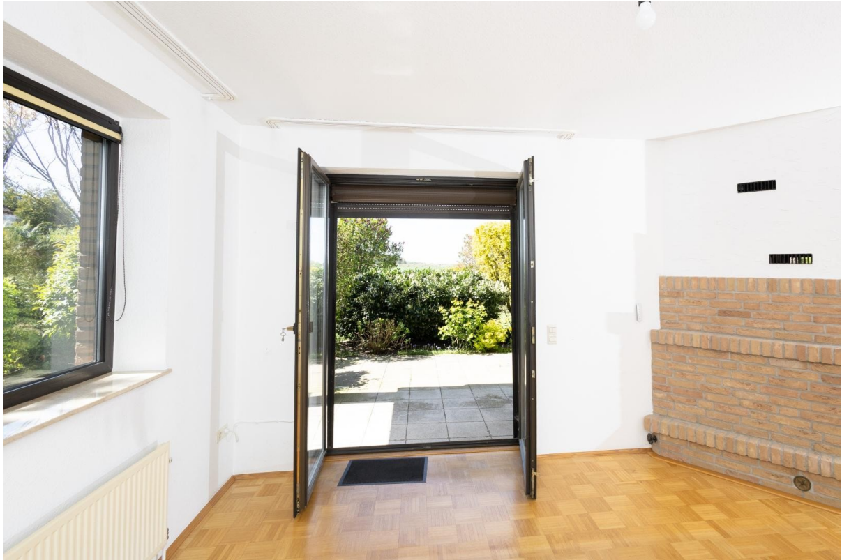
Zugang Terrasse (EG)