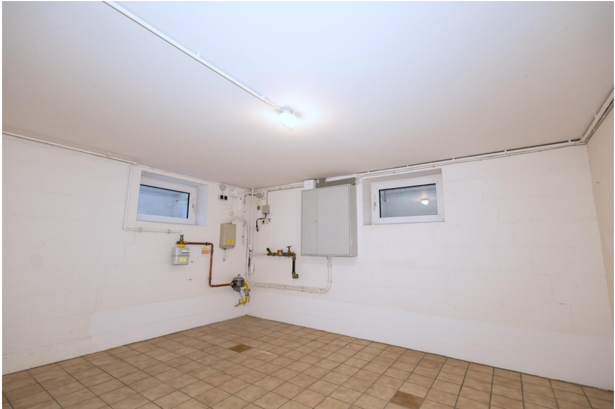
Kellerraum mit Hausanschlüssen