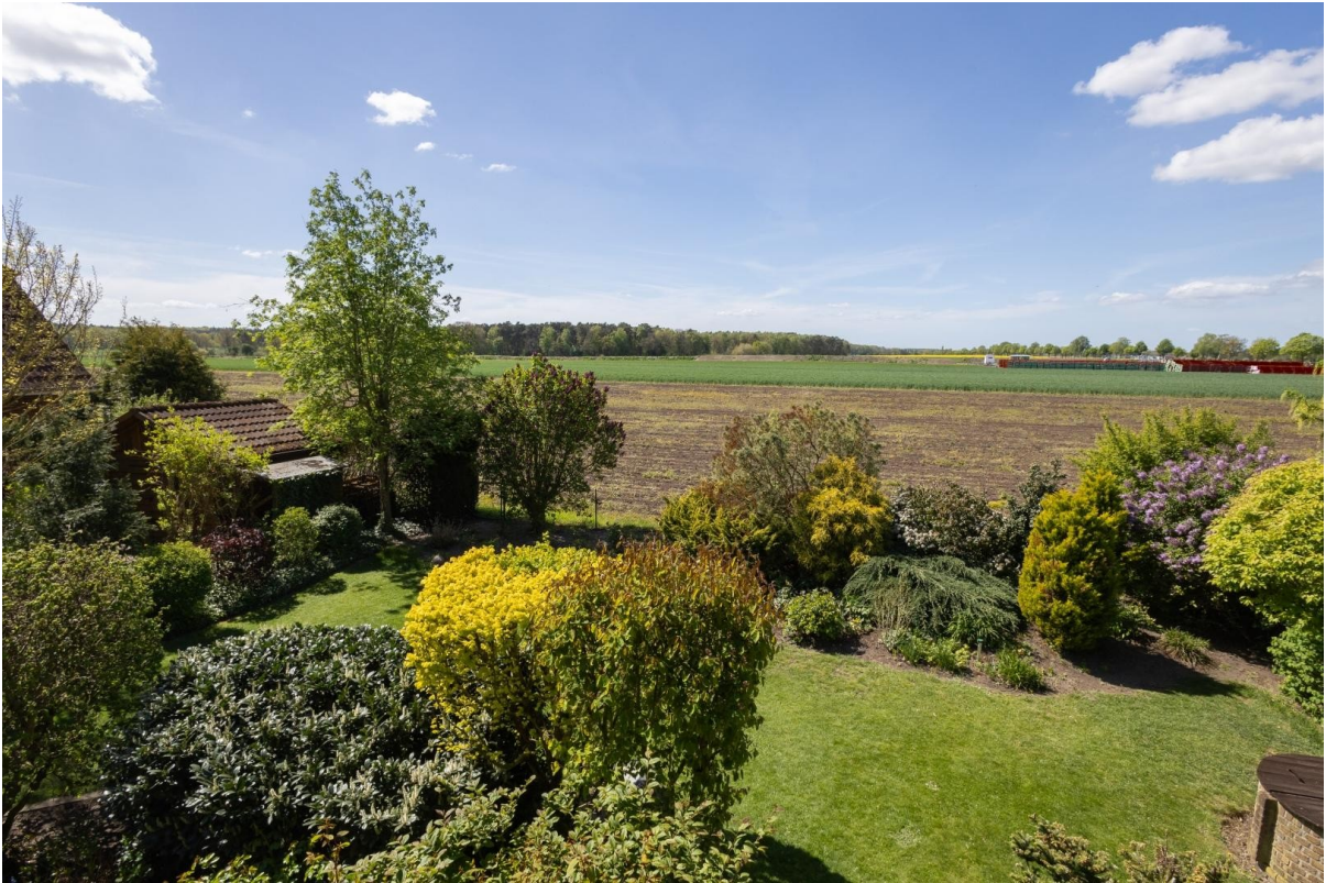
Blick aus dem Obergeschoss