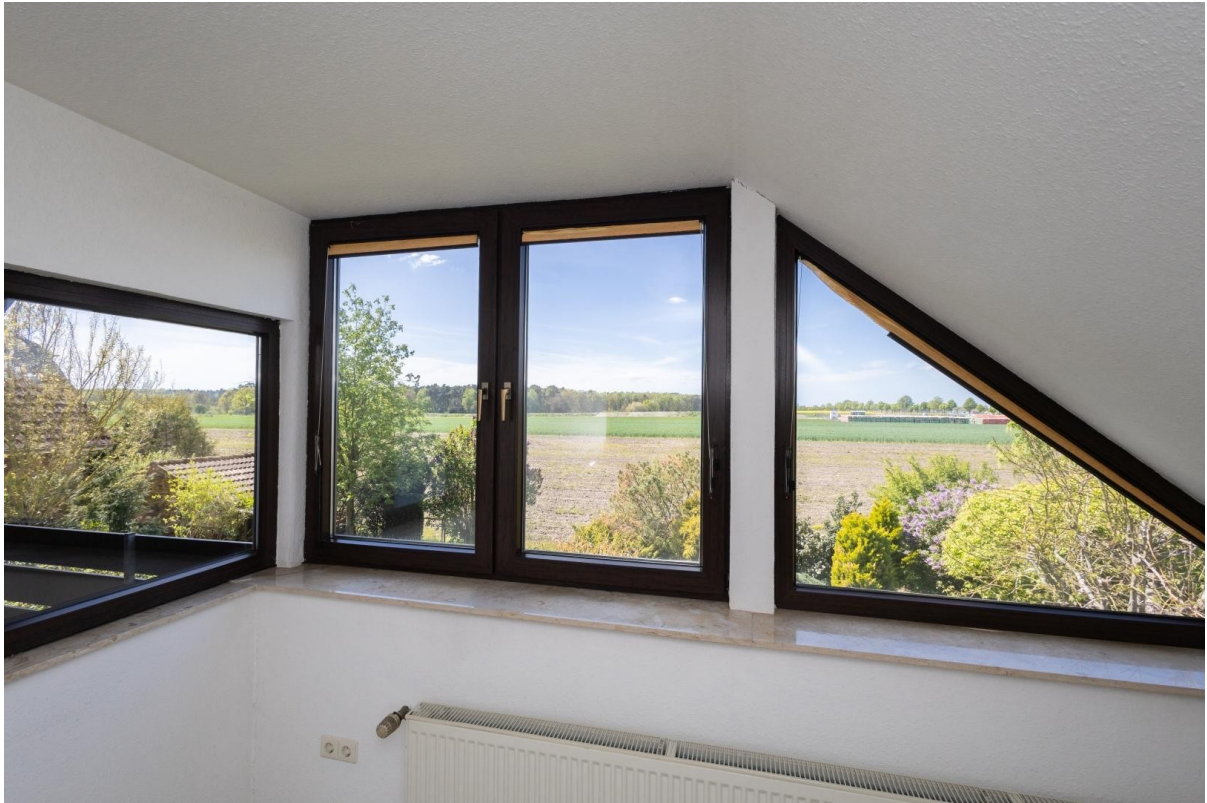
Blick über Felder (OG)