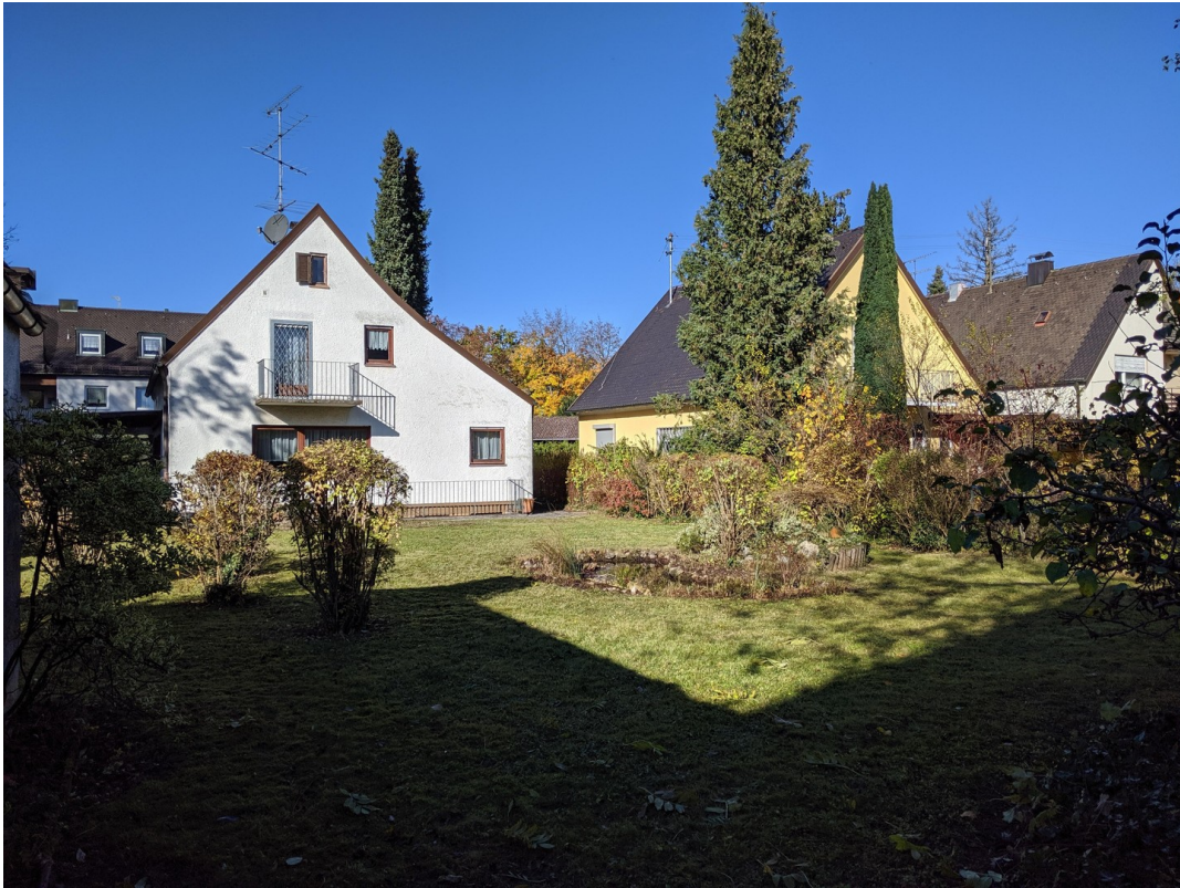
Garten / Rückansicht Altbest.