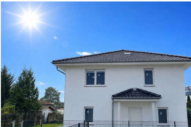
Einfamilienhaus zu vermieten

☆☆ Modernes Neubau-Einfamilienhaus 3 Schlafzimmer Garten Fussbodenheizung Erstbezug ☆☆☆