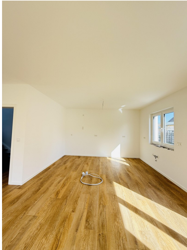
Küche (EBK optional)