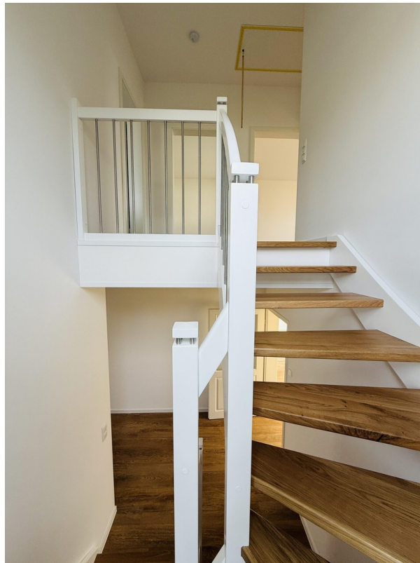
Treppe nach oben