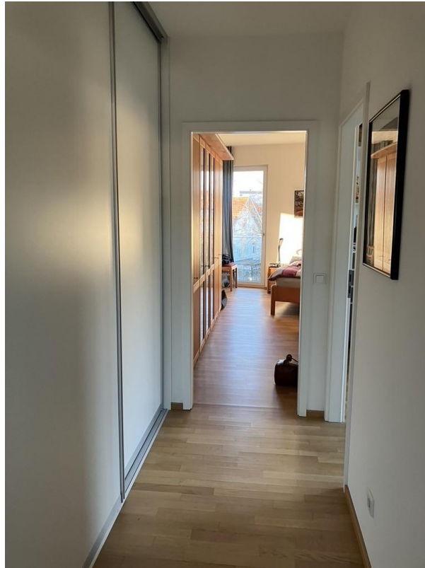
Flur zu den Zimmern