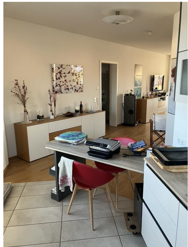
Küche in Richtung Wohnzimmer