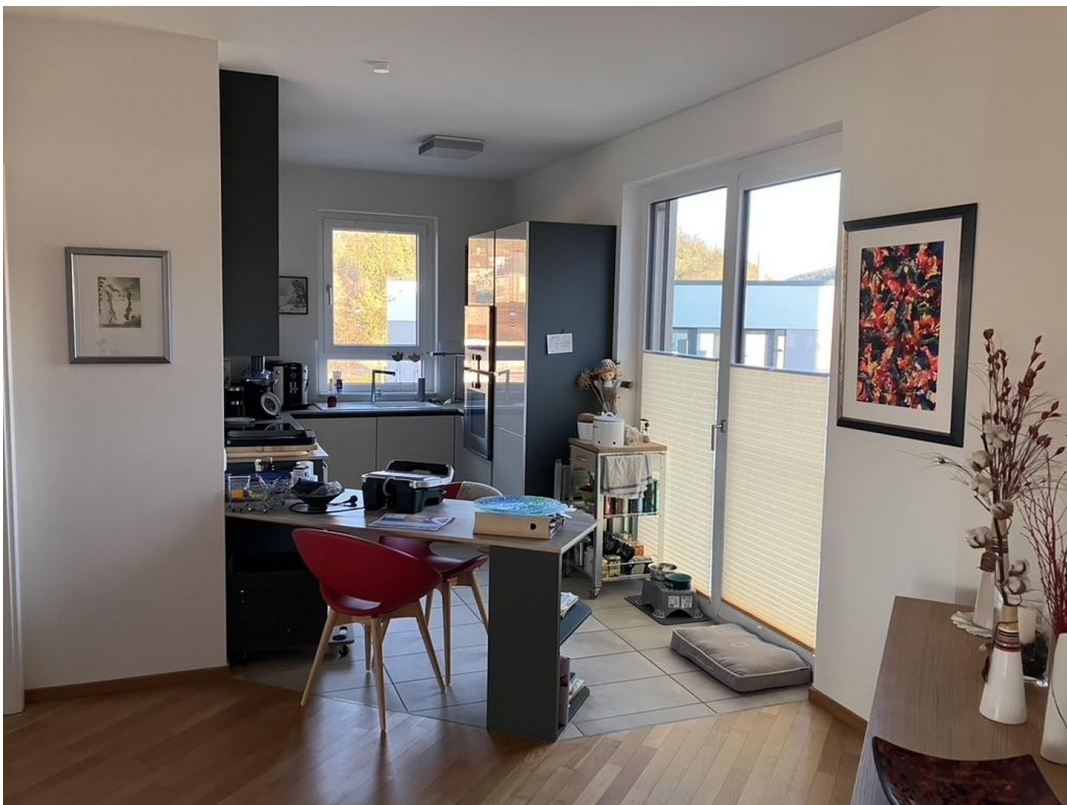
Übergang zur offenen Küche