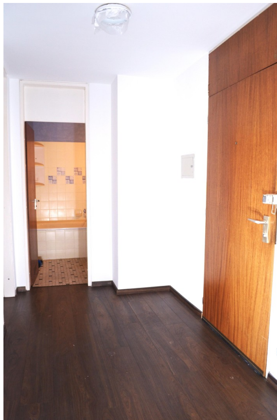
Flur und Wohnungstüre