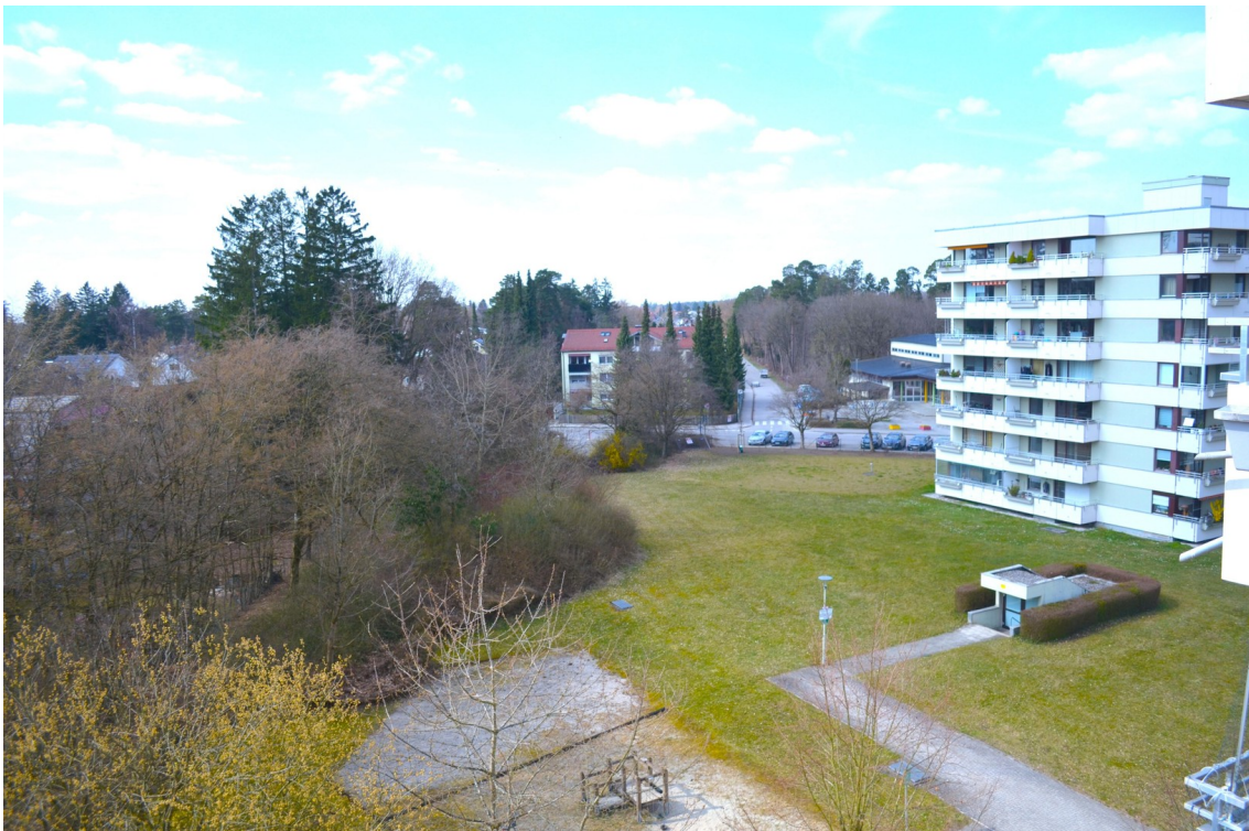
Blick vom Balkon nach Westen