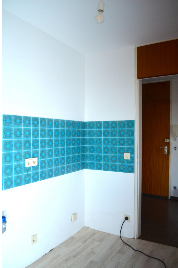
Fliesenspiegel der Küche, Tür