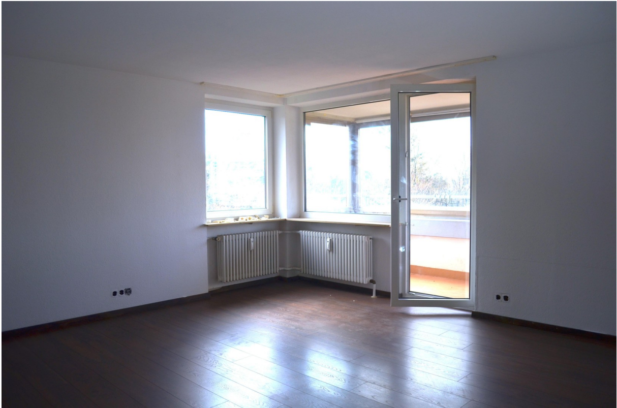
Blick nach Süden und Westen