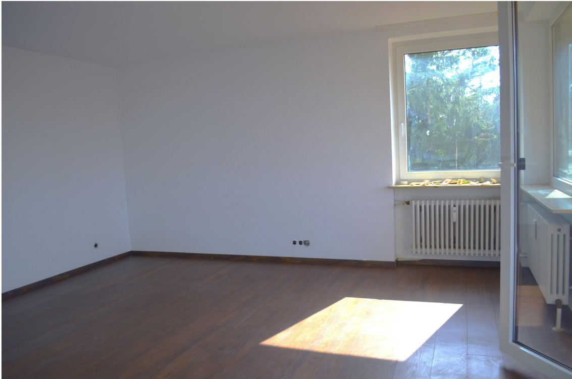
Südfenster im Wohnzimmer