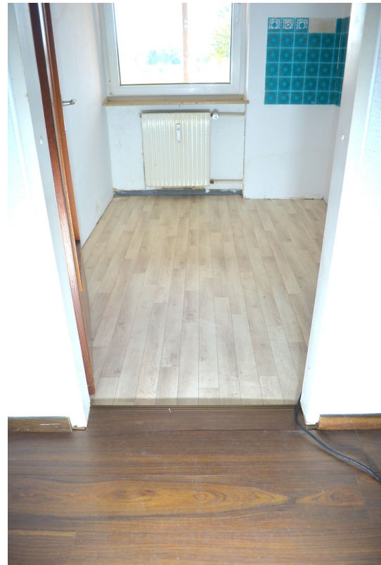
Küche ohne Einbauküche