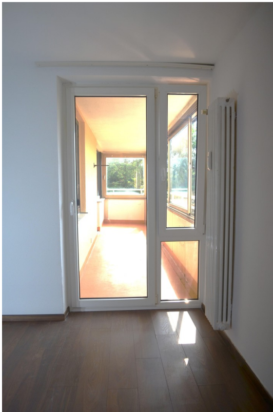
zweiter Zugang zum Balkon