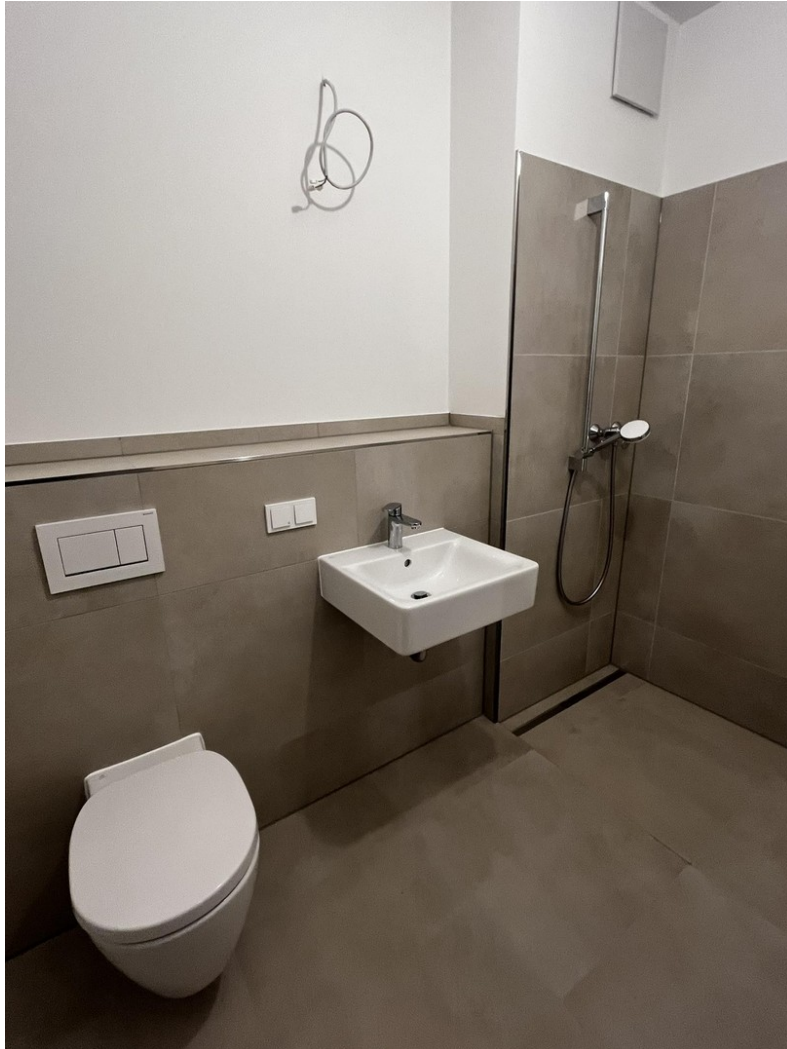
Gäste - WC