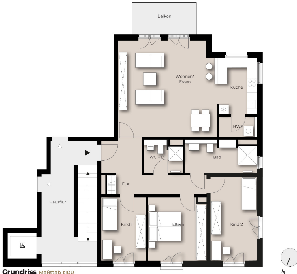
Grundriss Maßstab 1:100