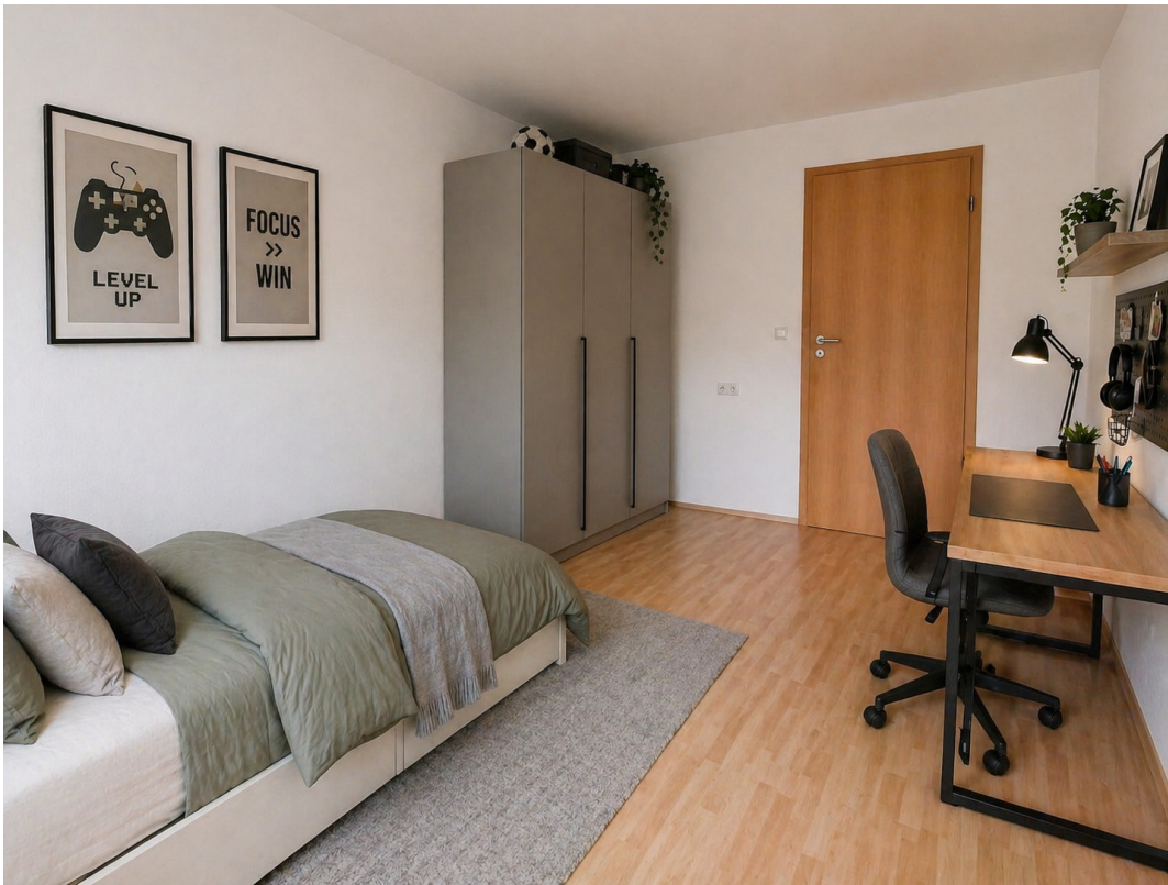
Kinderzimmer 1 Staging