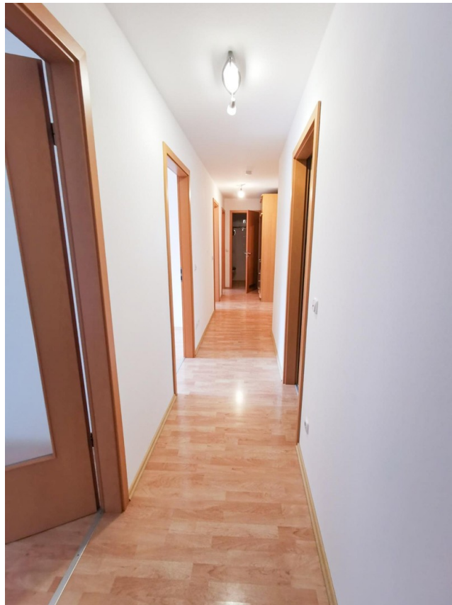
Flur Blick Richtung Duschbad