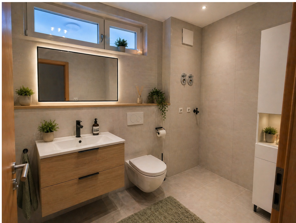
Bad mit Badewanne Staging