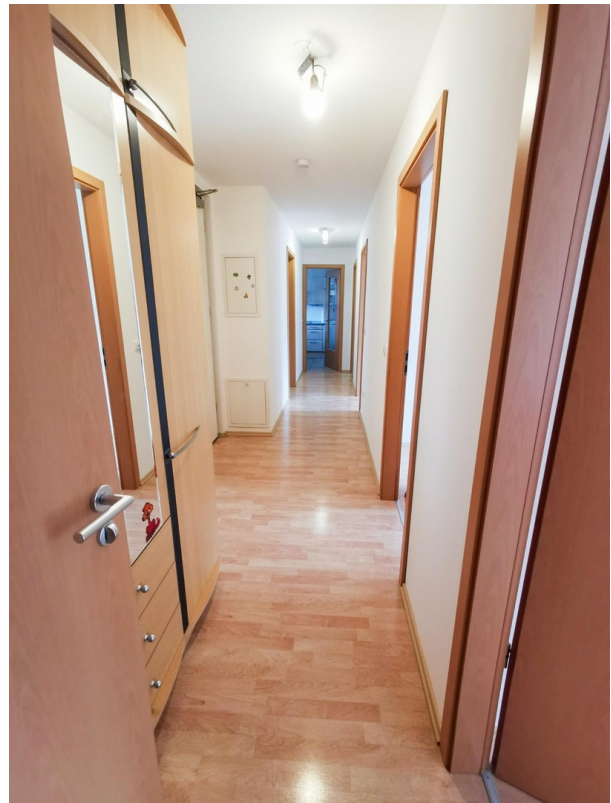
Flur Blick Richtung Küche