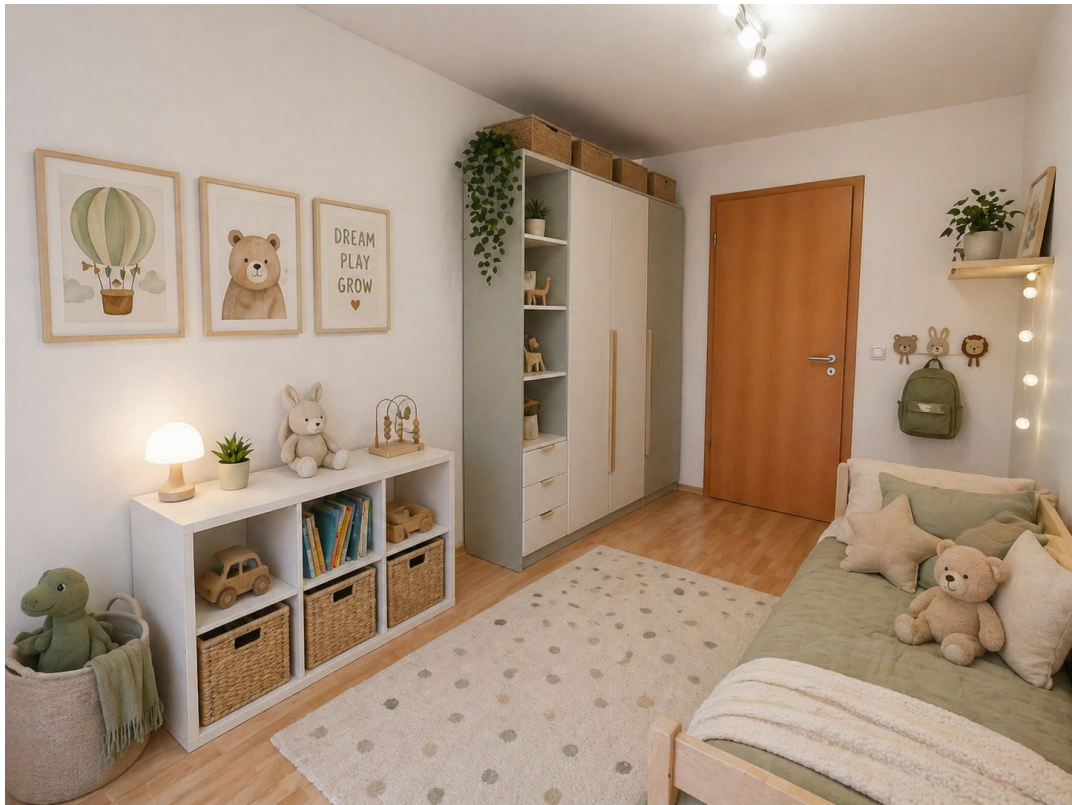
Kinderzimmer 2 Staging