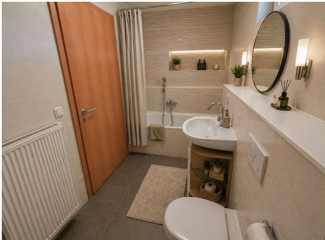
Bad mit Badewanne Staging