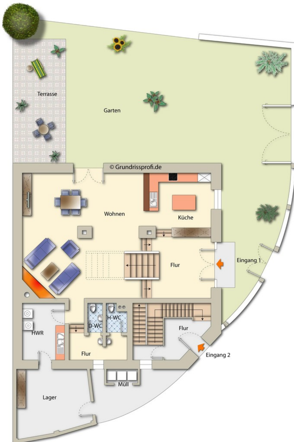
Grundriss EG mit Garten