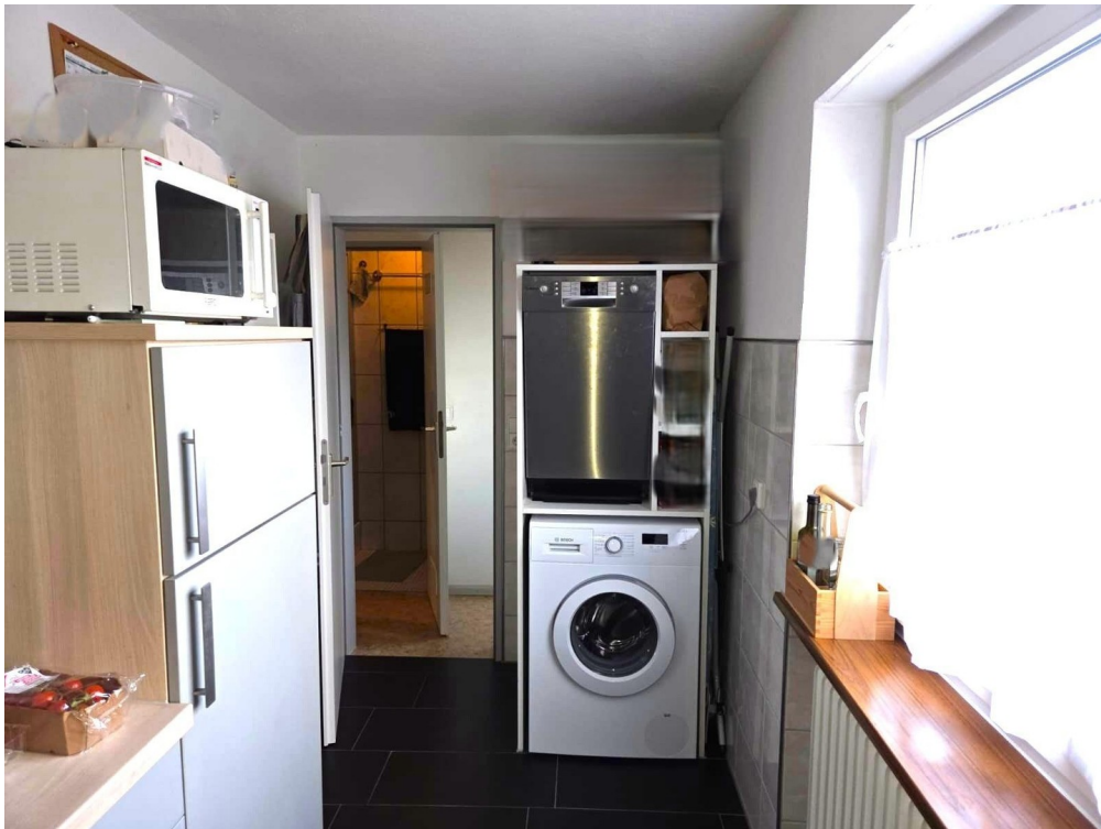
Platz für Wasch-Trockenturm