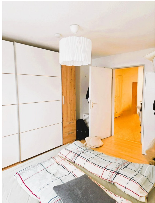
Schlafzimmer Blick zum Flur