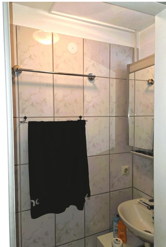
Bad mit Dusche und Waschbecken