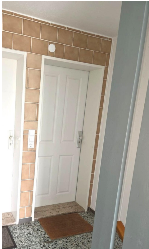
Wohnungseingang EG rechts