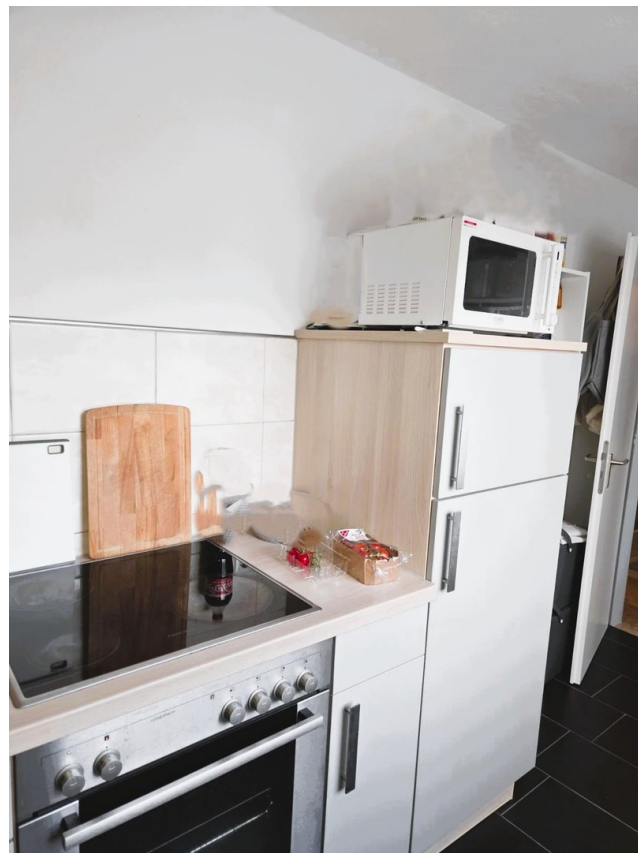
Küche Herd, Ceranfeld, Kühlschrank