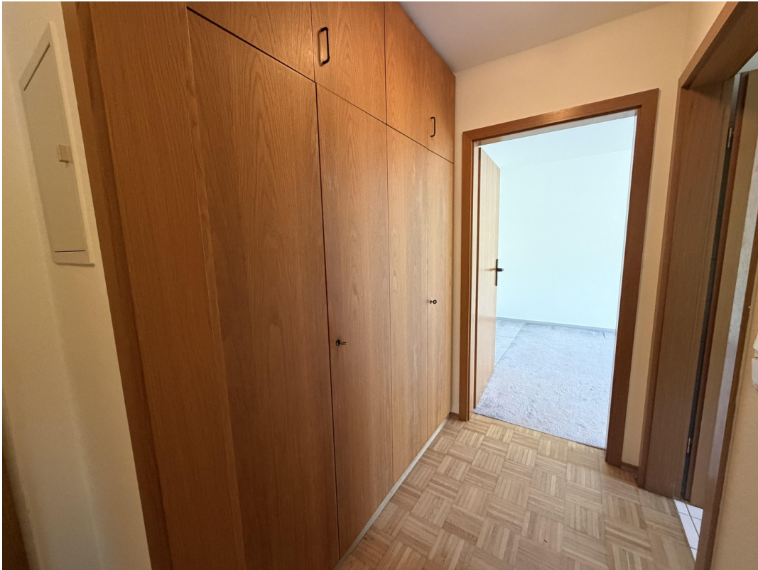
Flur mit Einbauschränk