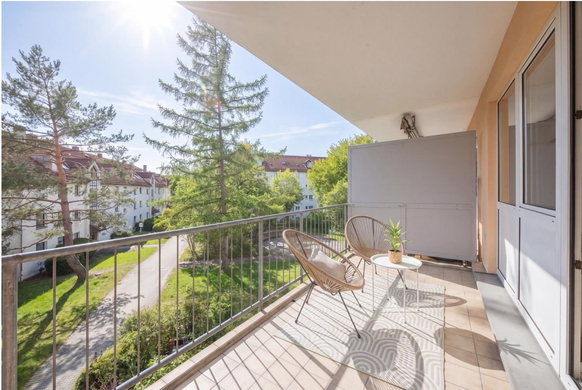
Balkon zum Entspannen