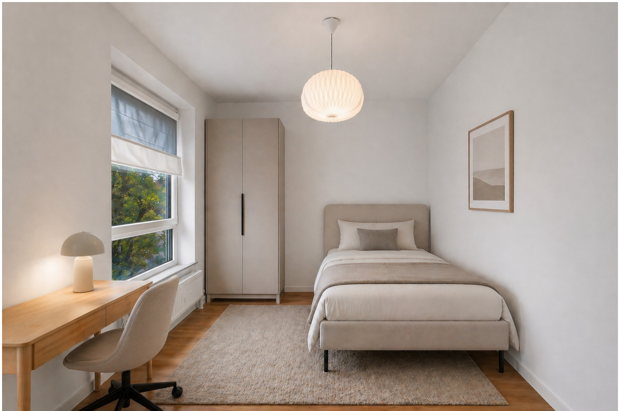
Schlafen 2 (Rendering)