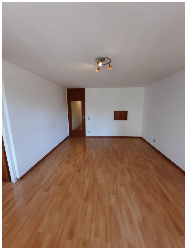
Wohnzimmer mit Durchreiche