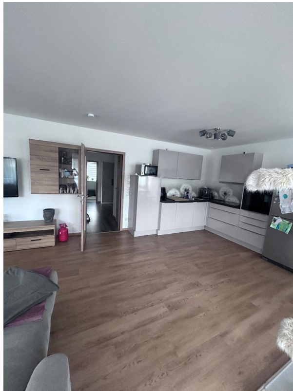
Wohn- Esszimmer ( Küche)