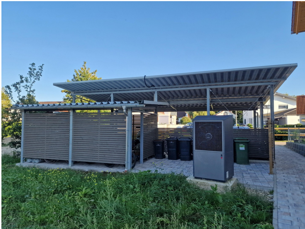
Carport und Fahrradraum