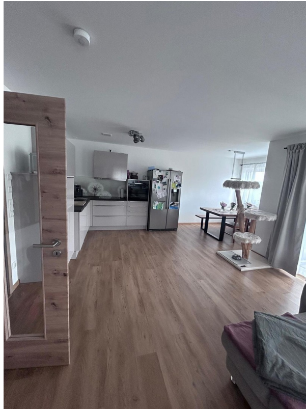
Wohn- Esszimmer (Essbereich)