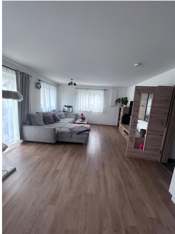
Wohn- Esszimmer (Wohnbereich)