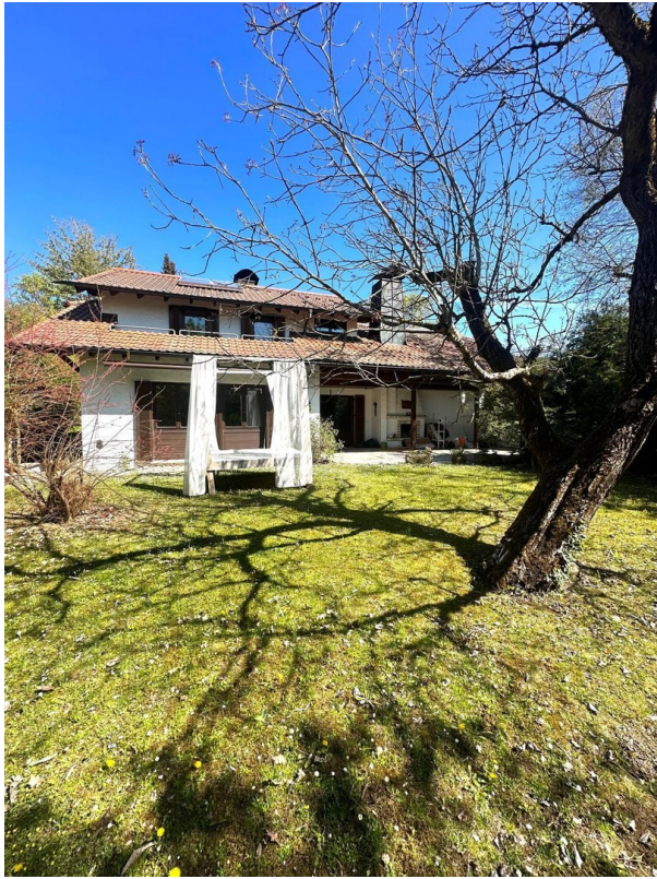
Hausansicht Garten 2