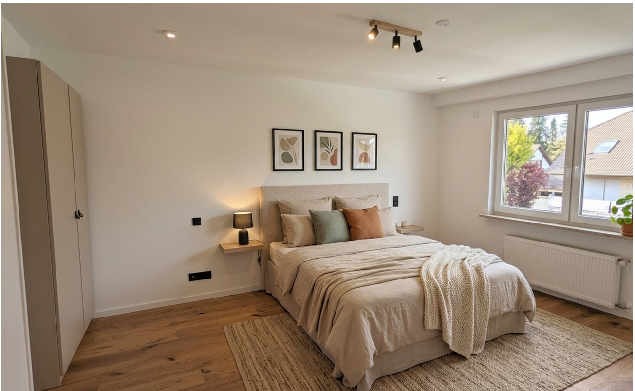
Wohnraum 2 (KI)