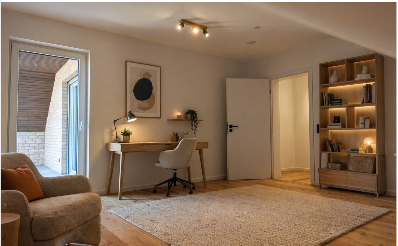
Wohnraum 1 (KI)