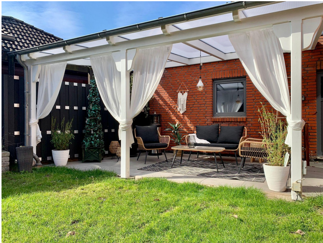
Hintere Terrasse - überdacht