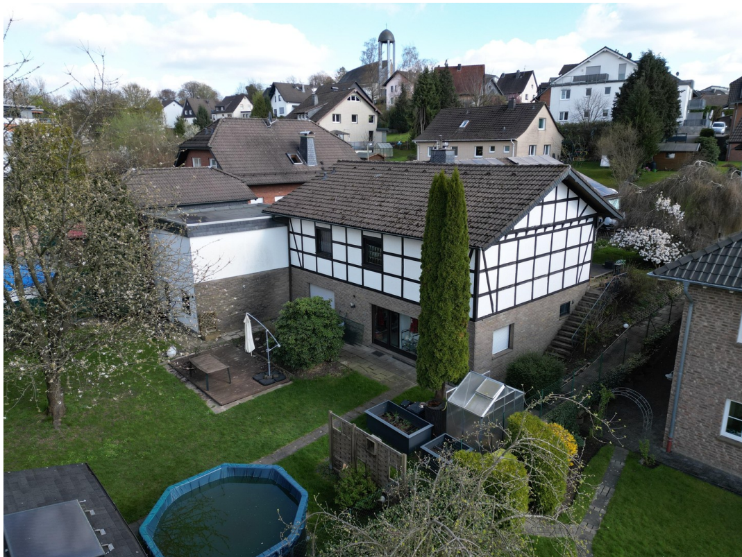
Von oben (1)