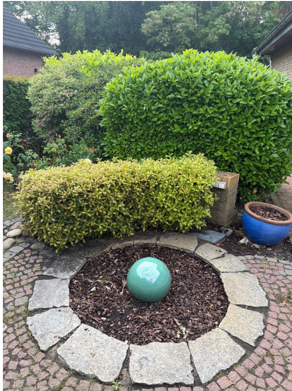
Teich (wieder aktivierbar)