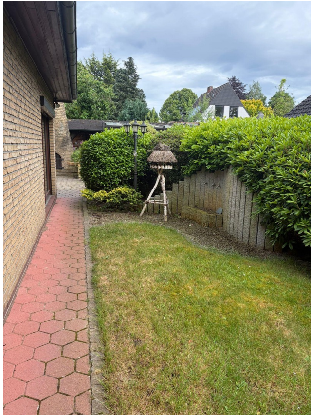
Garten rechts vom Haus