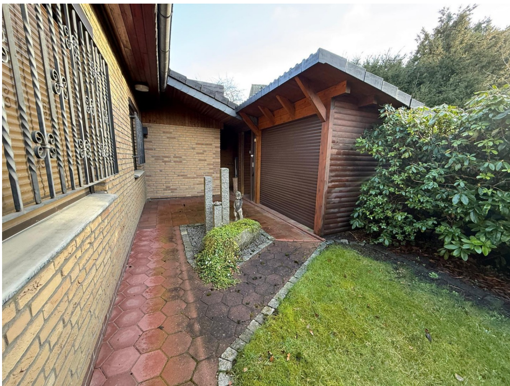
Fahrradschuppen + el. Rolltor