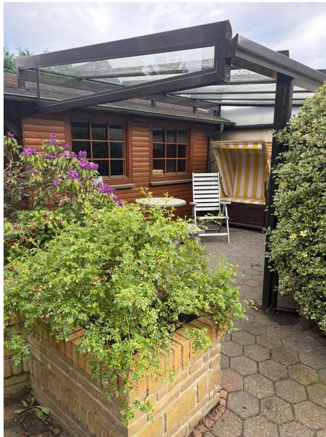
Zweite überdachte Terrasse