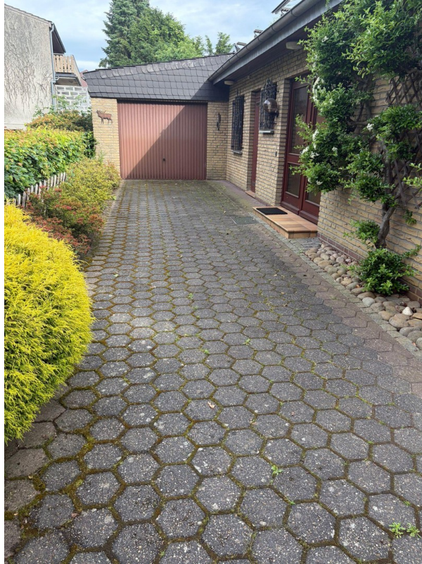
Einfahrt und Hauseingang