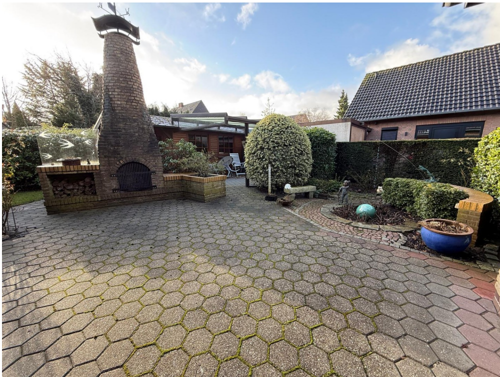
Terrasse / Kamin/ Sommergarten