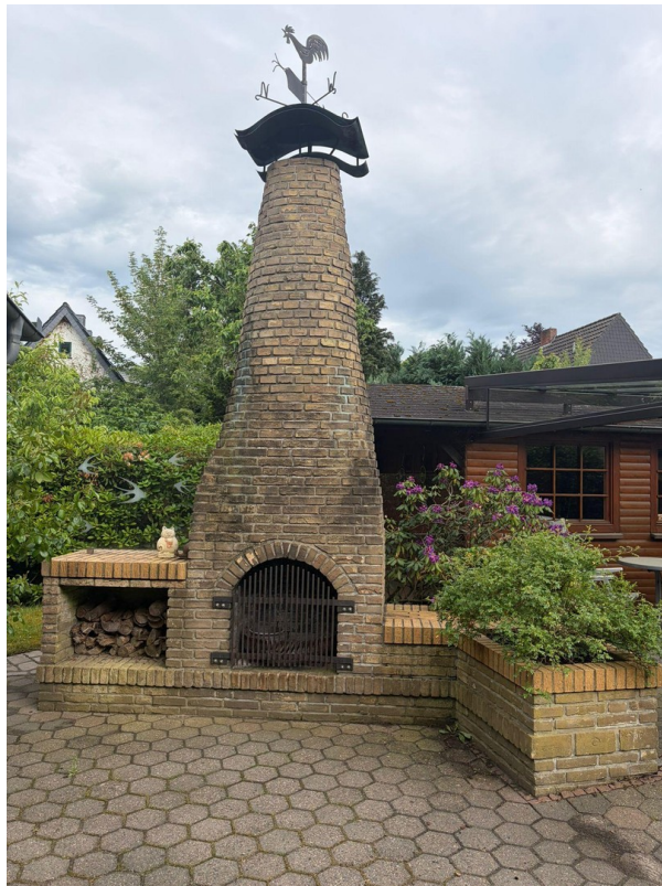
Schöner Kamin für Sommerabende