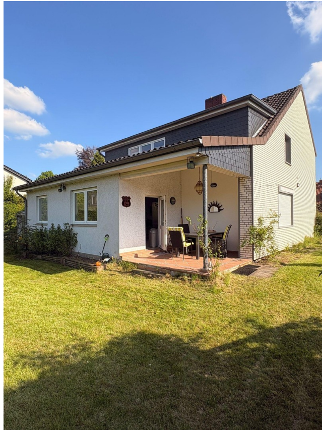
Rückansicht des Hauses