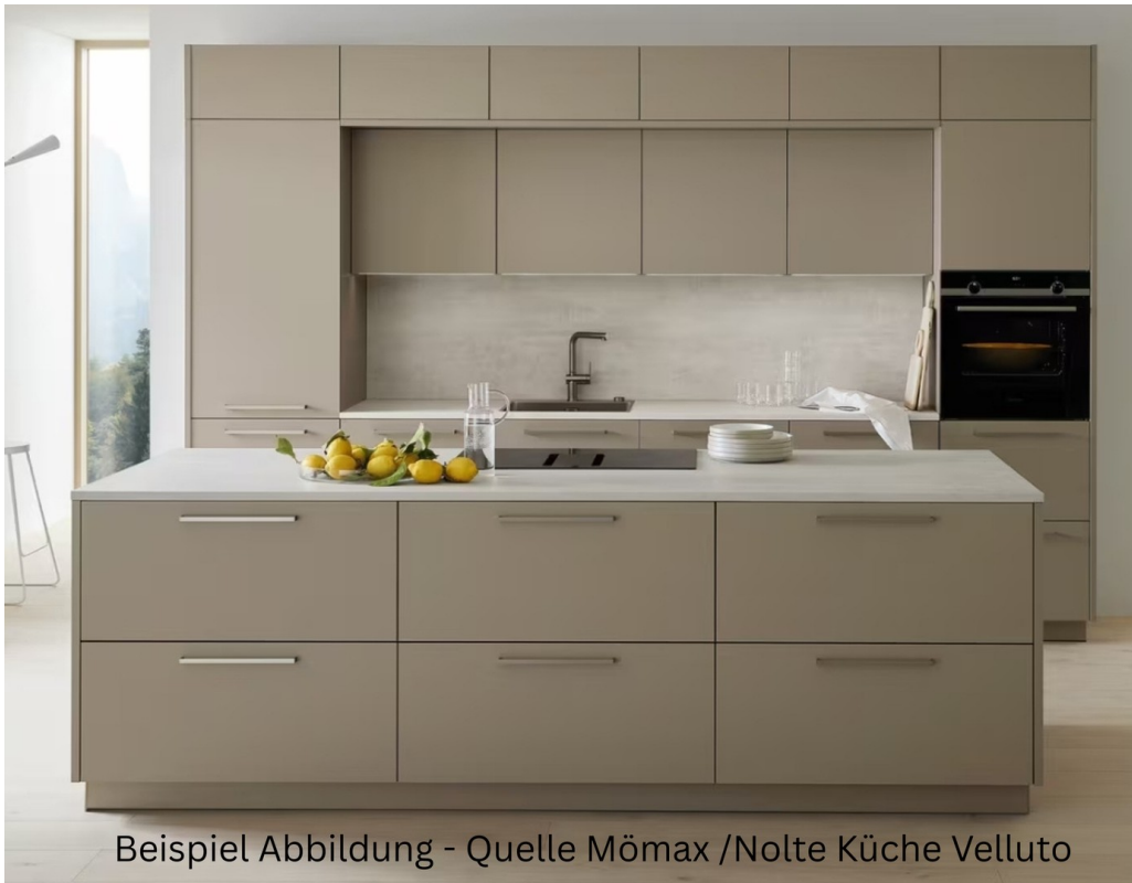
Beispiel Abbildung