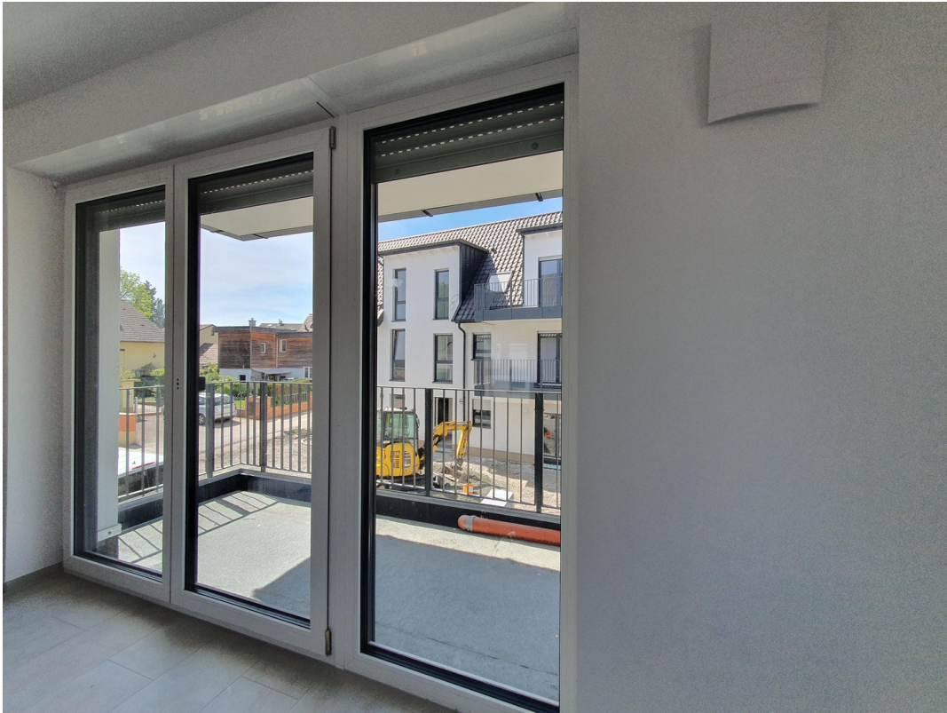
Blick zum Balkon - Süd - Hof