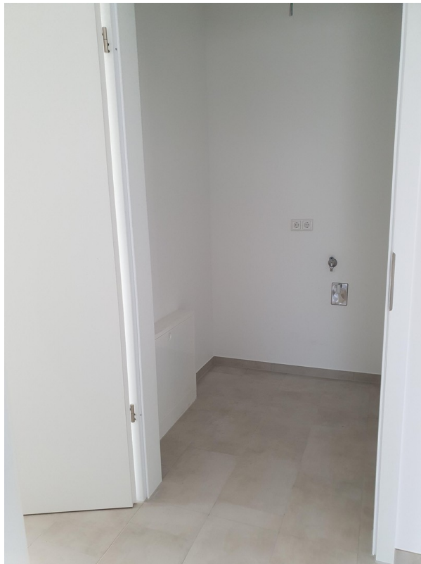
Abstellraum mit Anschluss