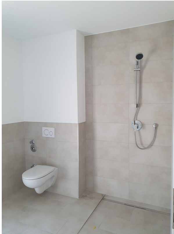
Duschbereich - Toilette