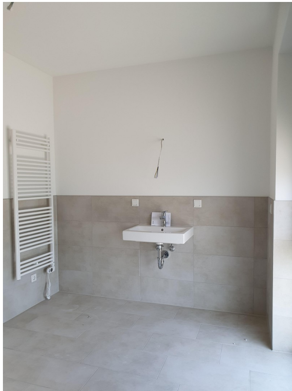
Duschraum mit Tageslicht