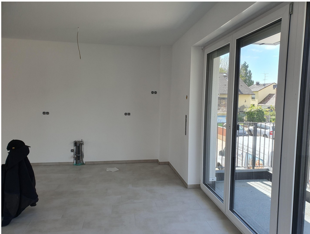
Blick zur Küche - Süd