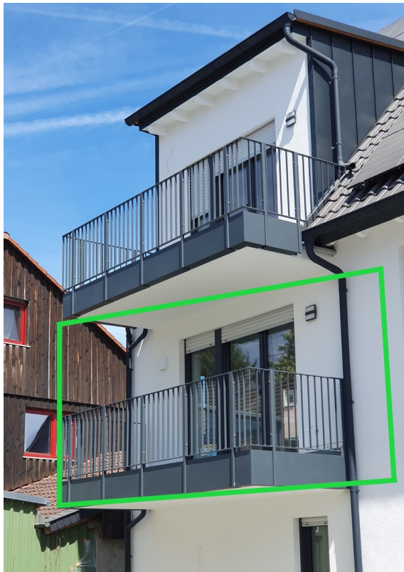
Hausansicht Süd - Hofseite