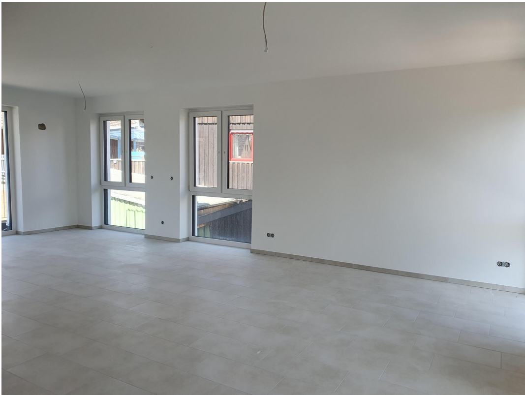
Essbereich Richtung Süd West