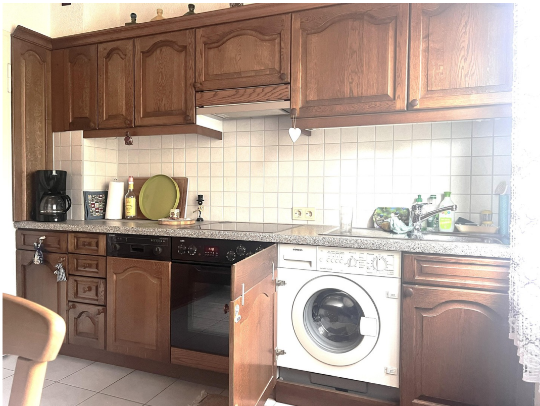
Küche mit Elektrogeräten