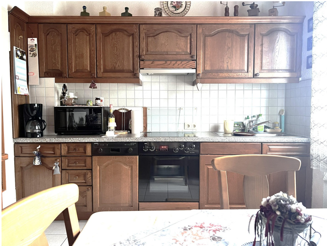
Küche mit Elektrogeräten