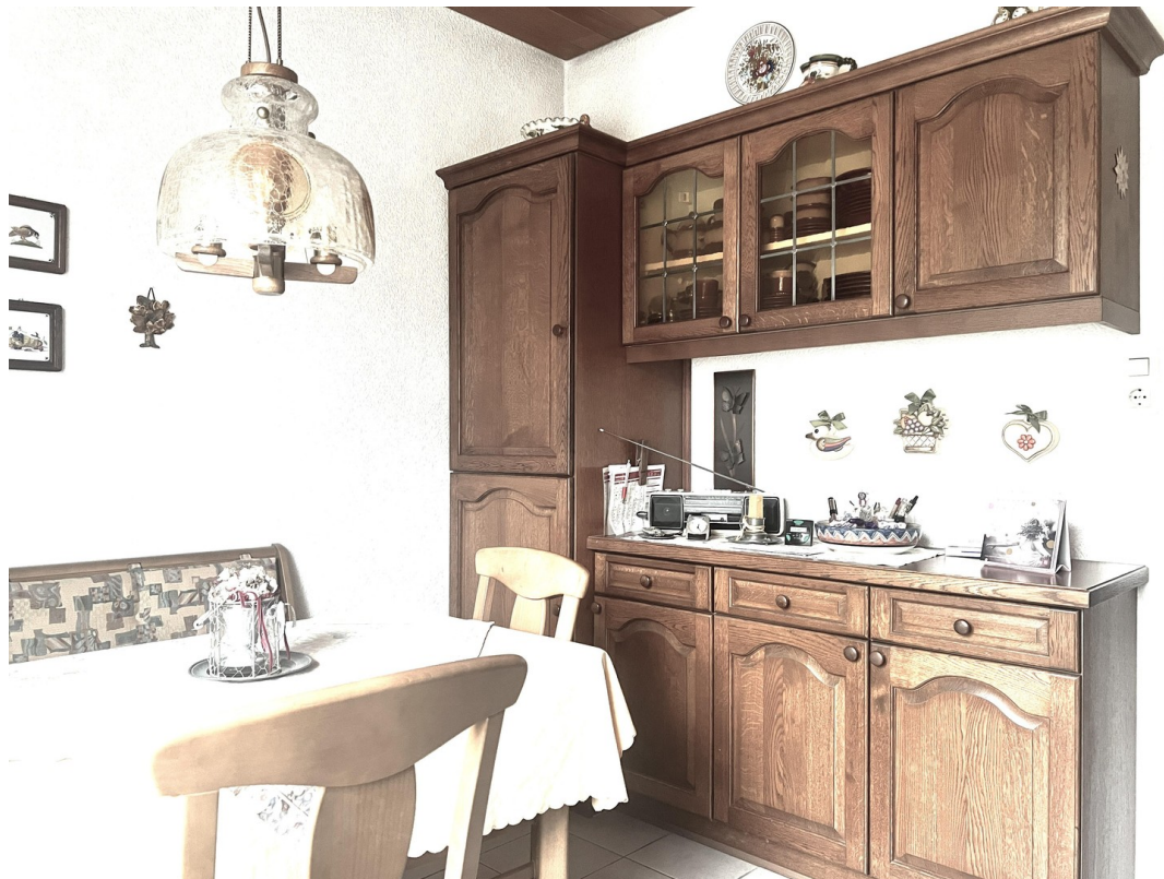
Küche mit Elektrogeräten