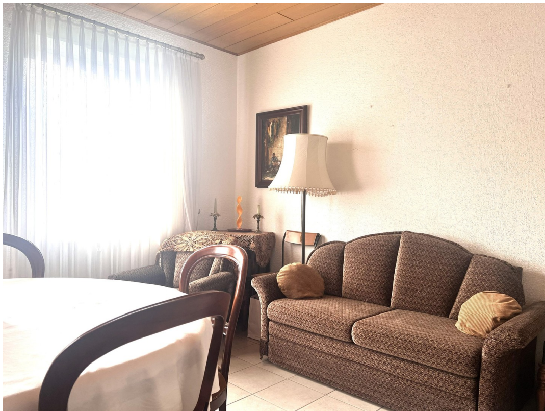
Schlafsofa in Zimmer 2