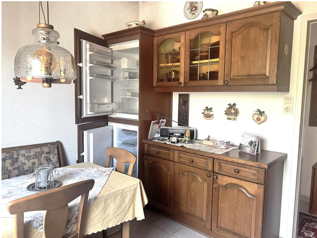
Küche mit Elektrogeräten