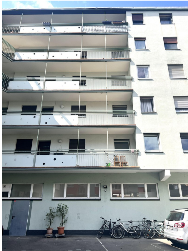
Haus von hinten