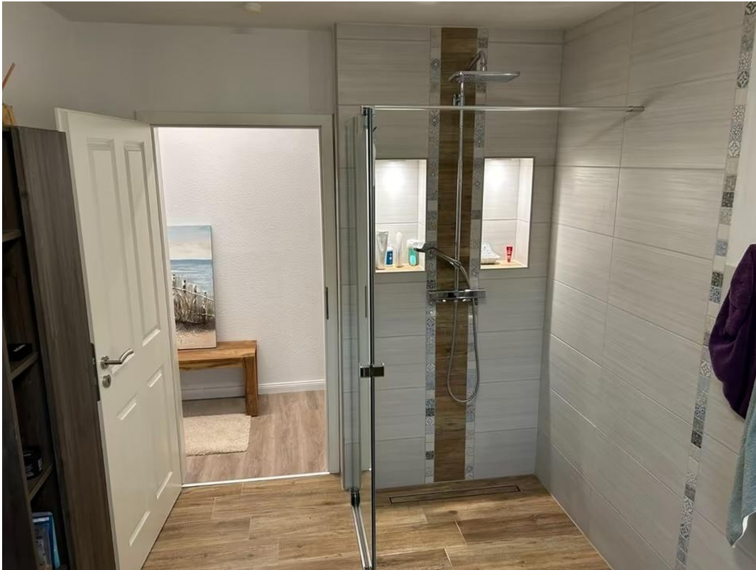
WalkIn Dusche bodengleich