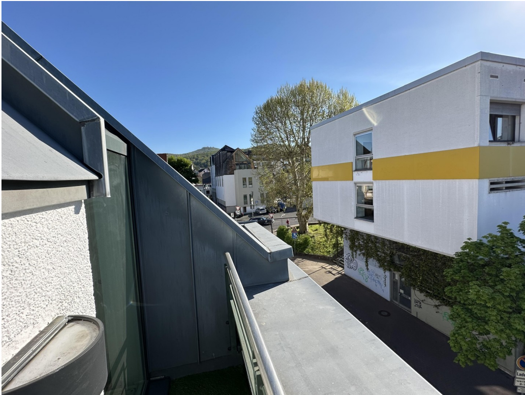
Blick vom Balkon 2