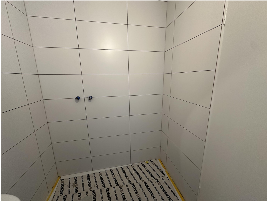
Neue Dusche vor Fertigstellung