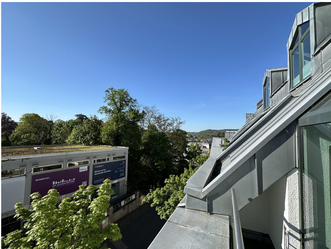
Blick vom Balkon 1