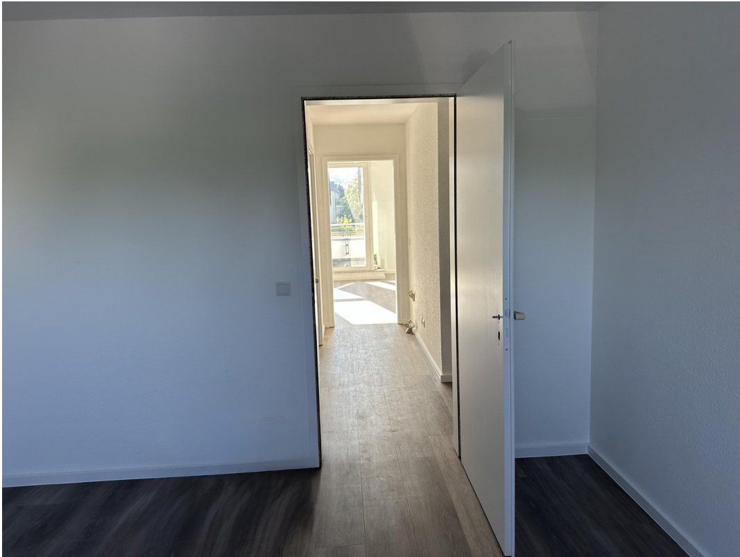
Schlafzimmer -> Wohnbereich