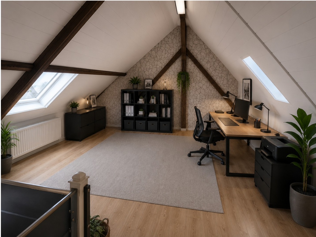
KI Vorschlag Dachboden