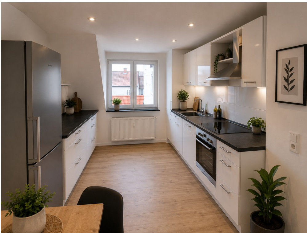
KI Vorschlag Küche