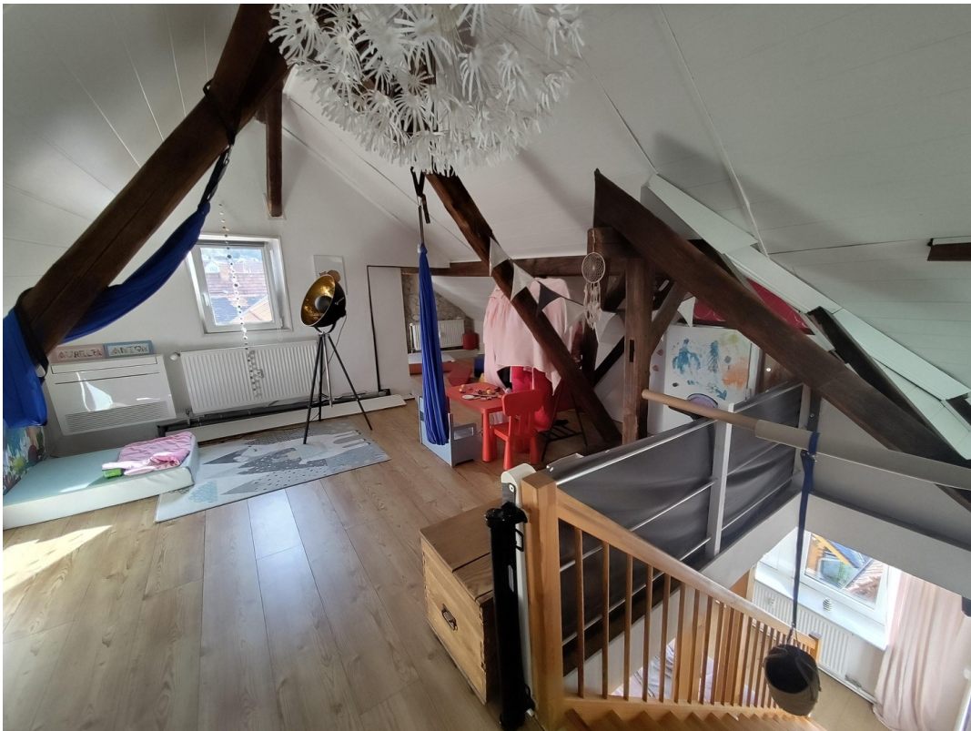
Dachboden zweite Hälfte