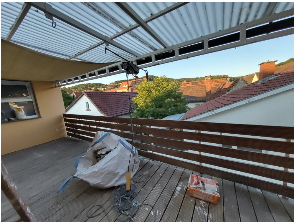
Terrasse mit Sondernutzung