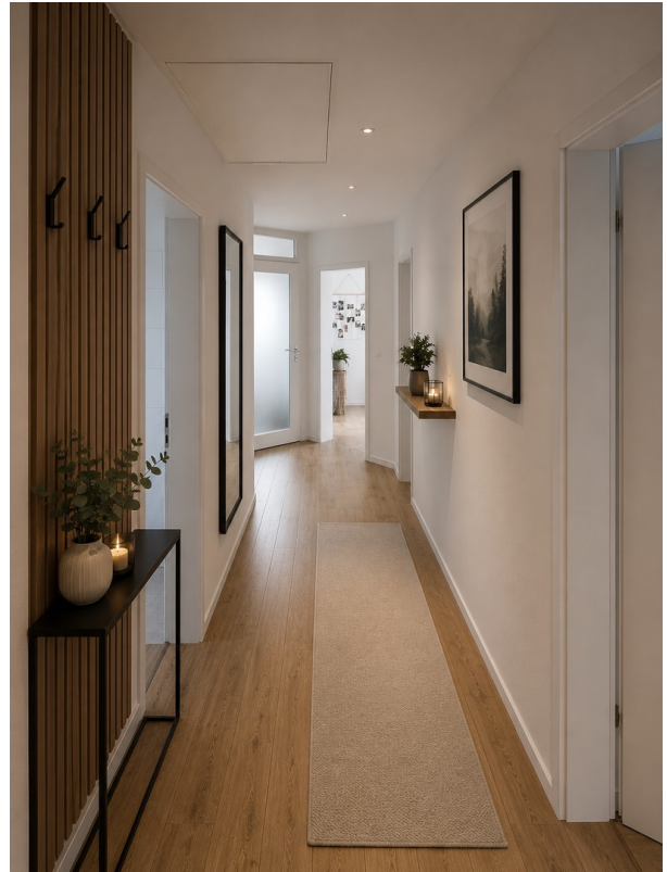
KI Vorschlag Flur