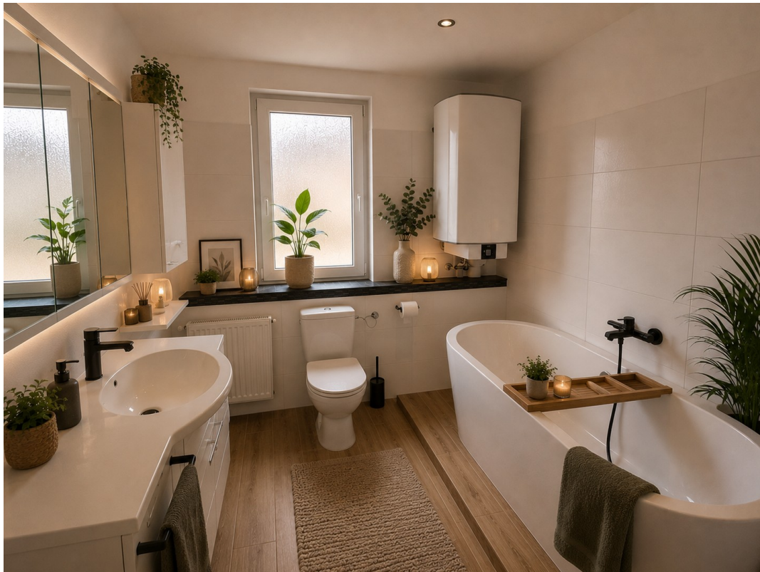
KI Vorschlag Bad