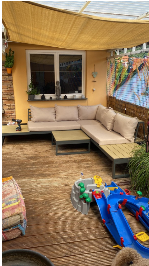
Terrasse mit Sondernutzung