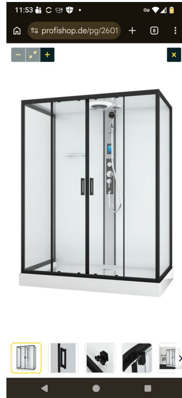
Dusche auf Wunsch einbaubar