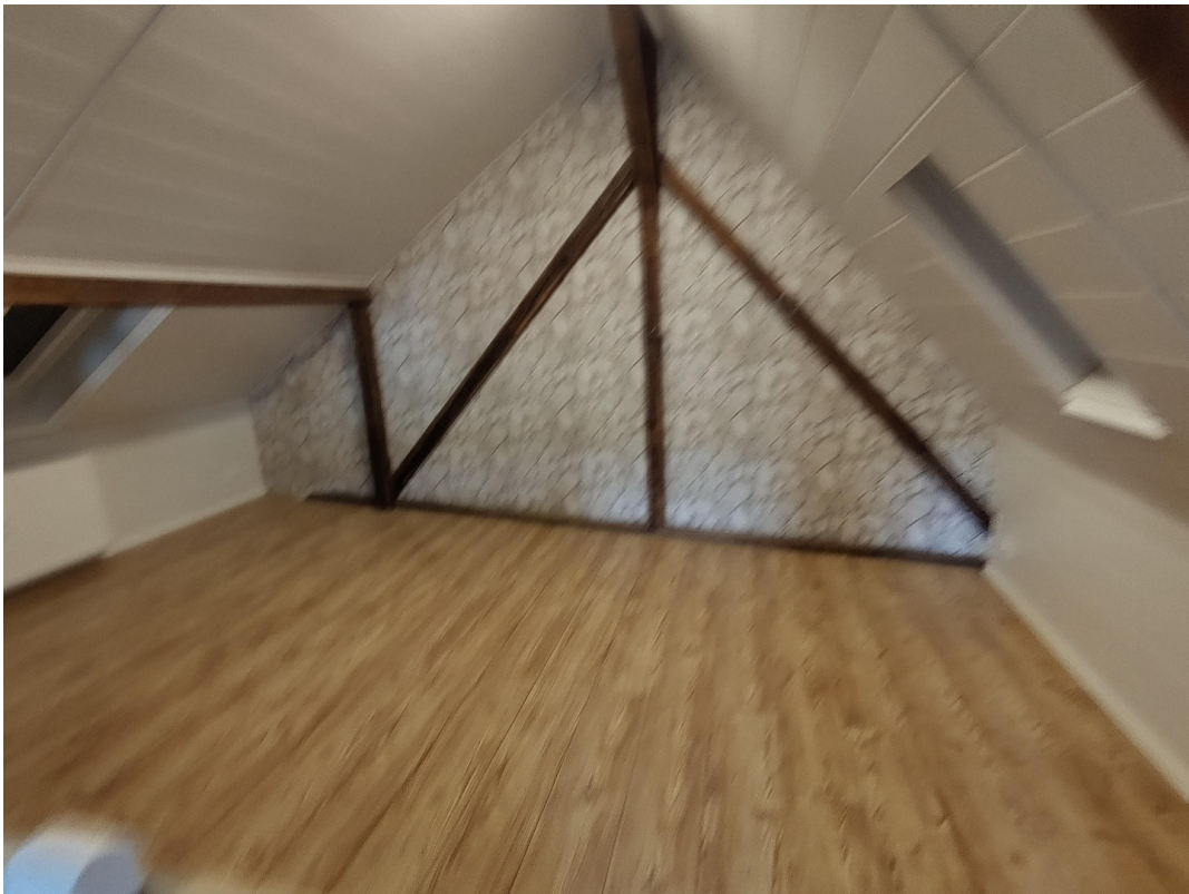
Hälfte vom Dachboden