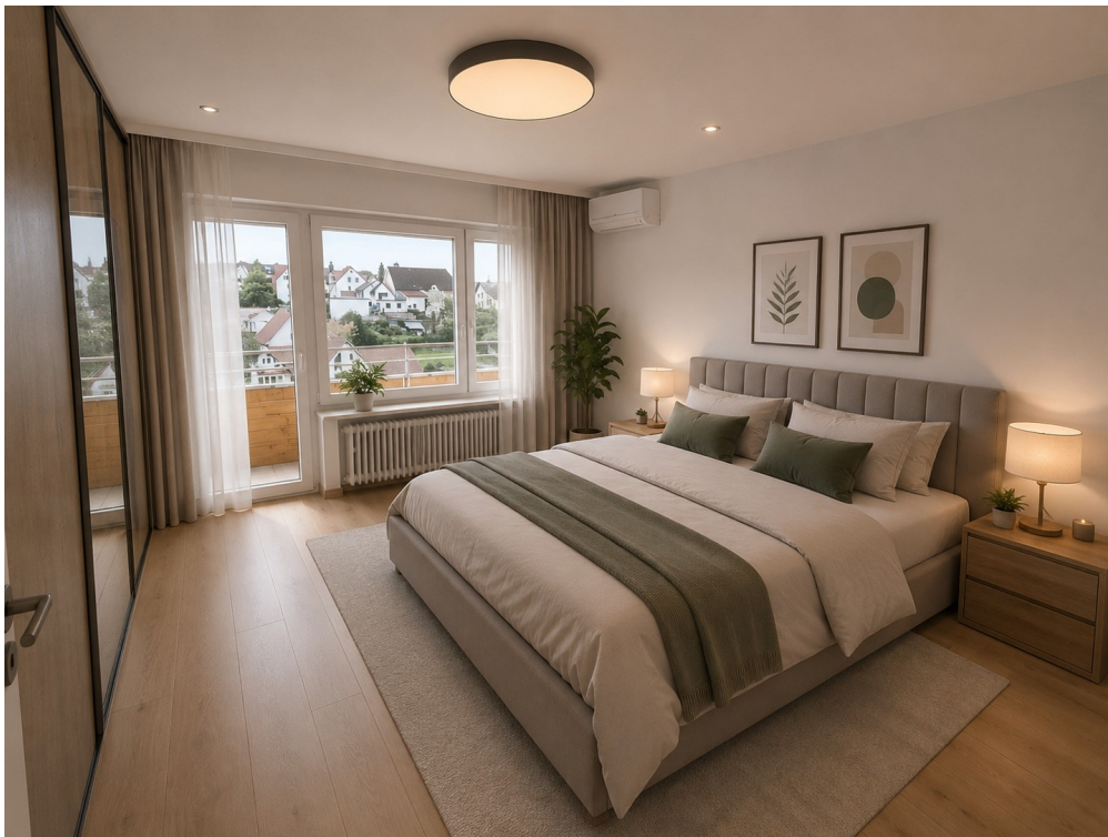
KI Vorschlag Schlafzimmer