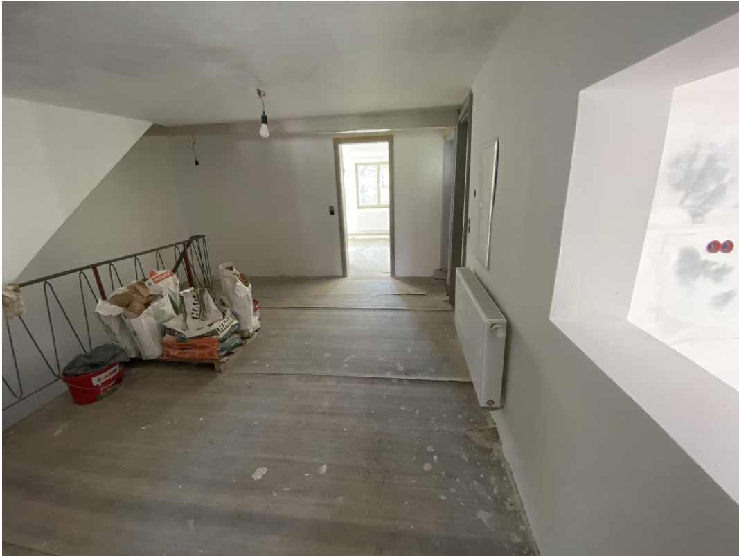
Diele im 1. OG