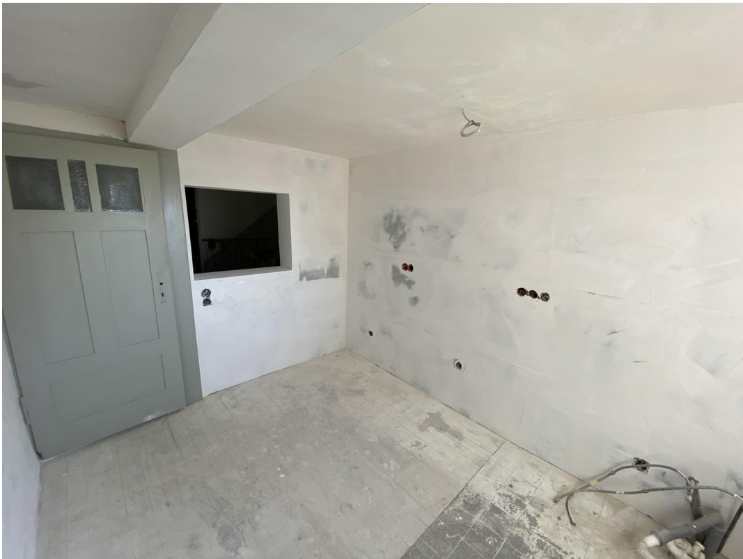
Küche mit Durchreiche