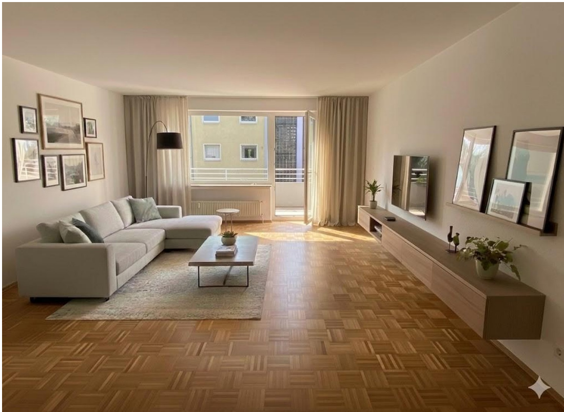
Einrichtung KI generiert