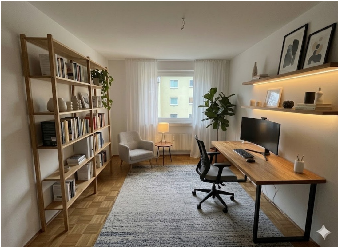
Kinderzimmer Einrichtung KI