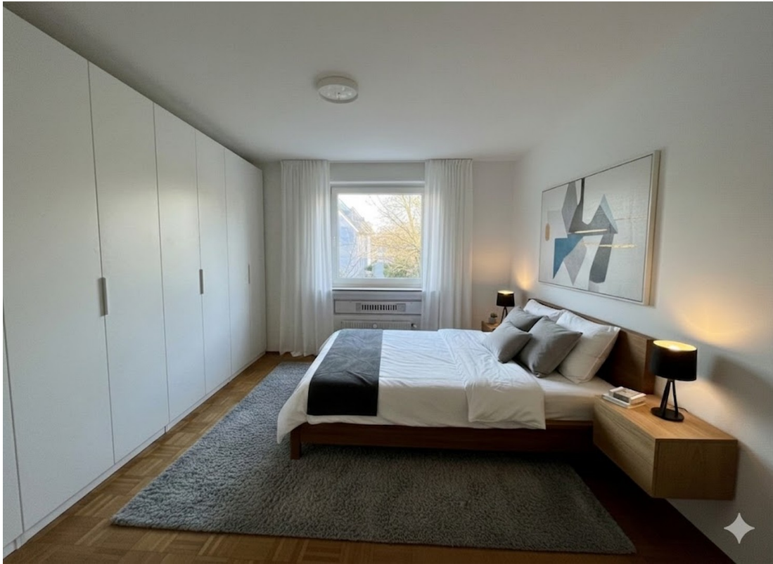
Einrichtung KI generiert