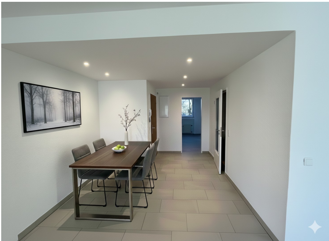
Einrichtung KI generiert