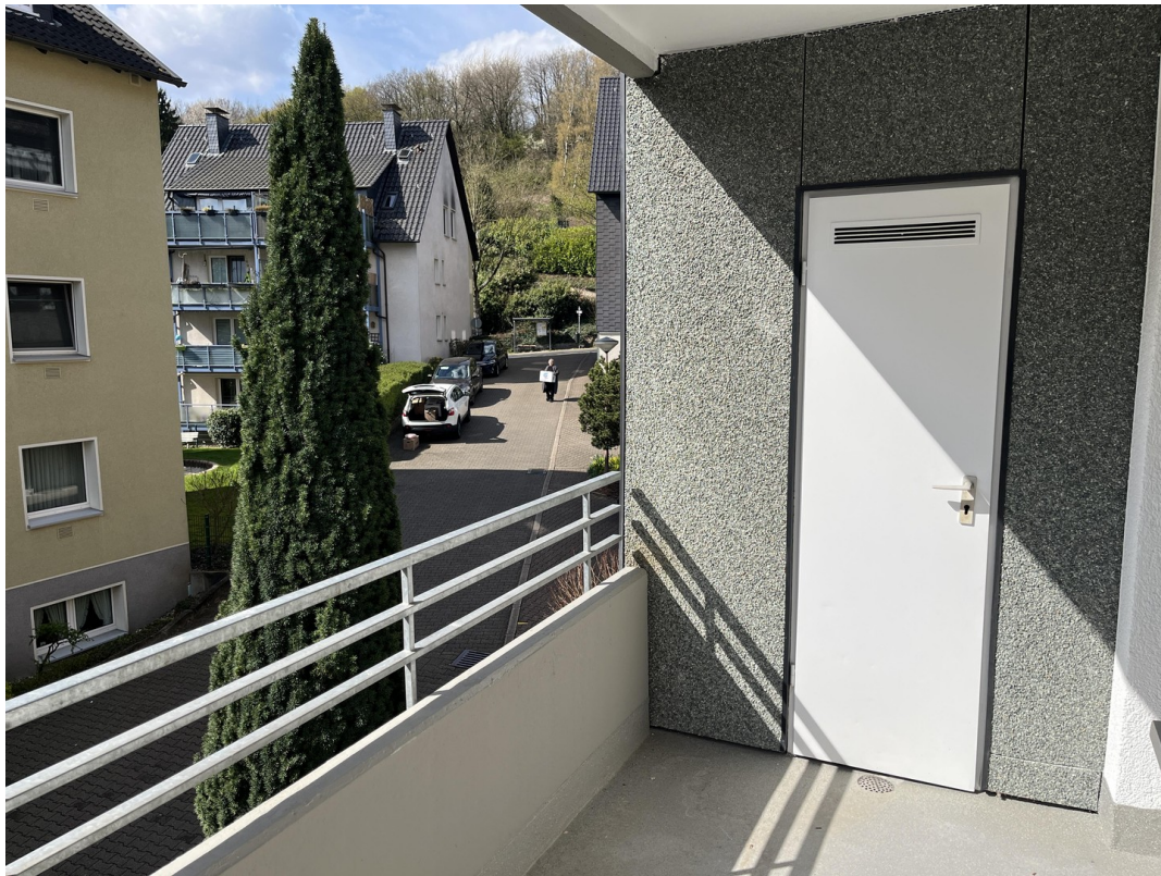
Balkon mit Abstellkammer