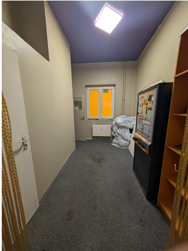
hinterer Bereich (Cafe Crown)