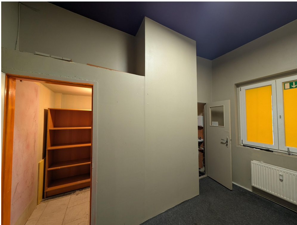
hinterer Bereich (Cafe Crown)