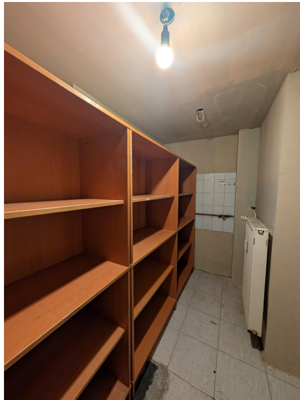
Abstellraum (Cafe Crown)