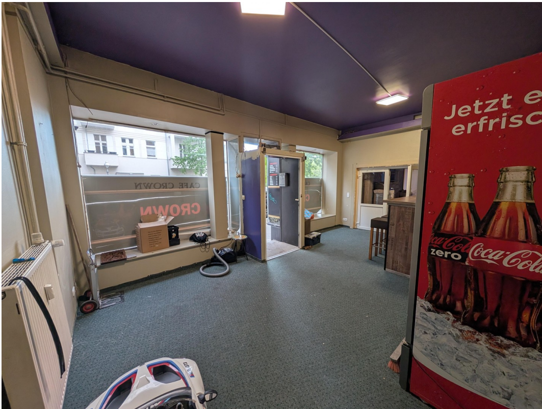
Innenansicht (Cafe Crown)