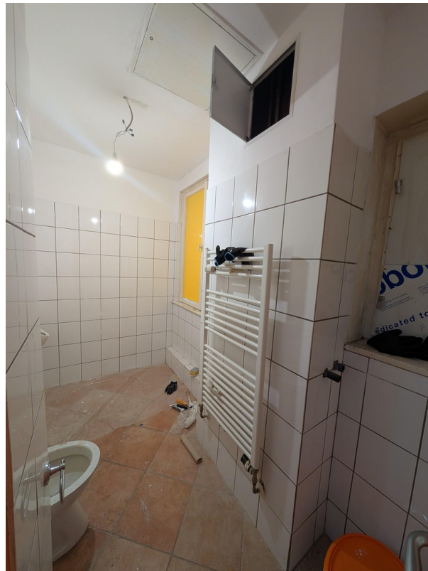
WC (Cafe SHOP)