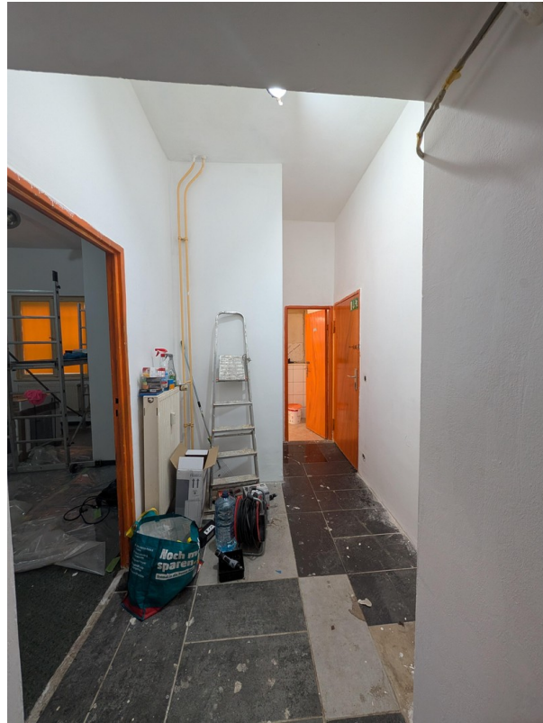
hinterer Flur (Cafe SHOP)