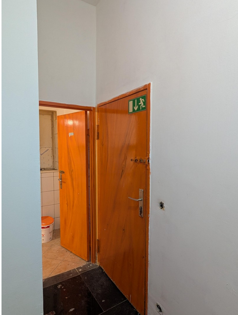
Fluchttür Hinterhof (Cafe SHOP)