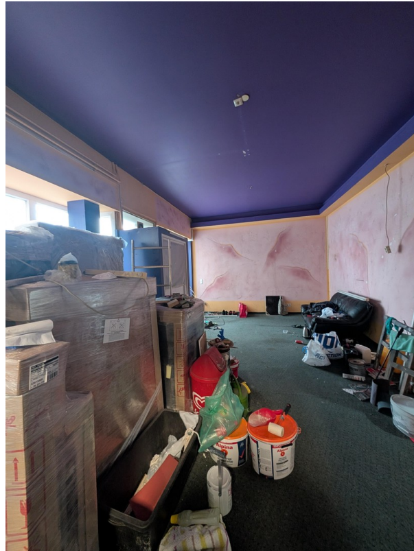
Innenansicht (Cafe SHOP)