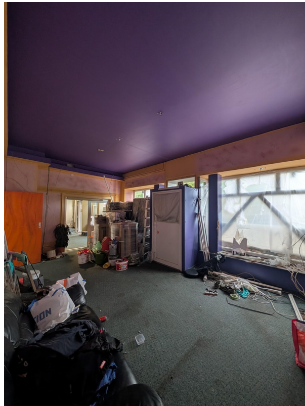
Innenansicht (Cafe SHOP)