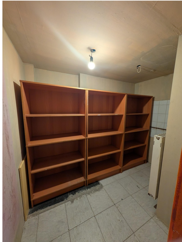
Abstellraum (Cafe Crown)