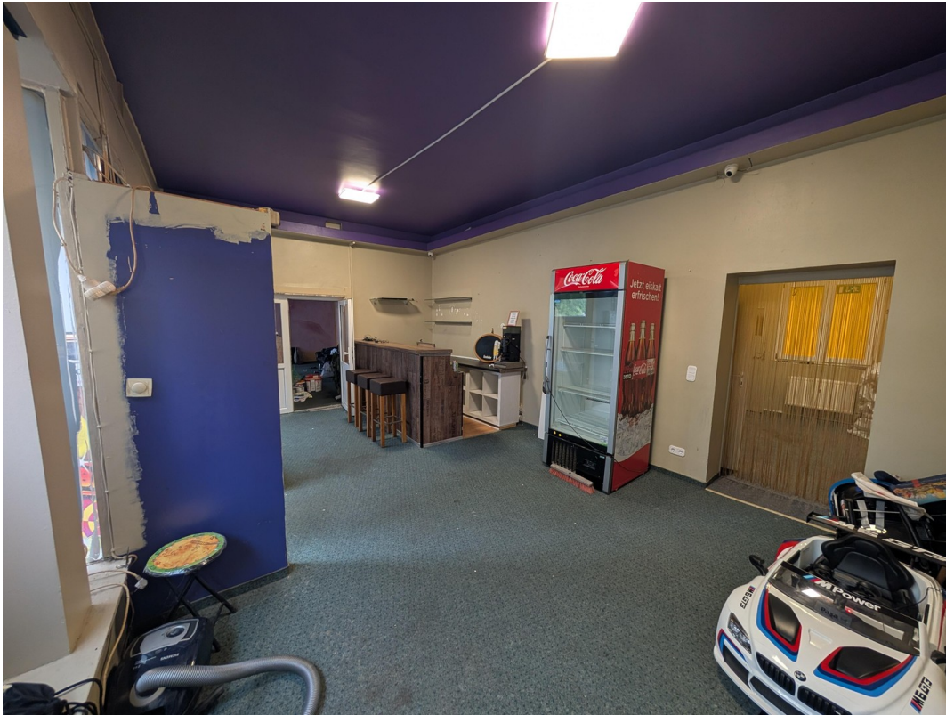
Innenansicht (Cafe Crown)