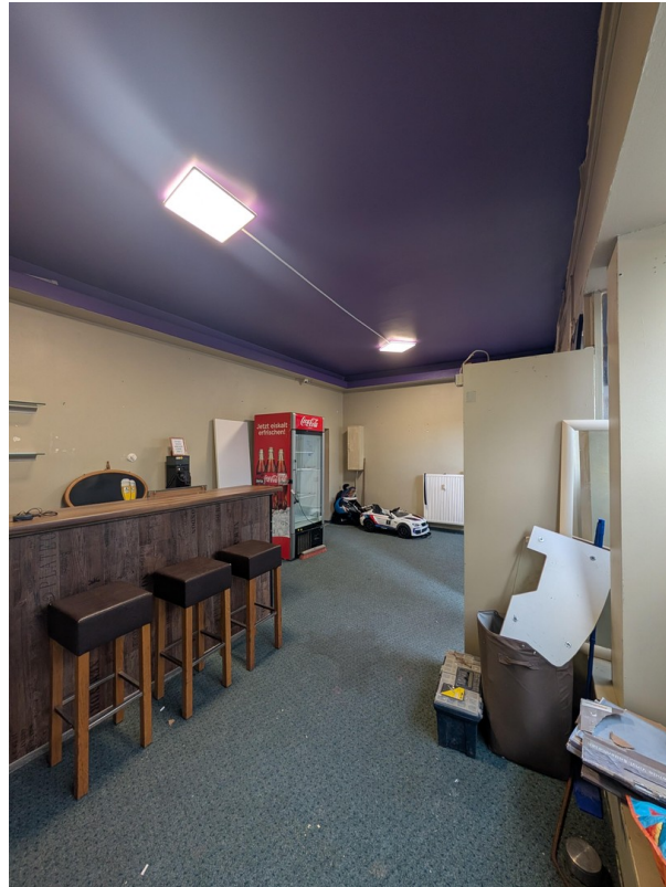
Innenansicht (Cafe Crown)