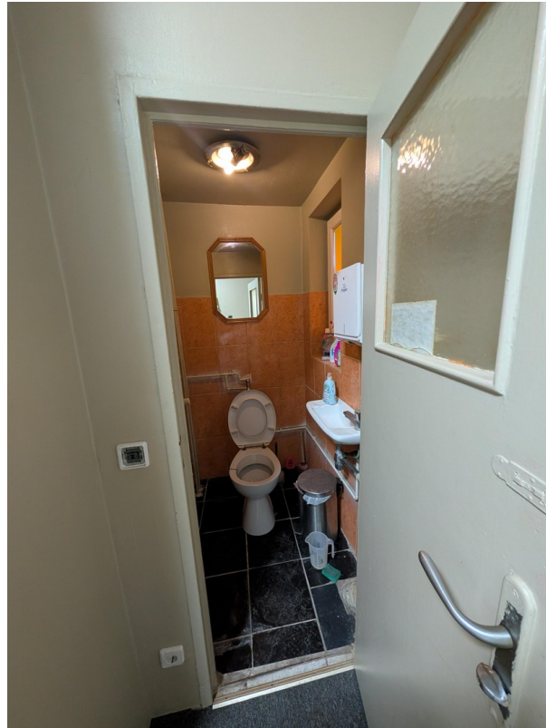
WC (Cafe Crown)