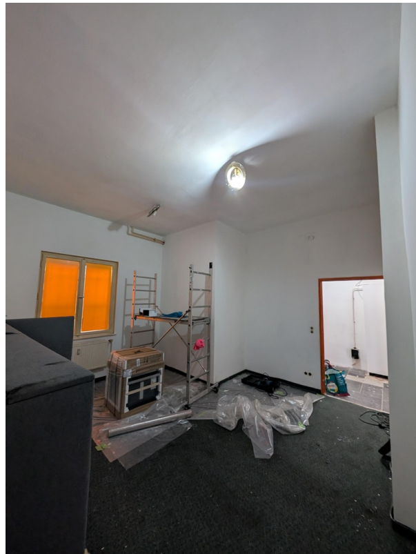
hinterer Zimmer (Cafe SHOP)