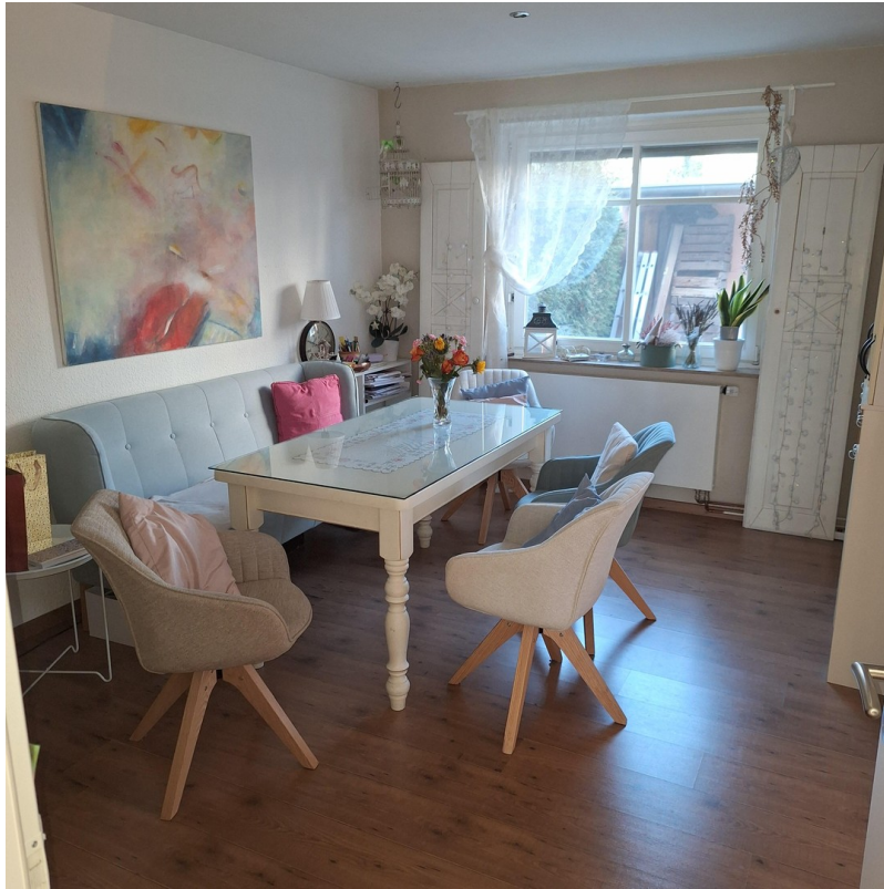
Esszimmer - Durchgang zum Wohn