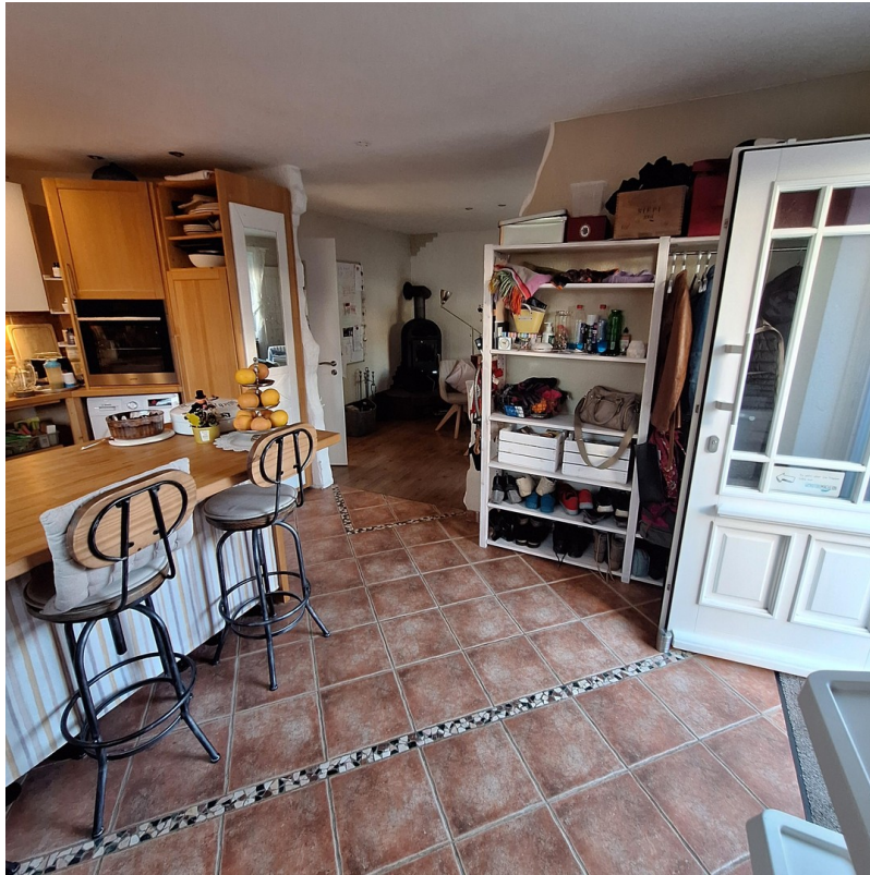
Eingang in die Küche