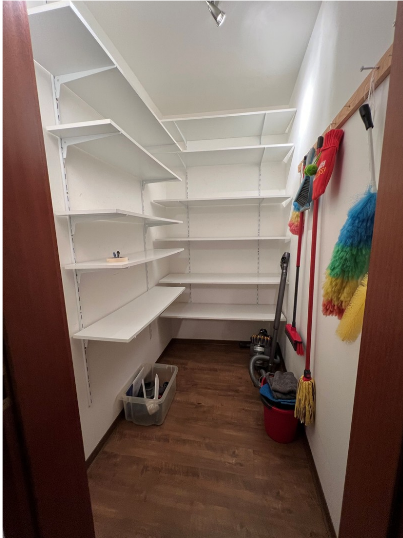
Vorrats- / Abstellraum