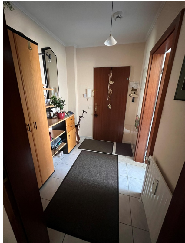
Flur mit Vorraum