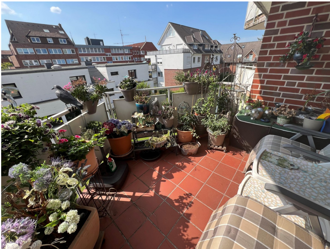
Balkon mit Abendsonne