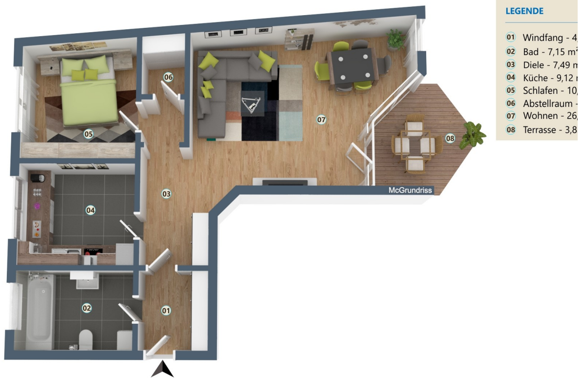
Grundriss der Wohnung