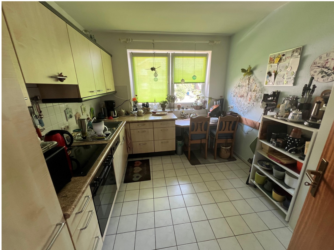
Küche mit viel Platz