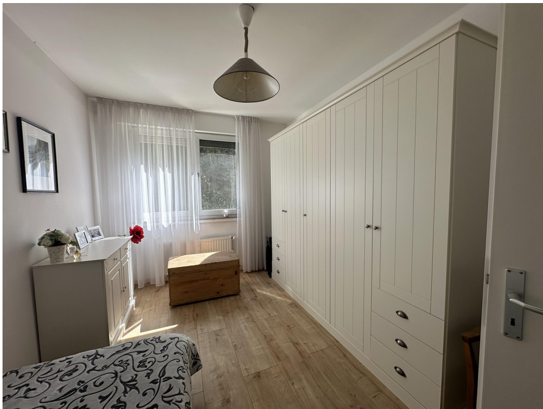
Kinder- / Arbeitszimmer