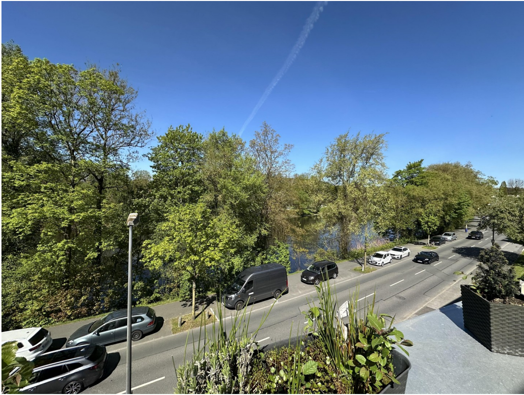
Blick auf die Ruhr