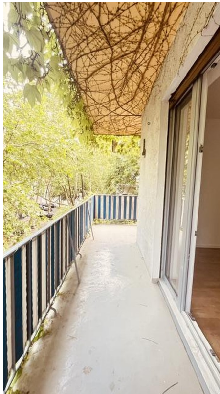
Eckbalkon von Schlafzimmer 2