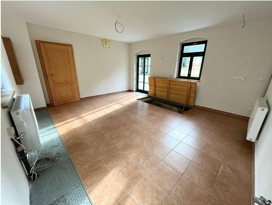
Wohnküche mit Kaminanschluß