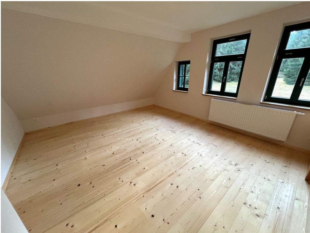
Vollholzdiele im OG