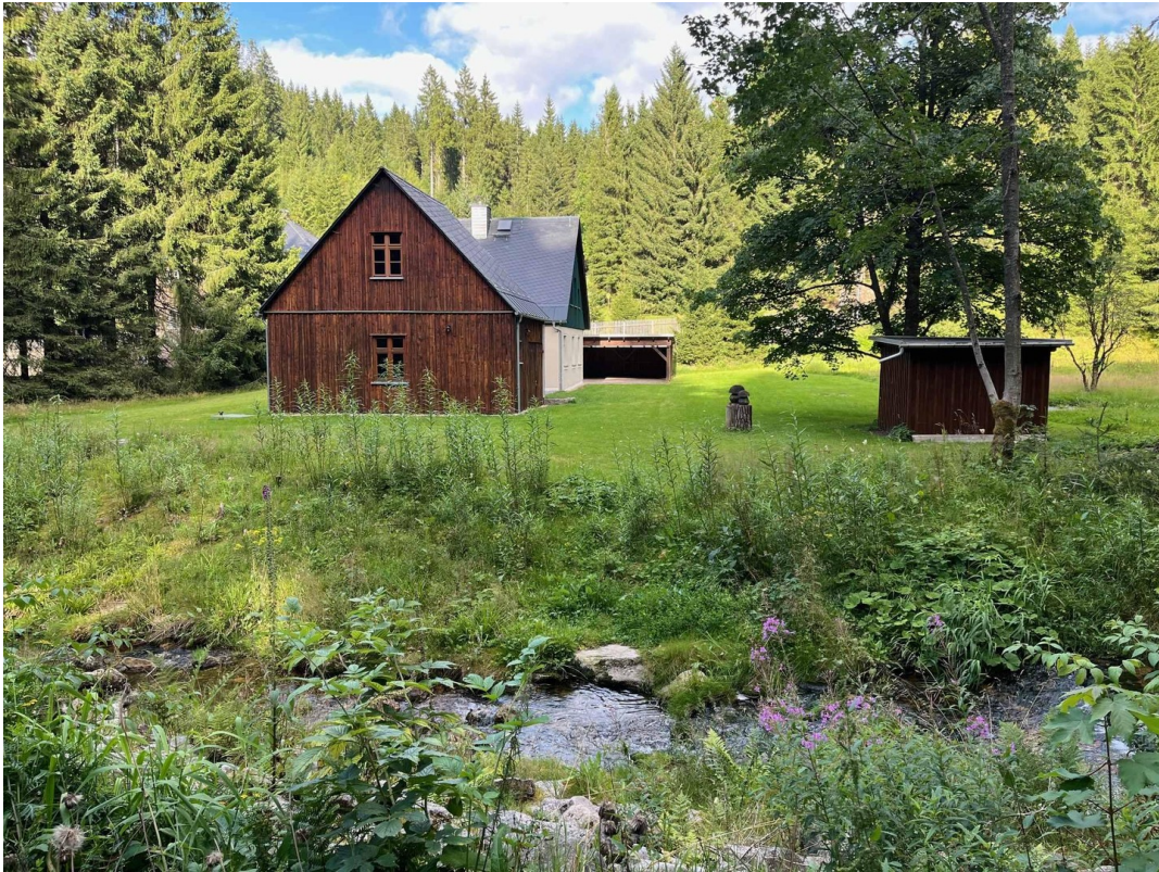
Westansicht mit Gerätehaus