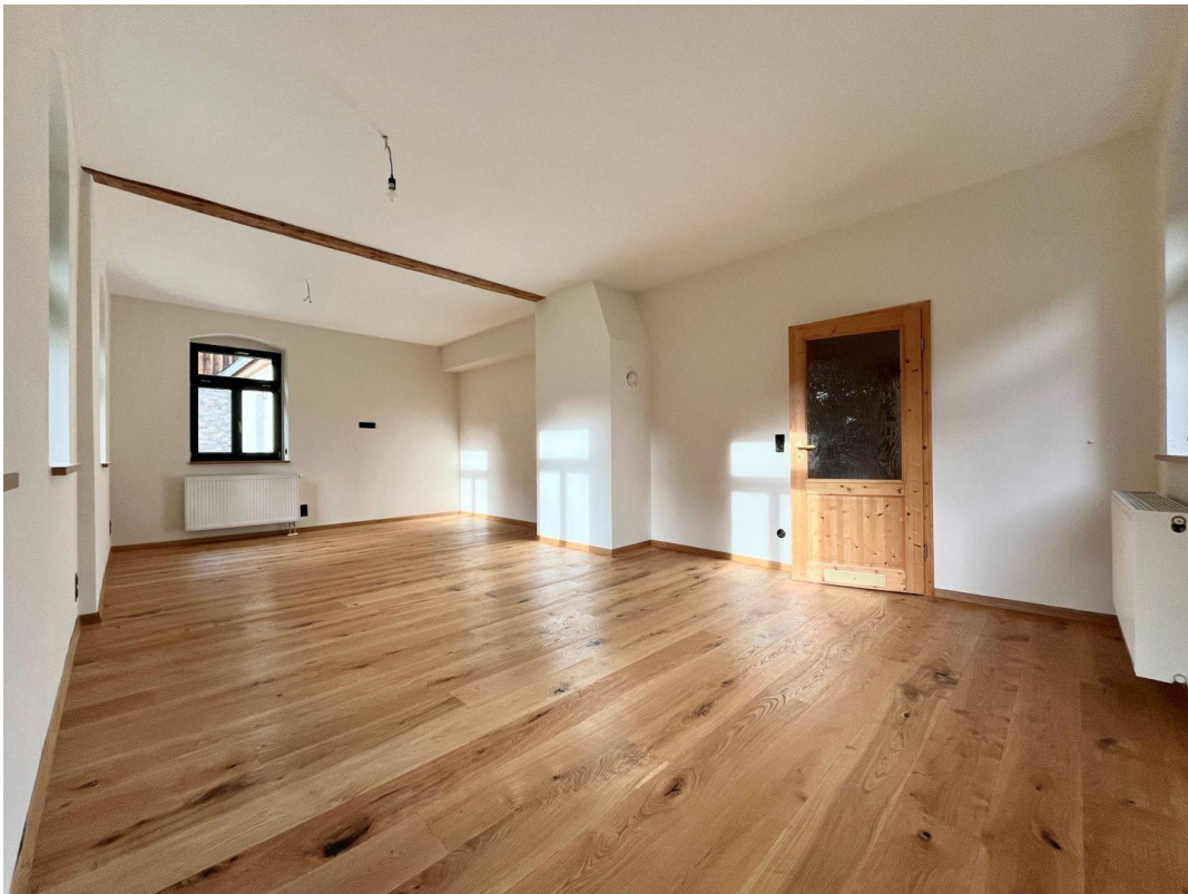
Wohnzimmer mit Kaminanschluß