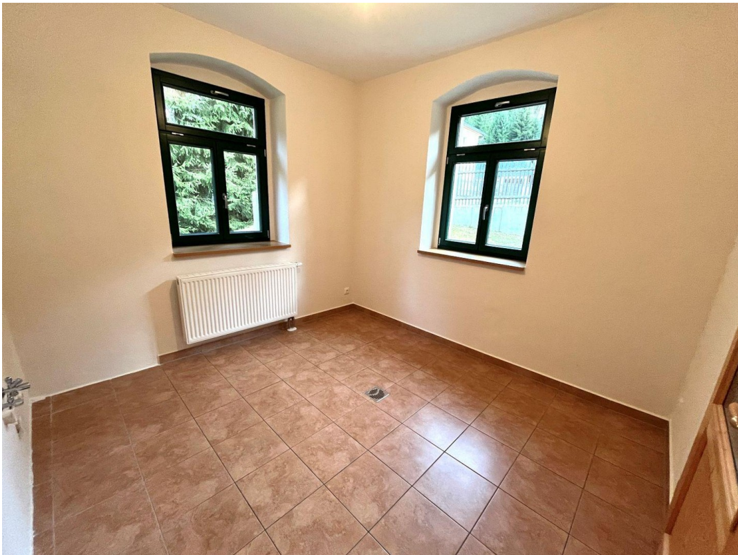
Küche oder Arbeitszimmer