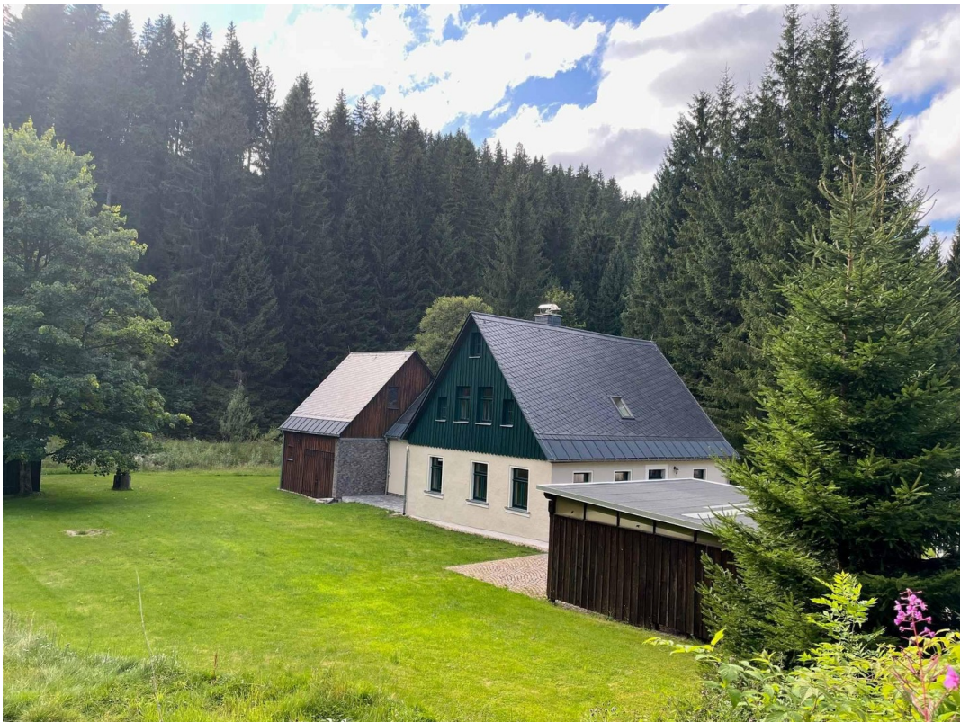
Blick zur Immobilie