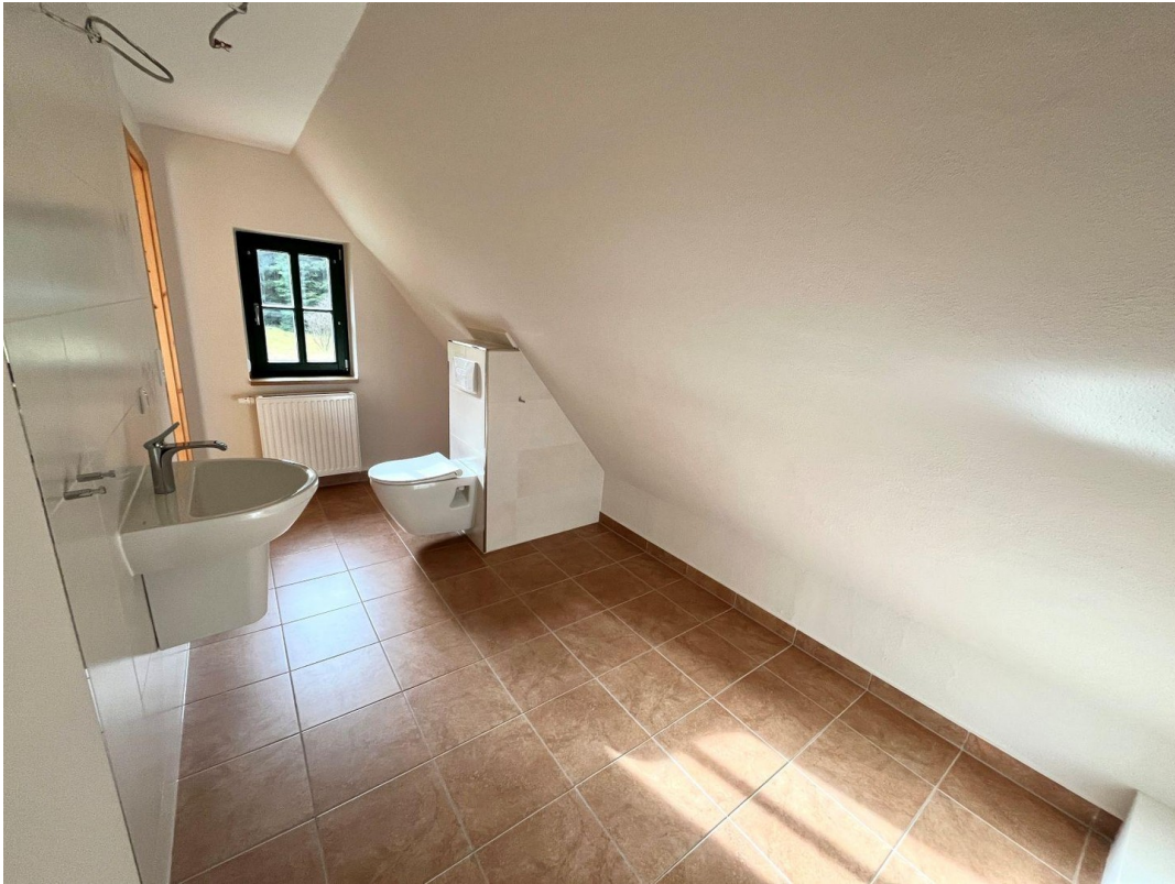
Neues Gäste WC, zus Dusche mgl