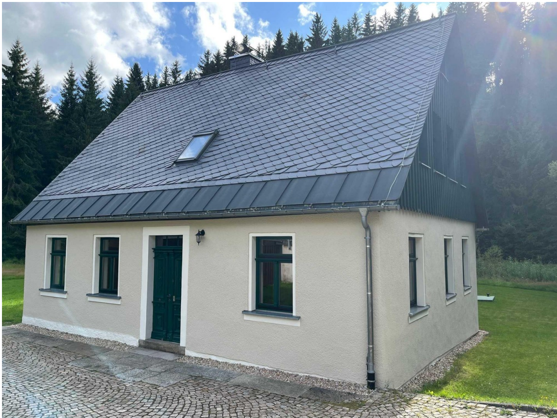
Ansicht von Ost