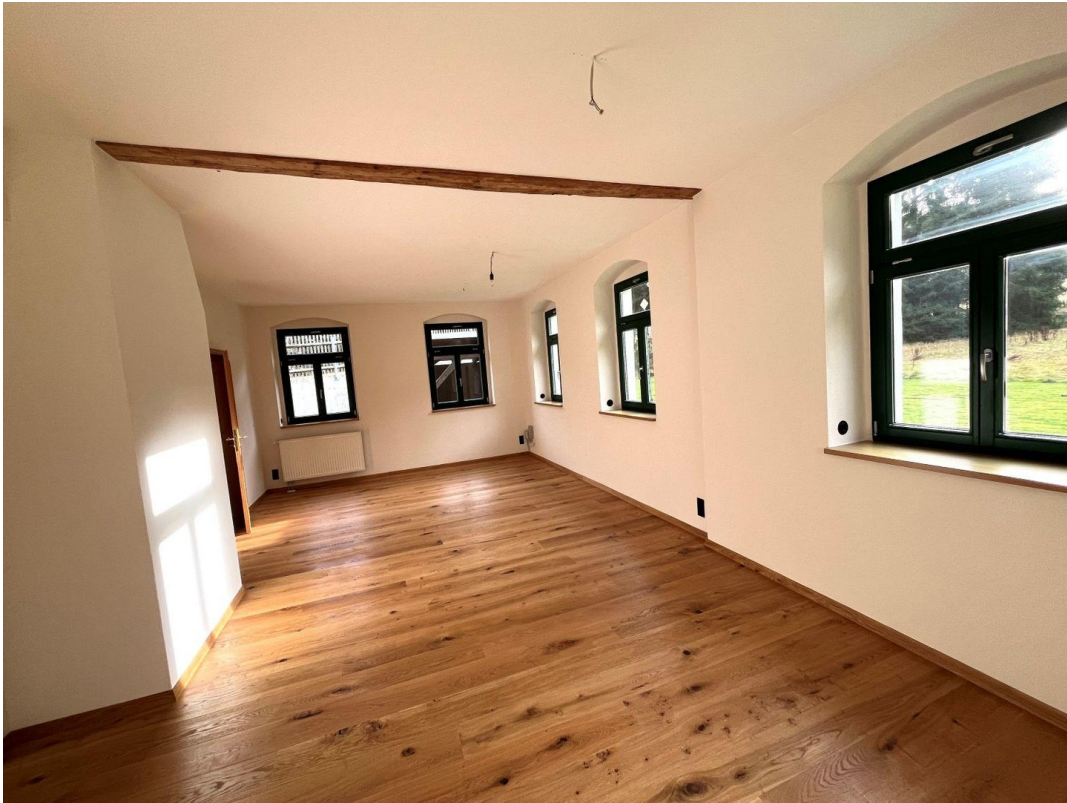
Wohnzimmer mit Eichendielung