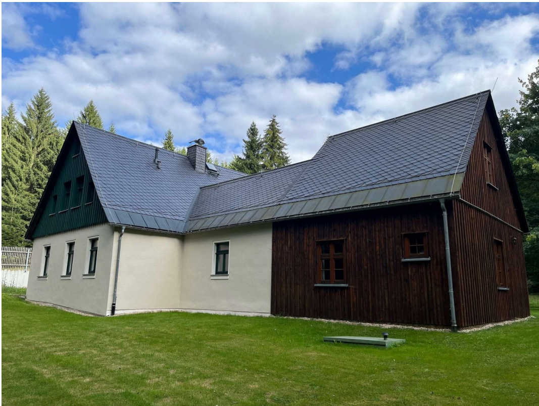
Rückansicht mit BioKKA/FG Tank