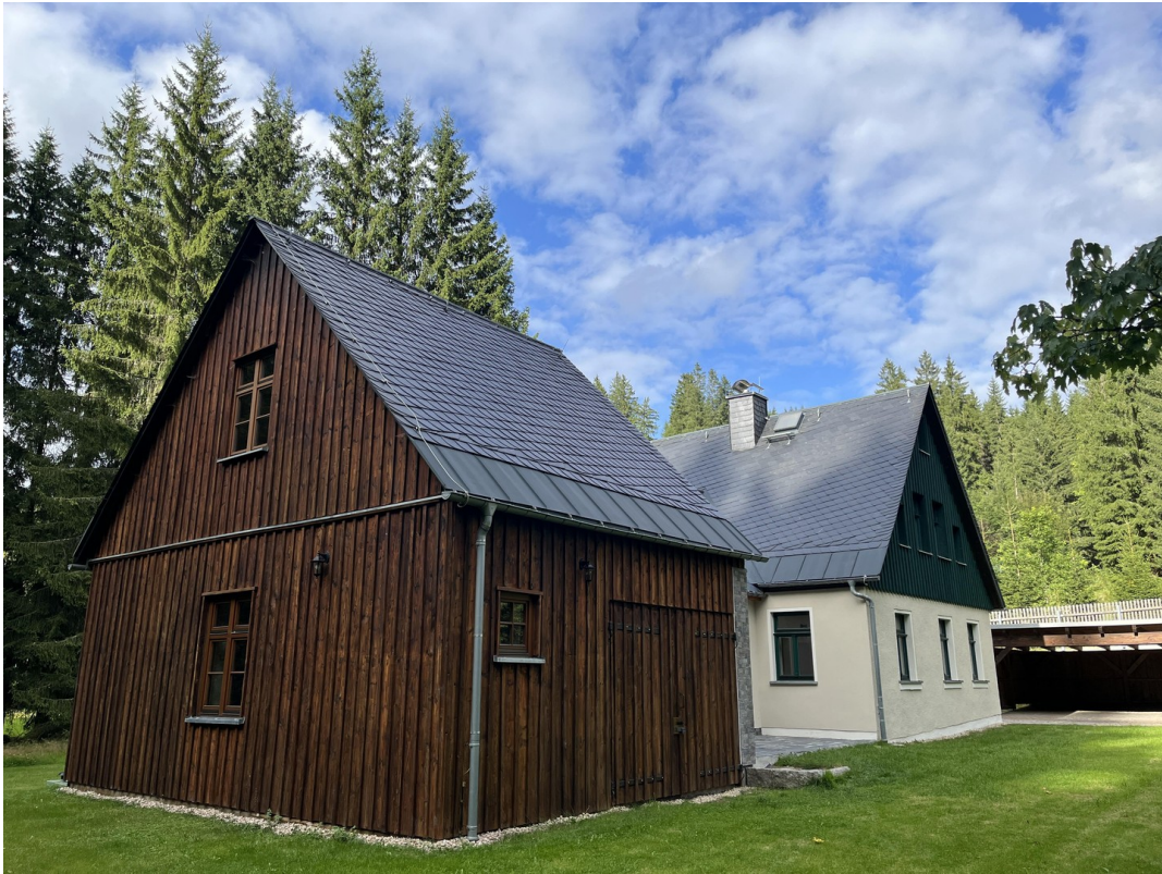
Südwest Ansicht mit Carport