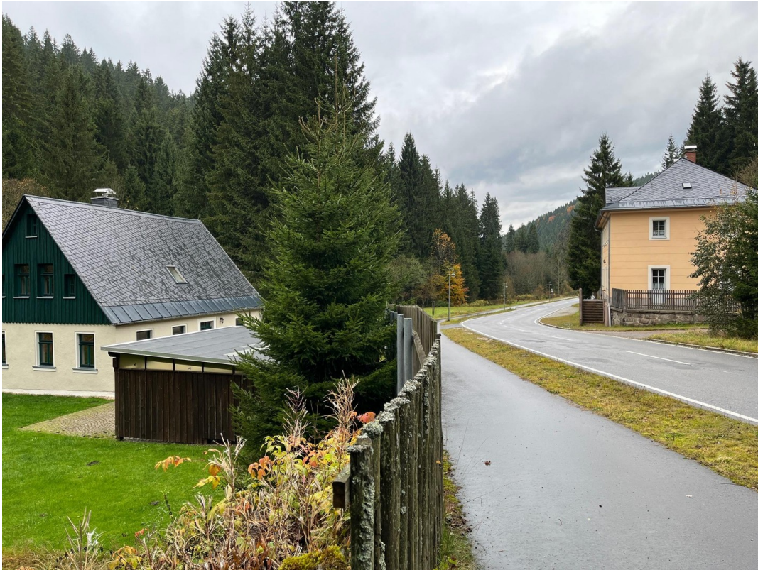
Blick zum einzigen Nachbarn