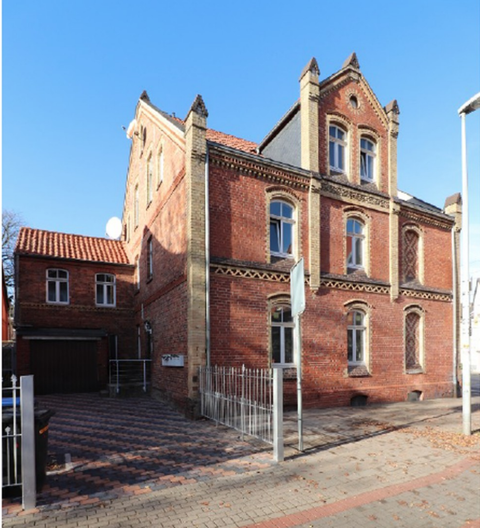
Haus von Außen