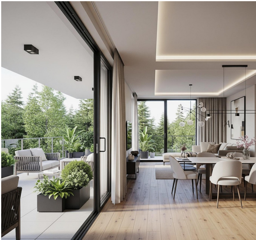
Blick in den Wohnzimmer