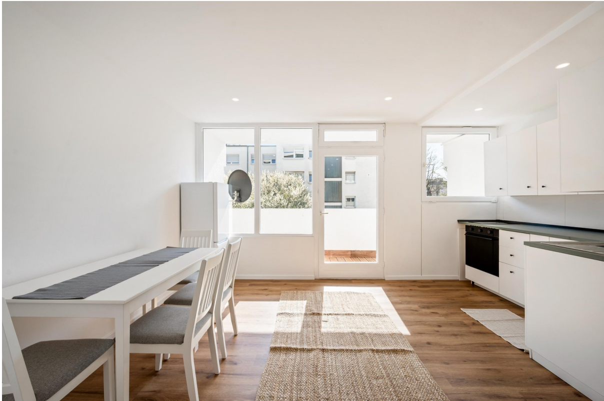
Esszimmer und Küche