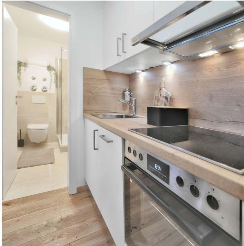
Blick Küche Bad