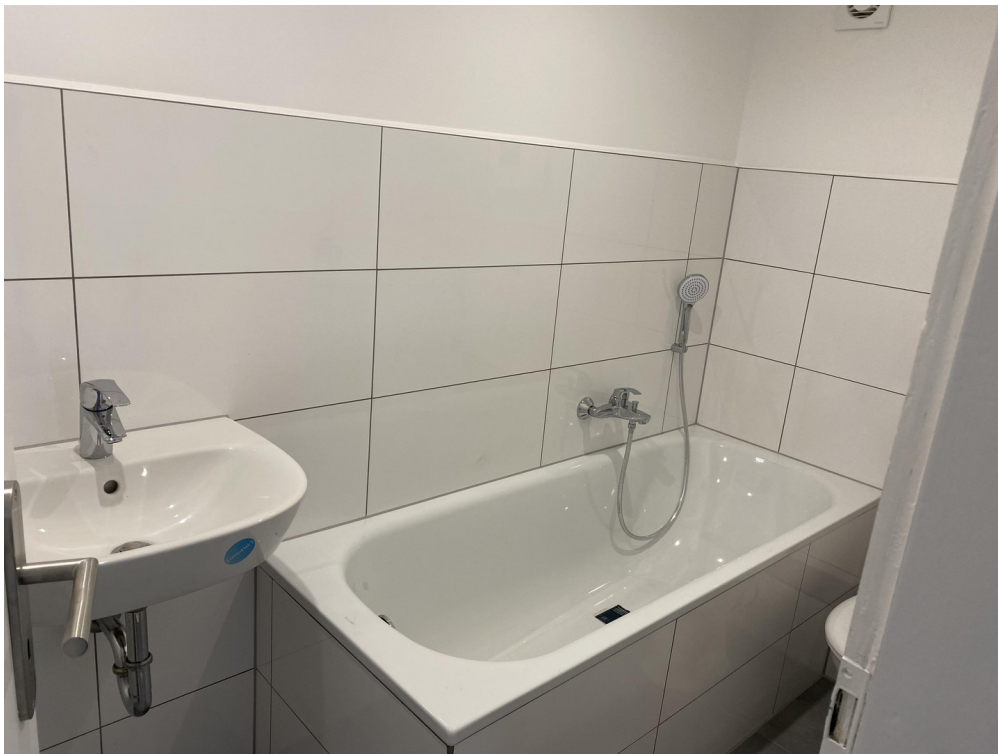
Wannenbad 3,5 m 2