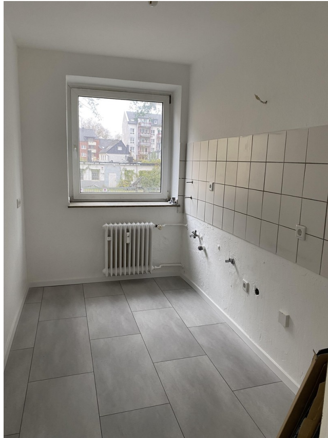
Küche 6 m 2