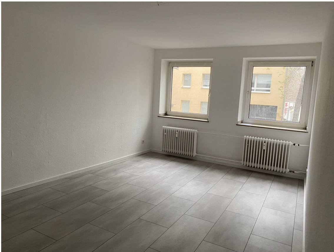
Wohnzimmer 20 m 2