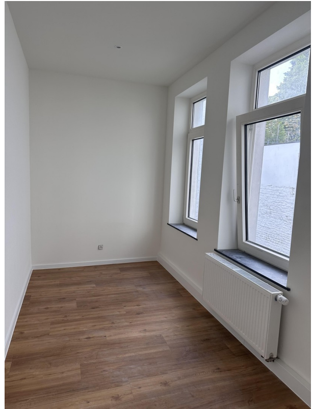
kleines Schlafzimmer/ Büro