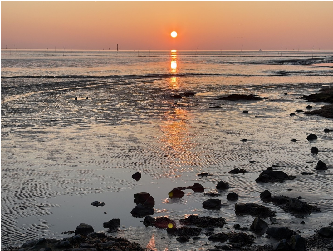
4 km vom Meer