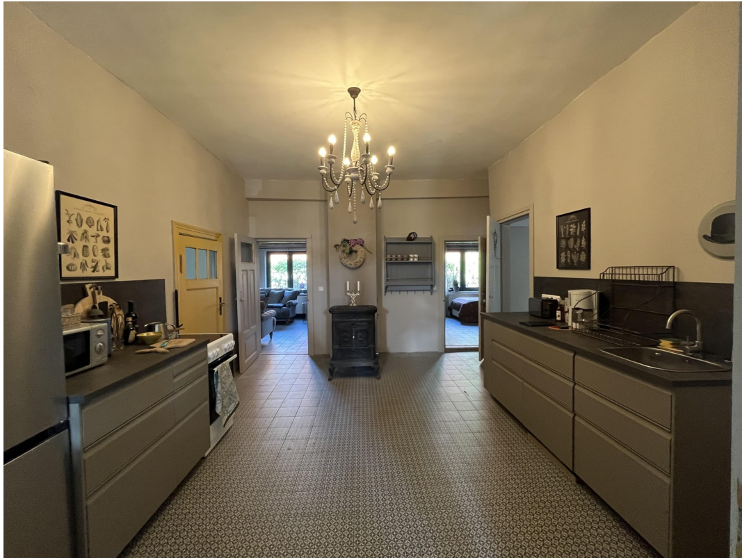
Küche im Mittelbereich