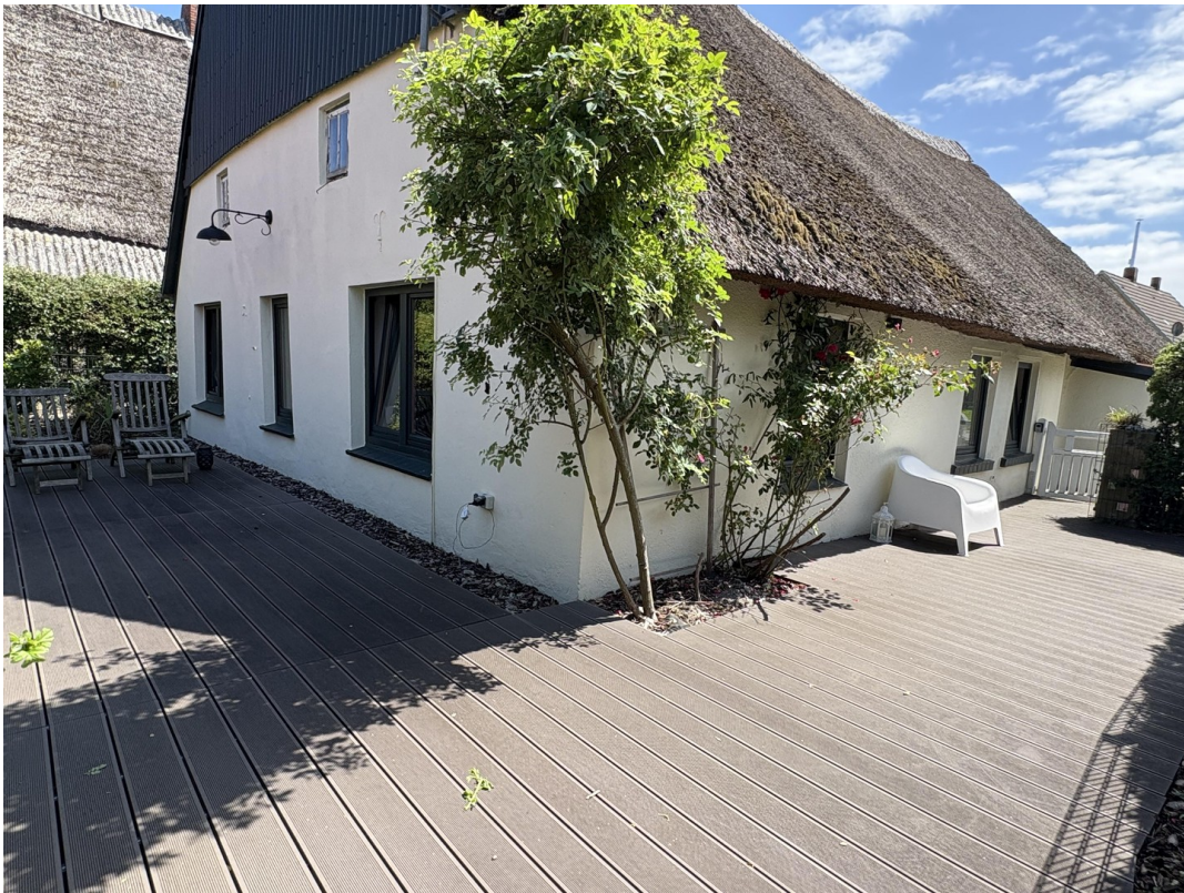
umlaufende WPC-Dielen Terrasse