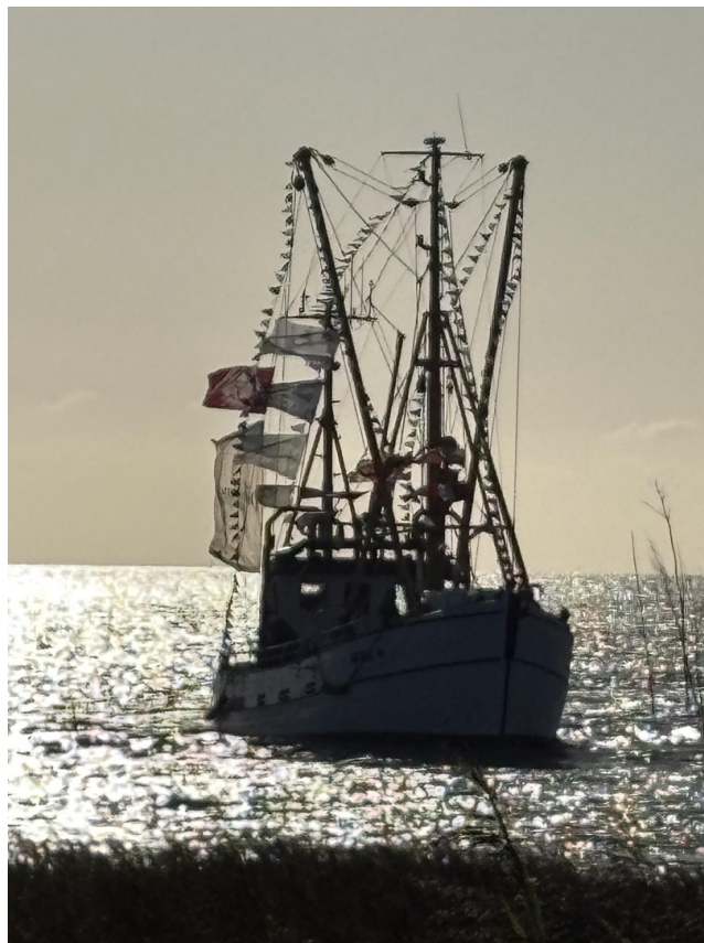
Kutter in Wremen