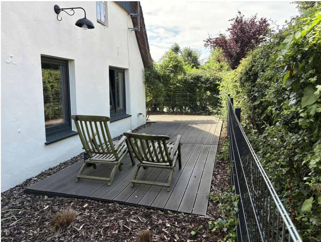
Terrasse mit Nachmittagssonne