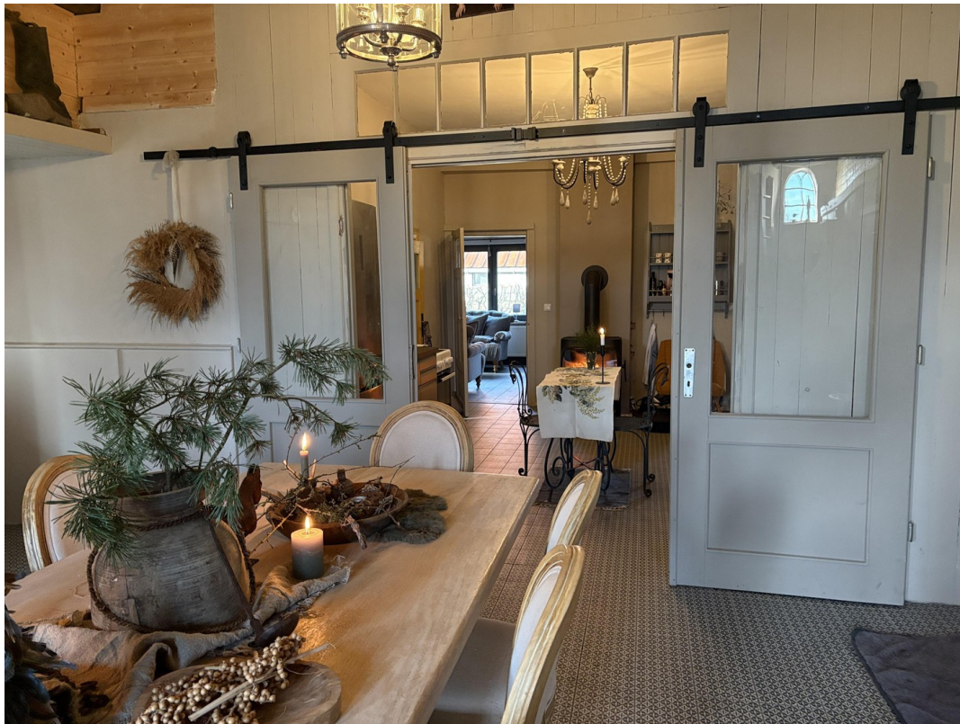
Diele mit Schiebetür zur Küche