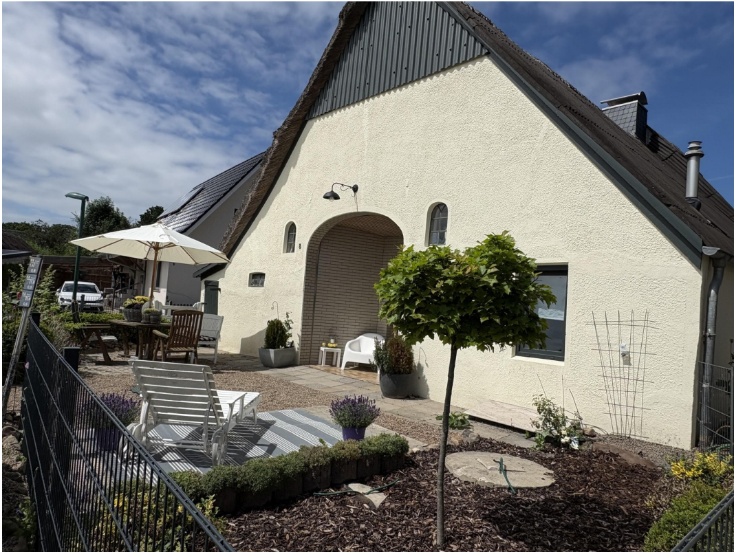
Vorgarten mit Morgensonne