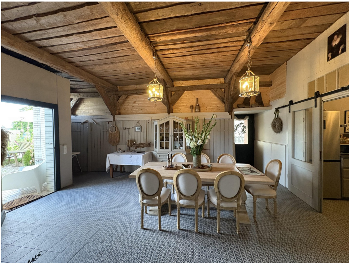
die urige Ess-Diele