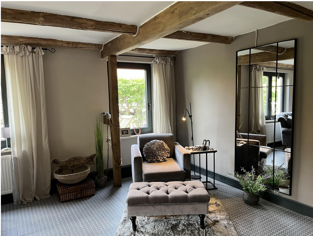
Teil v. Wohnzimmer