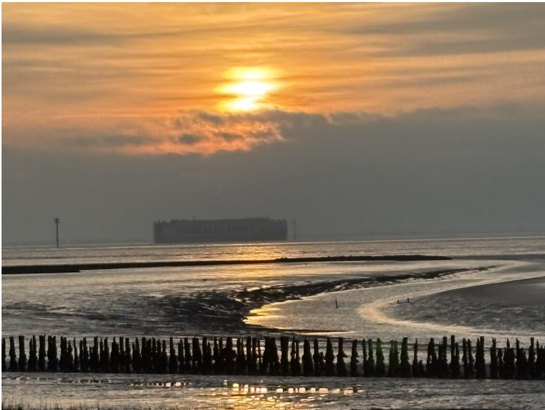
Container-Riese vor Bremerhave