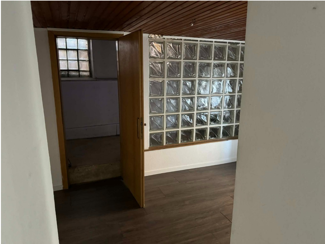
Souterrain Zimmer 2