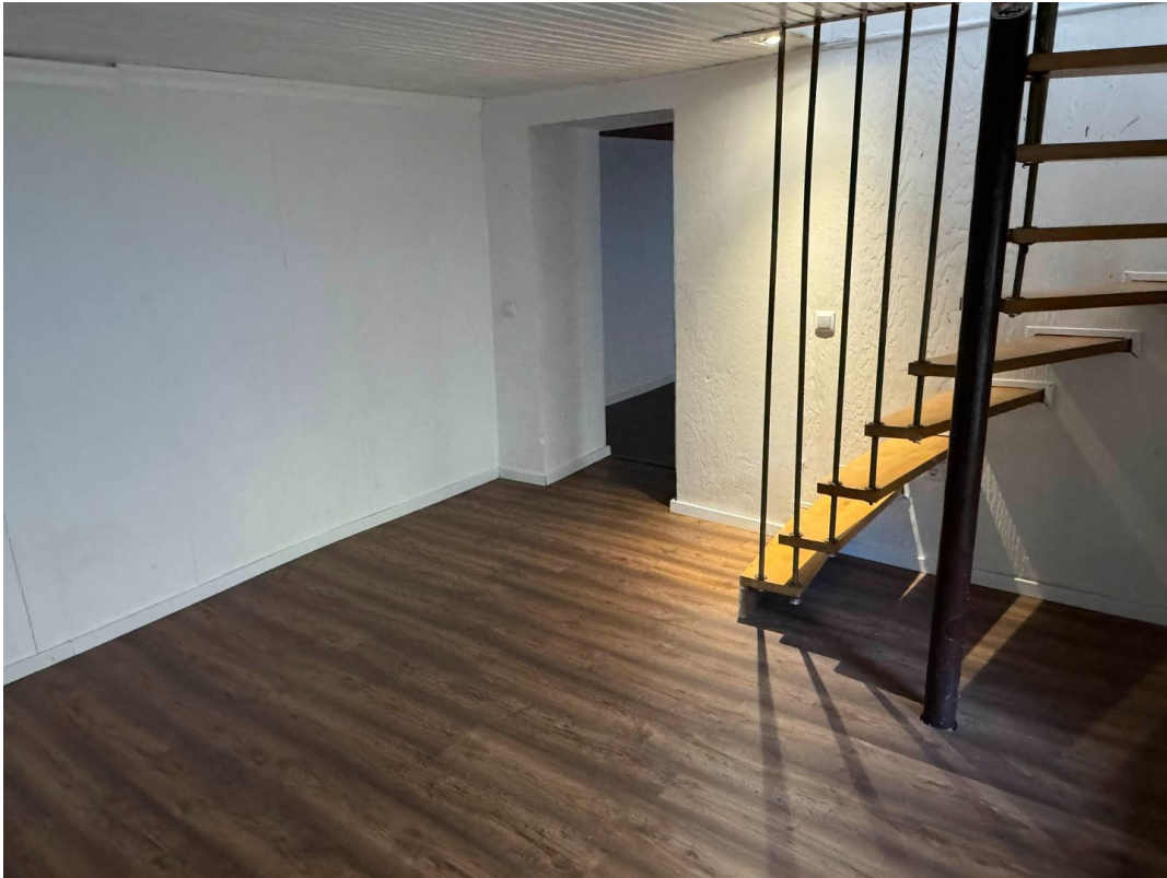
Souterrain Zimmer 1