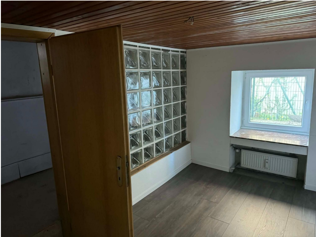
Soutterrain Zimmer 2