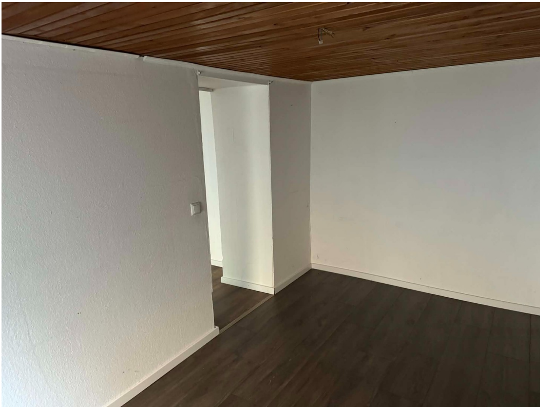
Souterrain Zimmer 2