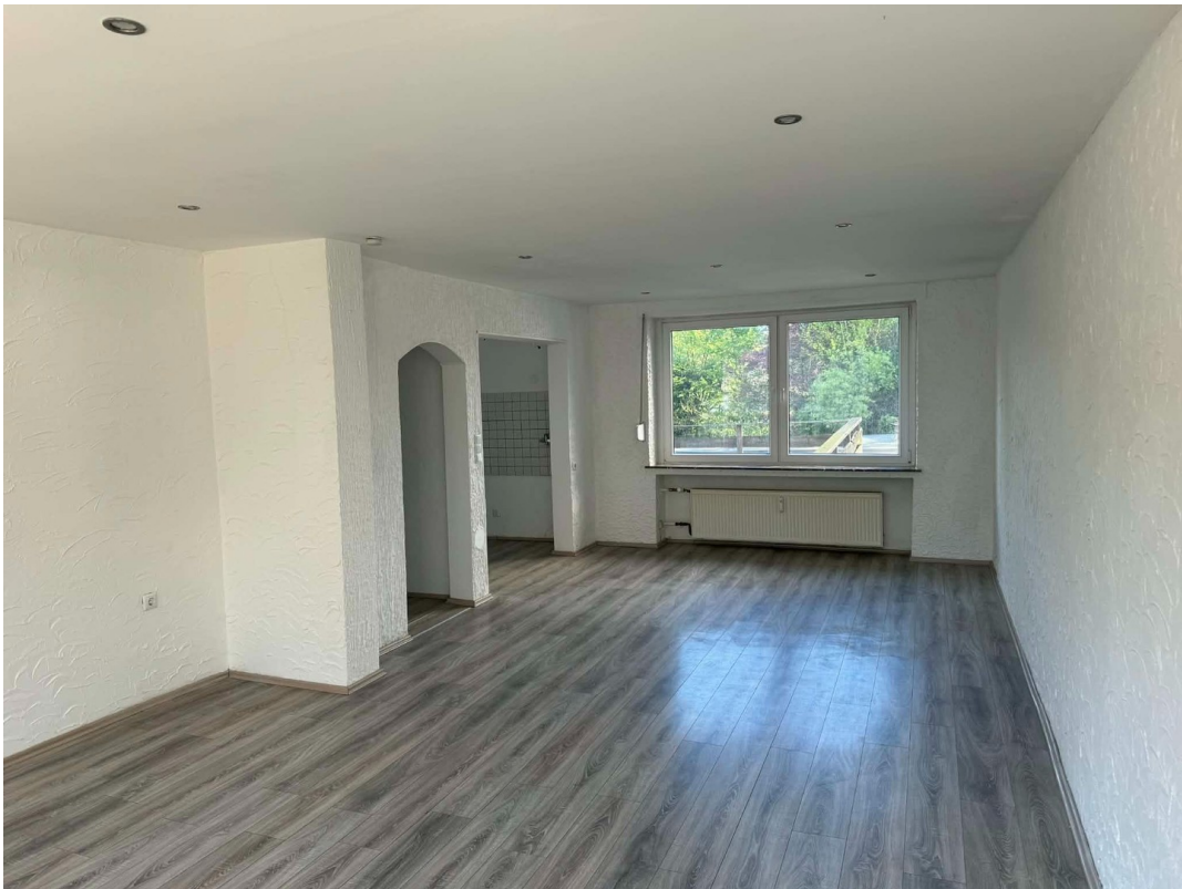
Wohnzimmer offene Küche