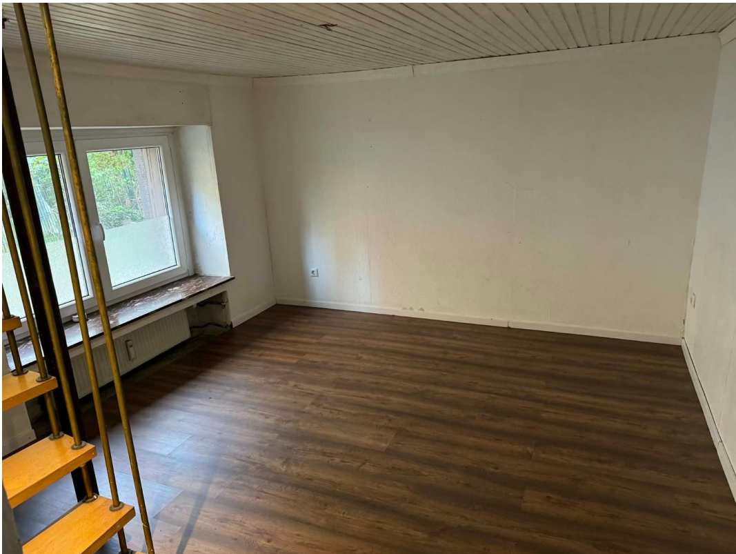
Souterrain Zimmer 1