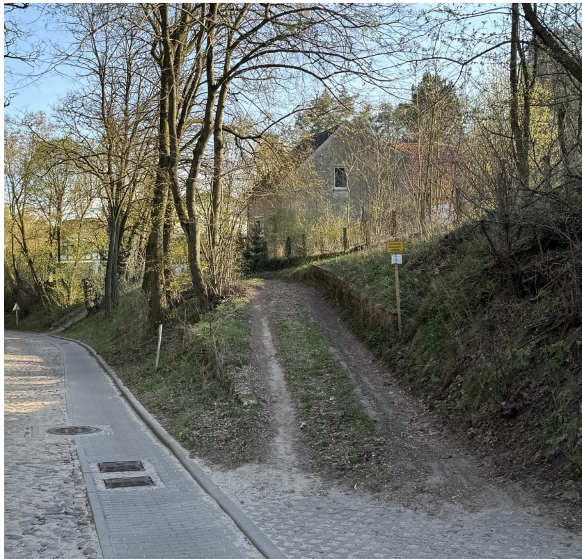
Zufahrt von der Straße