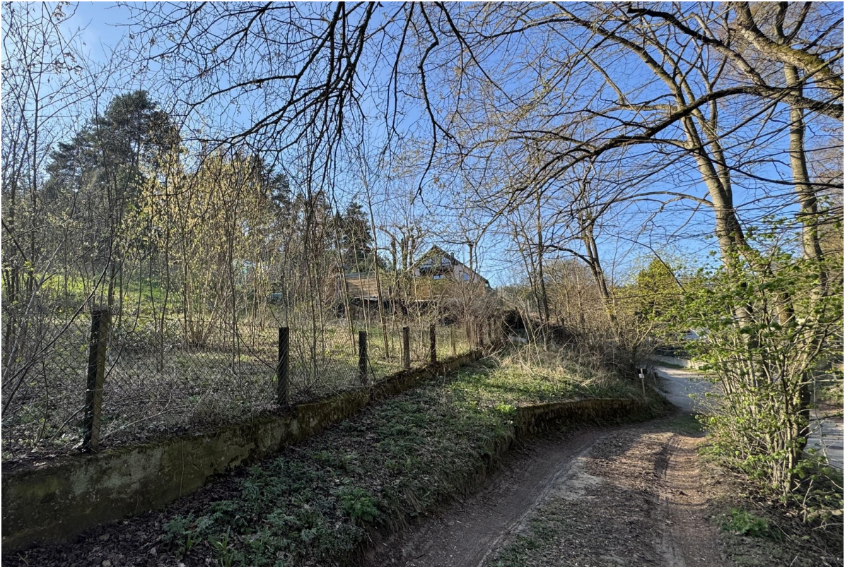
Ausfahrt zur Straße