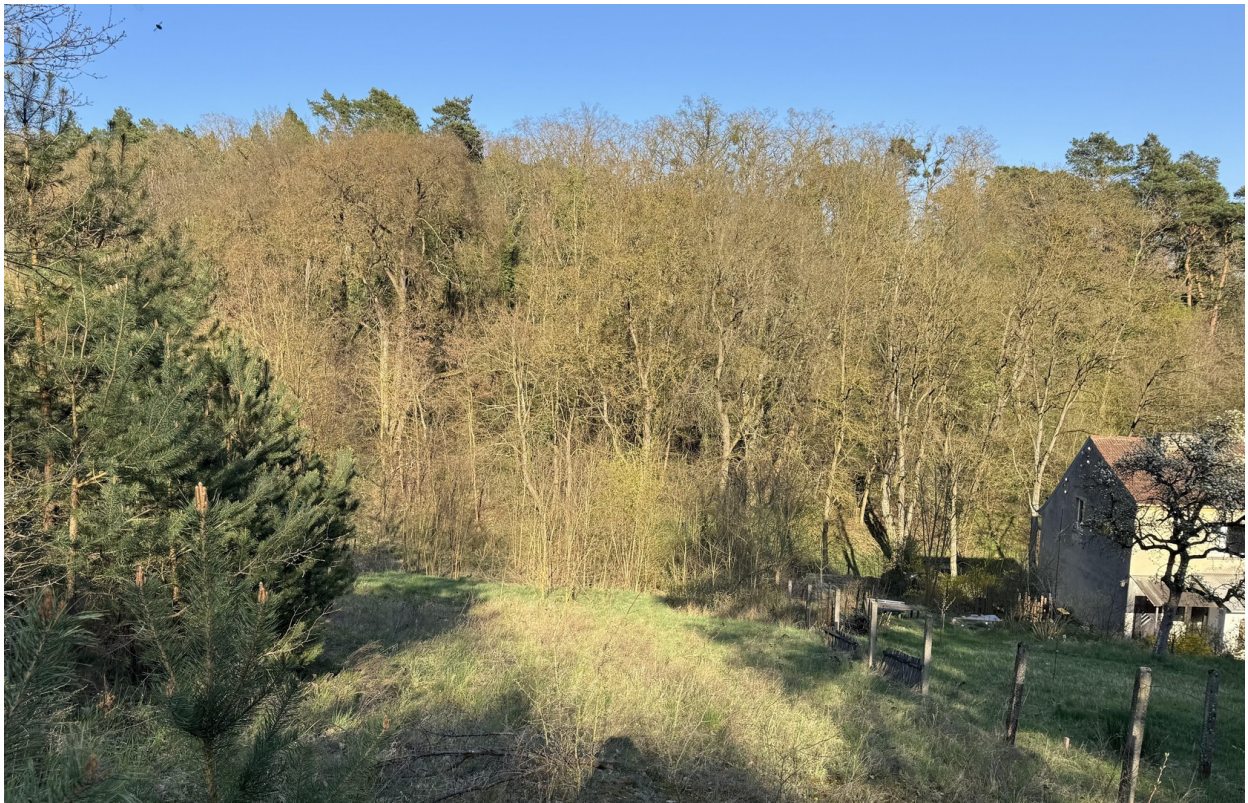
Blick zur Straße