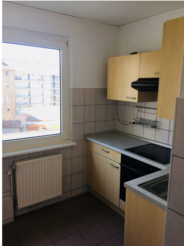
Küche inkl. Einbauküche