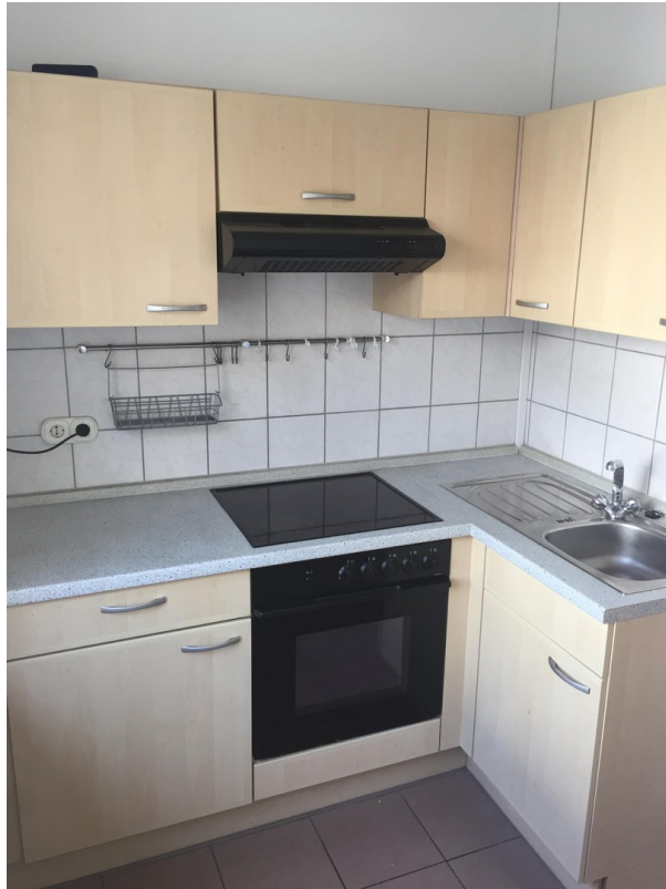
Küche inkl. Einbauküche