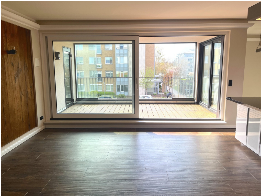
Loggia mit Wintergarten