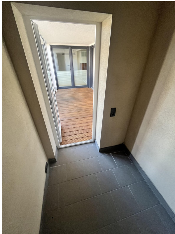
Abstellkammer an der Loggia