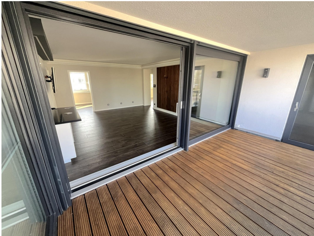
Blick von Loggia ins Wohnzimmer.