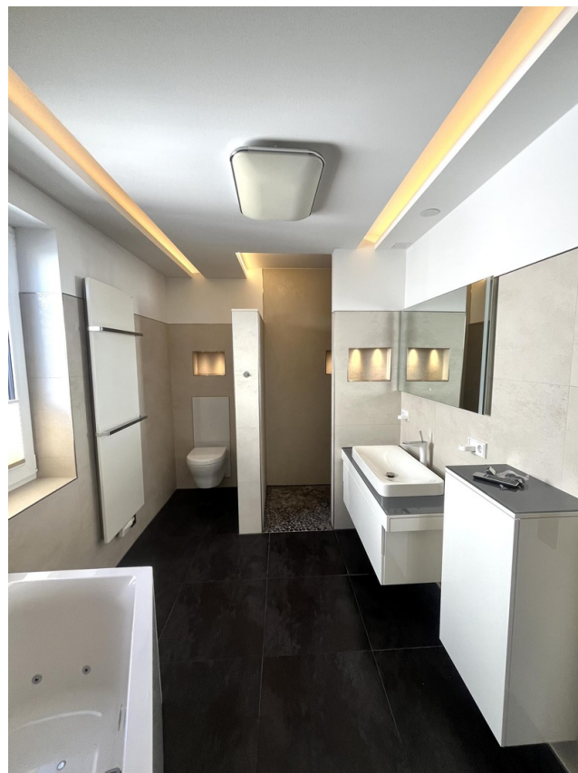
Badezimmer mit Walk-In-Dusche