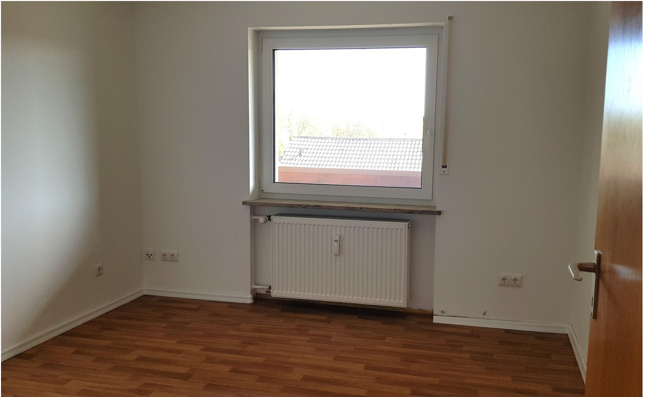
Kind Süd - Arbeiten