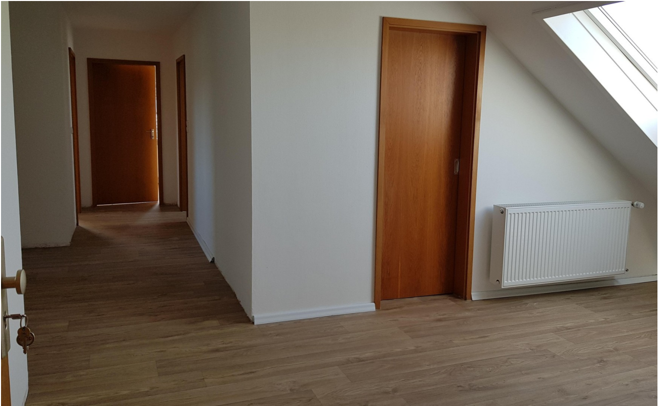
Diele - Essen