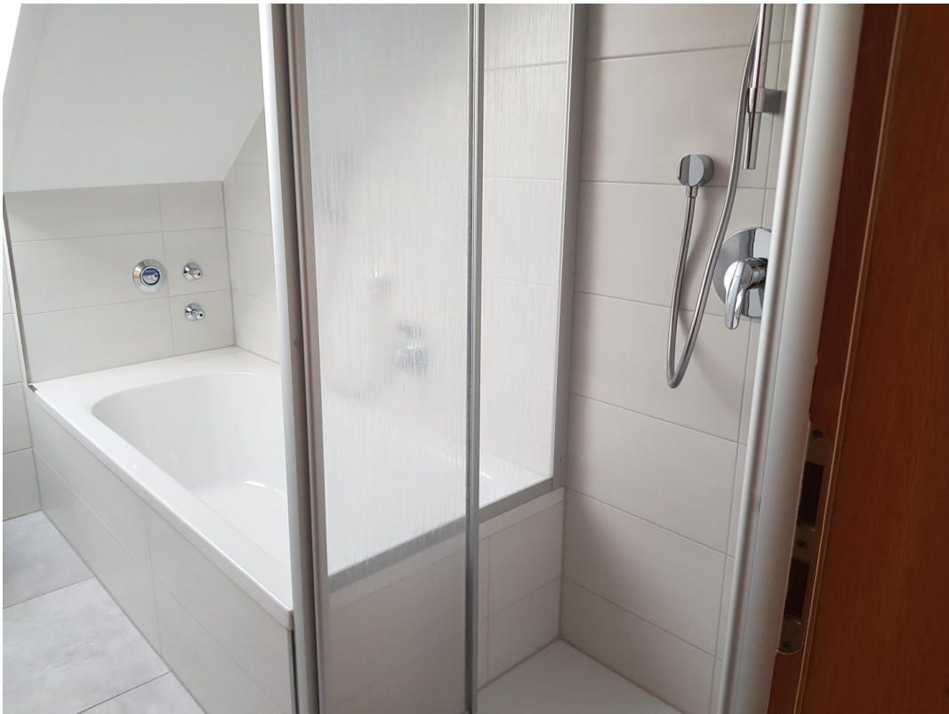
Wanne mit Dusche