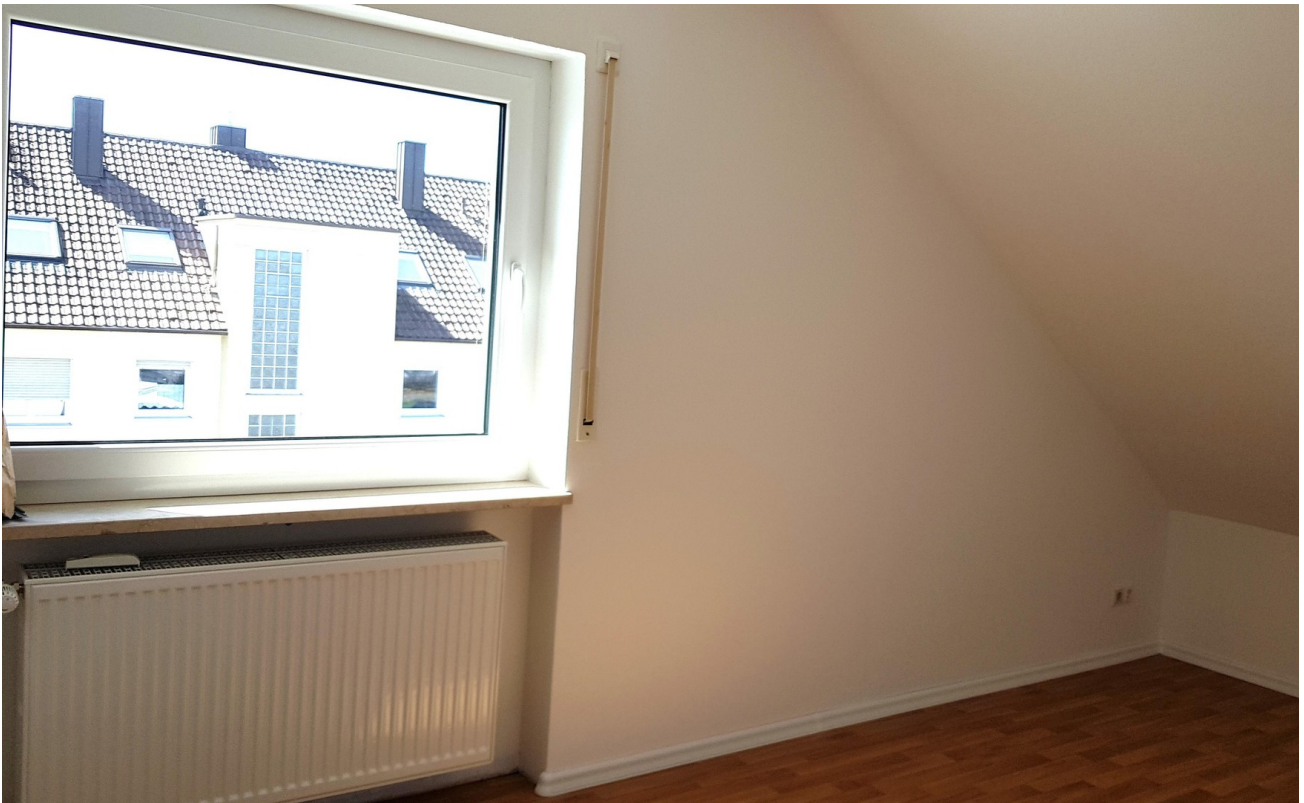
Kind West - Gäste